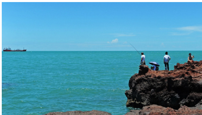
铿锵芋芳 在这里海钓，太爽了

喜欢钓鱼的朋友可选择滩钓、艇钓、船钓等方式。让客栈老板帮联系或直接与当地渔民谈价即可。