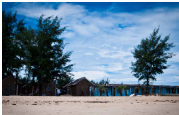
果味辣椒 海边的蓝色港湾

小肥 蓝色港湾是一个渔民家的民宿，有沙滩边的砖瓦房，也有沙滩上的独栋木屋。木屋数量有限先到先得。木屋和砖瓦房完全不是一个档次，意境上差太多太多（PS：是意境，完全不是追求档次和条件）……住这的福利就是你可以享受私家沙滩。对于我们来说之所以觉得涠洲岛值得来是因为我们的旅馆，还有火山公园！