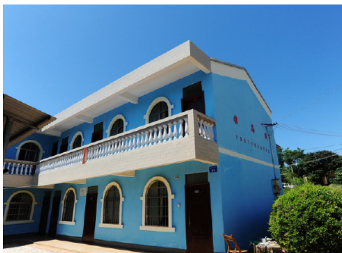
铿锵芋芳 海之梦雅居

铿锵芋芳 订了三楼的海景双标间，太赞了！干净整洁，宽敞明亮，空调给力，还能看到海景，还有观景阳台，不是旺季，120 元的价格，简直无可挑剔。但从海之梦走到沙滩大概要 5 分钟。先要穿过一片香蕉林，之后再从一片树丛中走过，最后还要下几级台阶，严格说来不是最方便的，特别是最后下台阶的地方还有些湿滑，如果不走这条捷径，就要绕行数百米，所以晚上天黑后从海之梦去沙滩还是挺麻烦的，或者说不是最安全。