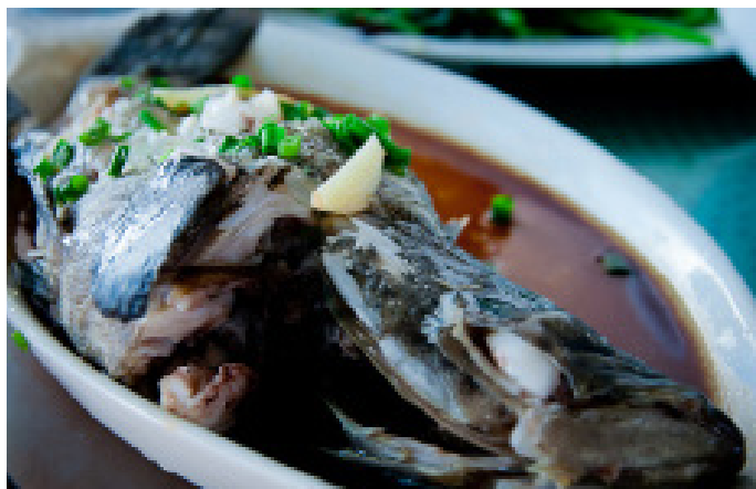
果味辣椒 石斑，60一斤，岛上的居民很淳朴，一点不缺秤