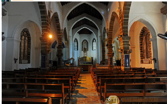
铿锵芋芳 天主教堂内