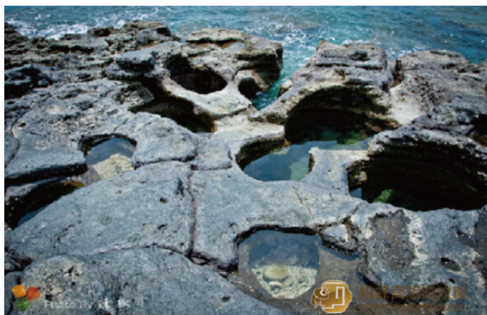
果味辣椒 火山遗迹

铿锵芋艿 来到月亮广场，眼前一片宝石蓝的大海着实让人惊艳，景色太美了，比起三亚鹿回头公园的海景，有过之而无不及。继续前行，走到山脚下有个分叉路，一边是通往月亮湾，一边是通往海枯石烂。很多游客走主线，放弃了海枯石烂，我认为非常可惜。海枯石烂走的路不多，但沿路都是近海的美景，非常值得一去。