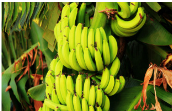
果味辣椒 涠洲岛到处都是香蕉树