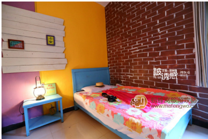
瞎鼓捣 房间的确很带感哦~美中不足的就是，有那么一点儿小暗！

TUERAFUSKI 这家客栈在东边，方便看日出；有小超市、租车、餐厅一应俱全，生活方便；然后房间有电脑哟，对于电脑比电视重要一百倍的人儿来说，这点我加十分！客栈装饰的很漂亮~我觉得是岛上最带感的一家了~缺点是房间略小，通风略不流畅，不过我觉得完全无大碍~现在岛上很多地方在修房子，看来过两年来玩选择会更多更丰富。