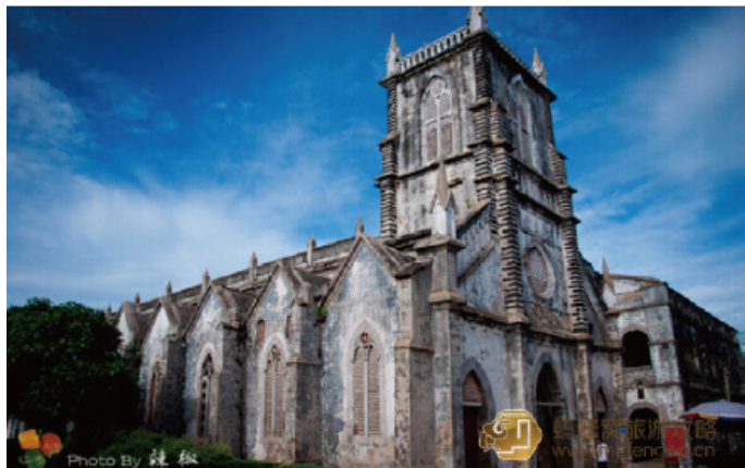
果味辣椒 北海最早的天主教堂

Hanmei 高大雄伟的天主堂，在四周低矮民居的衬托下，显得规模庞大，颇有气势。正门顶端是钟楼，高耸着罗马式的尖塔，有着随时“向天一击”的动势，造成一种“天国神秘”的幻觉，堪称别具一格。