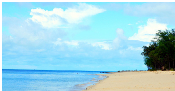
小肥 住在贝壳沙滩的福利就是……你可以享受私家沙滩