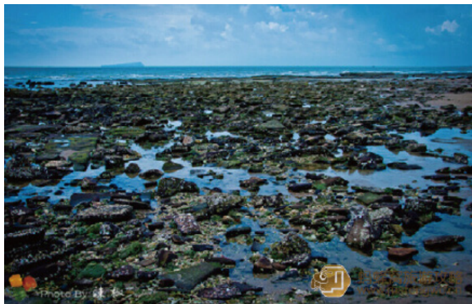
果味辣椒 色彩斑斓的五彩滩

原名芝麻滩，并不是因为滩上种了很多芝麻，而是因海滩上遍布着许多“花”岩石，深褐、鲜黄、墨黑、蛋青交错在一起，又层层摞积，凝固不动，但并不呆板，而呈现出如水流般的线条，因此“五彩”其实是斑驳的色泽，故又称为五彩滩。此外，有一段长 2000m、宽 200m 的沙滩上，有黑白沙粒如芝麻散落其间，更确证了其名。