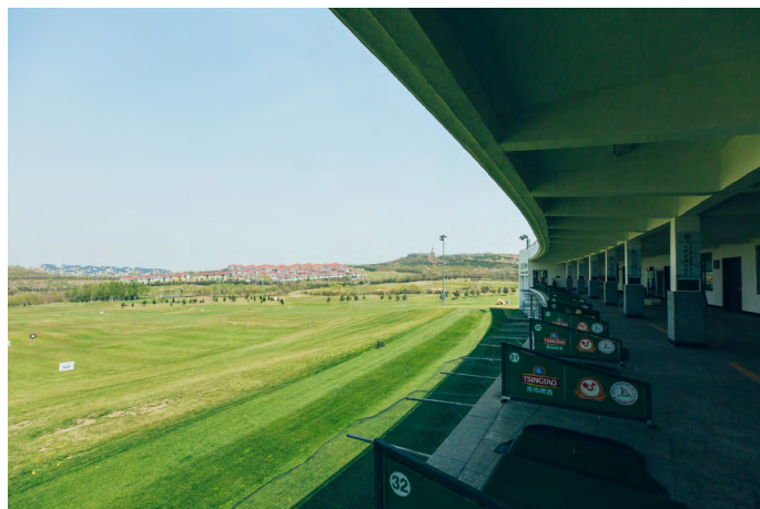
蝮蝎小姐 南山国际化的高尔夫训练球场

蝮蝎小姐 标准化的球场与球道，独具匠心的设计，开阔的视野，让我们在这里打球，不但锻炼了身体，一片绿意也养养眼睛，放松身心。