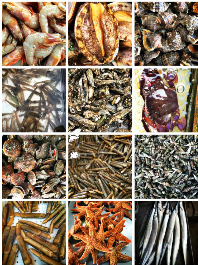
。咬静? 龙口海鲜丰富多样

比管就是鱿鱼。大的叫鱿鱼，小的俗称比管。种类很多，鱿鱼多用于烧烤。比管炖豆腐就是当地人比较常吃的一道菜。