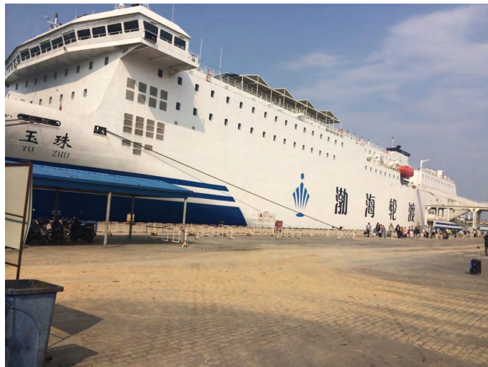
。安静？ 渤海玉珠号，很雄伟，很壮观。