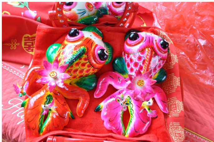
浪迹天涯 龙口人结婚时必备的面塑

花饽饽以面粉为主要原料，以刀、剪、笔等工具进行制作，需要发面、揉面、造型、蒸煮、涂色、描画，附件组合等工序。其中，造型是面塑比较难的一步，很考验面塑功夫，需要非常细致。