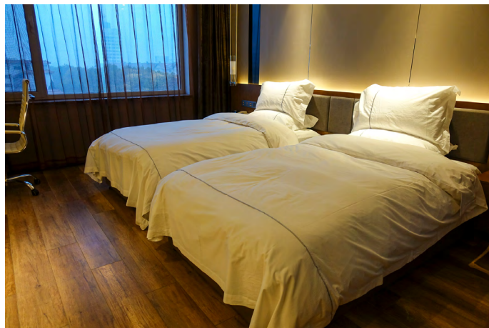
小柳同学 龙口大酒店

小柳同学 室内很洁净且现代，床头充电头自带 USB 接头，简直方便。房间还放了空气净化器，简直不能更人性化了。