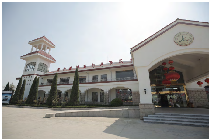
蝈蝈小姐 高尔夫俱乐部

蝈蝈小姐 300 多一晚的房间，包含双人自助早餐，去景区相当的方便，节省了路上的时间，性价比还是很高的。