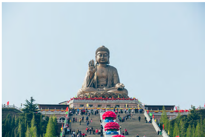
蛭蛭小姐 南山大佛

大佛莲花座下还有功德堂、万佛殿和佛教历史博物馆，园内也有多处晋、唐遗迹，如南山禅寺、香水庵、南山道院、灵源观、南山古文化苑等，时间充裕可陆续游览。每天还有两场药师颂动感音乐喷泉可欣赏，时间为10:30及15:00。