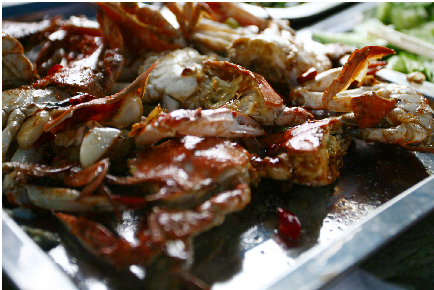
it' me 龙口的大螃蟹，新鲜便宜

龙口人称呼蛤蜊叫“嘎啦”。算是性价比较高的小海鲜，海鲜大排档的必点菜，价格实惠、料理容易。蛤蜊有几种，吃法也多样。辣炒蛤蜊、蛤蜊汤都是当地人常吃的，肉质鲜美，汤汁鲜甜。