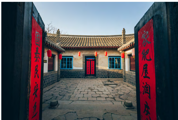
蝈蝈小姐 西河阳村的清代老宅——同德店老宅，是典型的四合院结构。