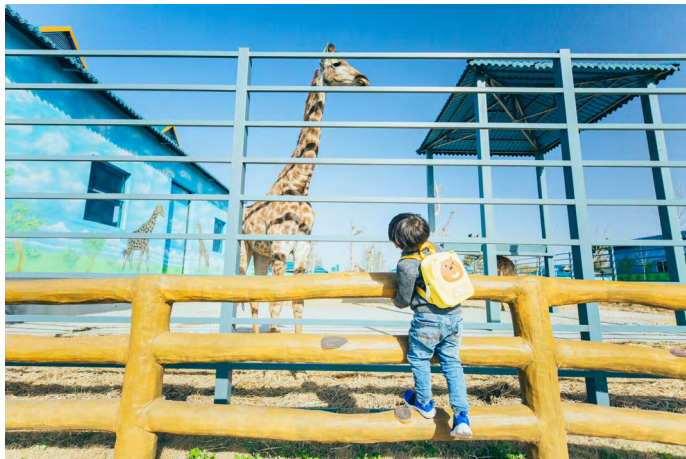
蝈蝈小姐 动植物园里的长颈鹿