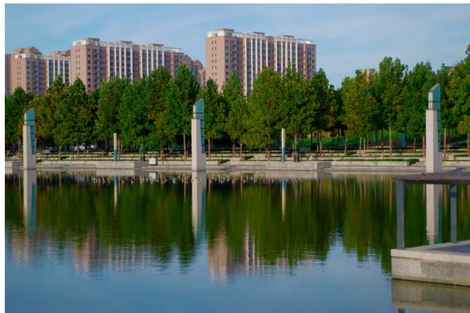
靓伊人 市政府和人民公园