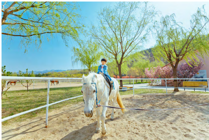
蛭蛭小姐 在马术俱乐部里有单次体验骑马项目，针对年龄小的朋友，教练会牵着马跟他们一起走

园内主要景点有古色古香的南山大院，这座青堂瓦舍为老黄县民间传统建筑风格，可欣赏到面塑、剪纸、传统婚庆等民俗艺术及风土人情。此外，还有千年紫藤、观音岛、宠物园、南山热带雨林植物园等，适合带孩子游玩。若时间充裕，还可到草场广阔、配套设施完善的南山马术俱乐部，体验纵情驰骋的快感；或到南山拓展训练基地边玩边练，挑战极限。