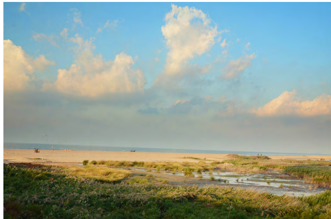
神楽 海边有一大片芦苇，非常漂亮，很适合拍人像