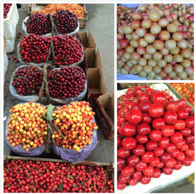
。安静？ 龙口大樱桃，有黄玉、梅枣、黄水晶等多个品种