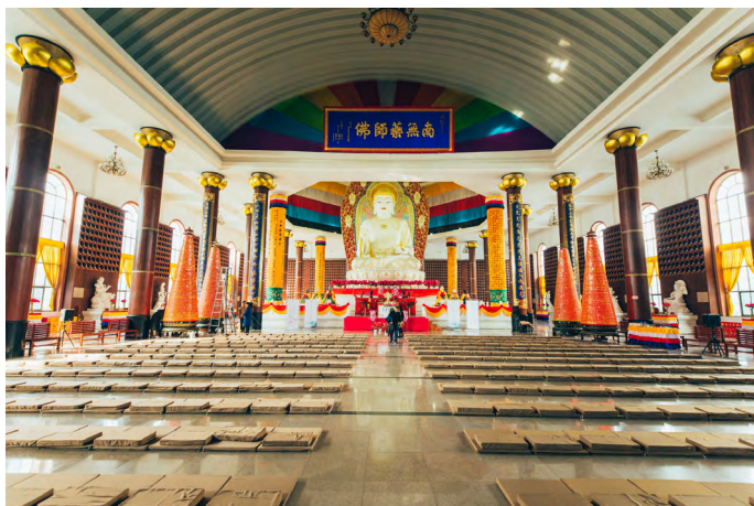
蛭蛭小姐 南山玉佛殿是南山主要的开坛讲法的场所

特别一提的是，药师玉佛周围还供奉着不同颜色的药师六如来像，与玉佛共同构成药师经法上称的药师七佛，于此观瞻，十分震撼。