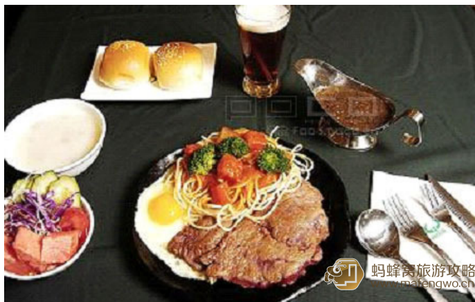
诱人的墨西哥牛排