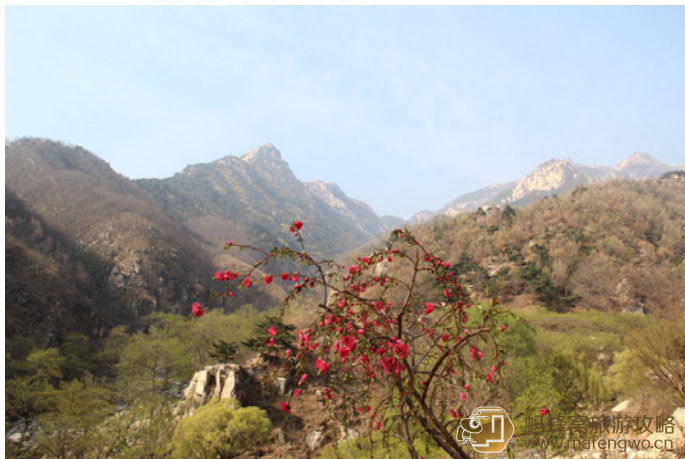
2011 行在路上 天烛峰远眺

注意天烛峰景区、彩石溪景区上下山者，路上没有商店补充水源。到了冬天，山上的水管结冰，很多标间无法洗澡，这点需要注意。天烛峰景区平时游人很少，比较安静，景色秀美，可以考虑游览。(济南爱自由)