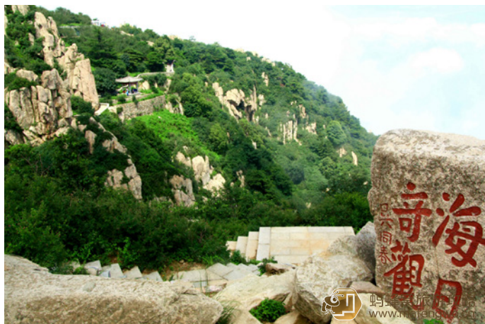
打雜工仔 泰山景观