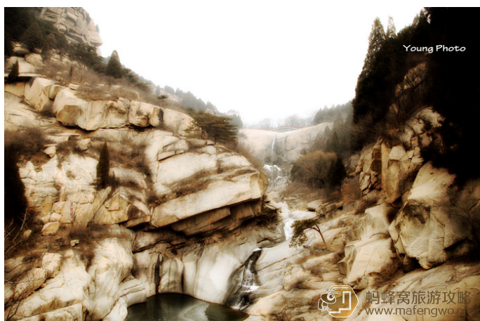
TITI 黑龙潭、长寿桥——从天外村经大众桥，沿石阶上行即可到达，路途中有指示牌，途中经过一个票务检查站。

黑龙潭东南有石亭，名西溪亭。潭北东百丈崖上建有长寿桥，昔年岁久远，已成危桥。桥两侧有石亭相对，东为云水亭，西为风雷亭。桥南潭上崖边有几条平行白纹横贯东西，俗名阴阳界。崖边至长寿桥之间是一坦阔石坪，游者在其上观景戏水，其乐融融。过长寿桥前行，可通往扇子崖、傲徕峰。每逢夏秋之际，阴雨连绵，三条瀑布犹如玉龙从崖颠凌空而降，古称“云龙三现”。