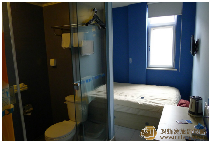
流光飞舞 百时快捷酒店 (泰安岱庙青年路店)