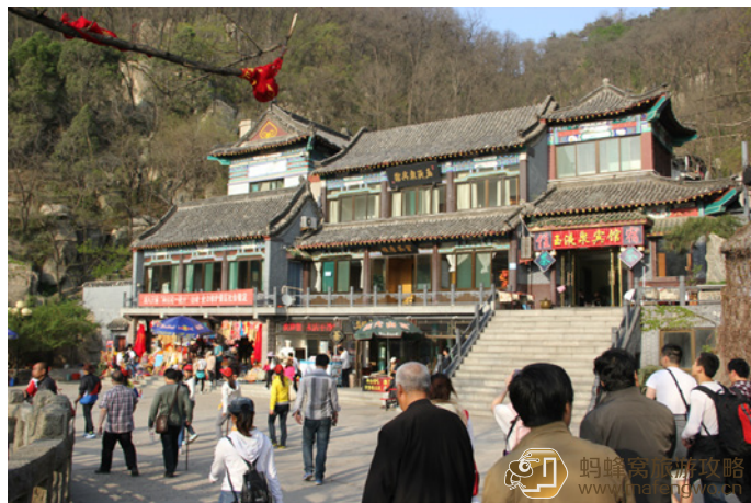
享丫亭 传说中的玉液泉宾馆