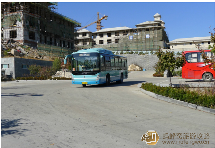
流光飞舞 天烛峰下山后, 没多远有个停车场, 有19路公交车

小才 打的从泰山火车站至红门费用10元钱。建议去泰山打的不要在火车站正前面, 可以往两边的路上稍微走一段。