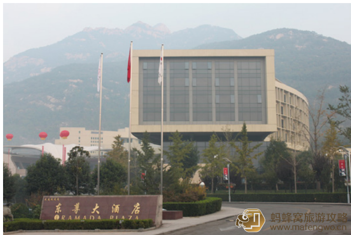
Lacuna 泰安东尊华美达大酒店的外观

风行天下 我们住的华美达，很不错啊！如果预算不紧很推荐。毕竟 2 个人 500 不到住 5 星还是价格合理的。还有为了爬山要休息好嘛。据说山上的宾馆贵。所以最好半夜出发，早上能看到日出。