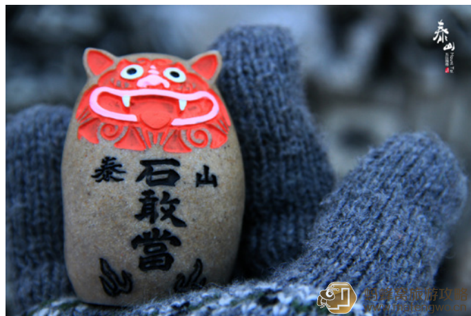
紫皮儿蒜 泰山石敢当

那里全都是卖泰山石的。不过小心有假的，要狠砍价。但好歹比天街上的好一些。泰山只产墨玉，这个可以考虑一下，其余的玉还是不要在泰安买比较好。