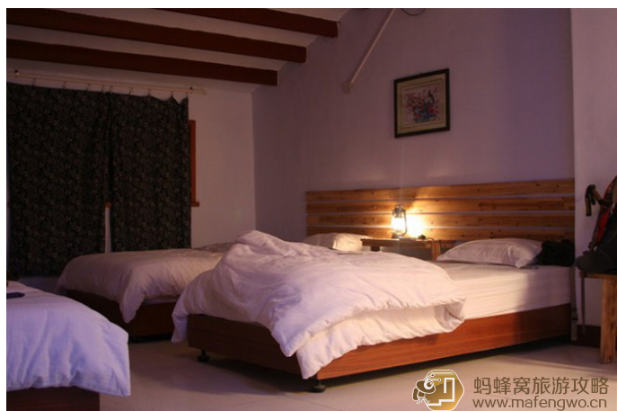
九号半 山水缘客栈。

九号半 两个驴友合作开的，给人的感觉很棒，装修很用心，设备齐全，干净，卫生，第一次发现旅店的被子和床单可以那么干净，而且没有一点异味，到的只是阳光晒完的清香，太舒服了。