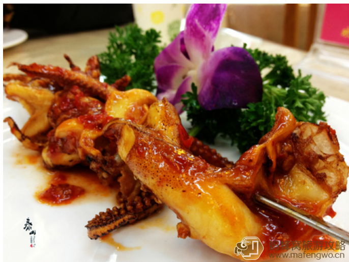
紫皮儿蒜 胶东庄户城给力的烤鱿鱼，一定要试试！

紫皮儿蒜 胶东庄户城一样遵循着山东菜的特色，就是量十足的大！味道自然也是正宗的，推荐他家的烤鱿鱼，太给力了！