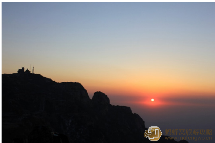
济南爱自由 日观峰看日出，一个汗字。

泰山的日出、雾凇和云海是泰山的三个奇观，很多人为了看泰山日出，不惜夜爬泰山，当然，也有很多人为了雾凇、雨凇或者云海而来。观泰山日出最棒的地方是在岱顶的拱北石（p），它是泰山标志之一，如果天气好，还可观云海玉盘奇景。