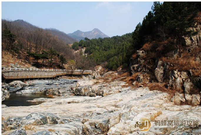
青柠 此乃彩石溪也

春日里，孕育着勃勃生机。嘀嗒、嘀嗒的春雨。桃花嫣然笑春风；夏日里，满目密不透风的蓊郁茂盛，流云涌潮，飞瀑直泻；秋日里，是一幅浓墨重彩的油画，七彩绚丽，斑斓多姿，深沉厚重；冬日里，静穆庄严。雪花的精灵翩然起舞，银树琼枝，红装素裹，分外妖娆。