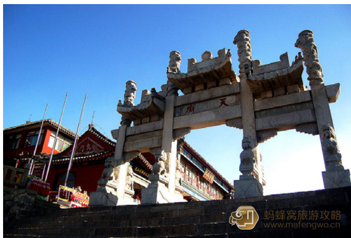
季风中的马 这就是天街的牌坊了。

附近景点：“象鼻峰”、“白云洞”、“青云洞”、“孔子崖”“孔子庙”、“北斗台”、“斯碑岩”等