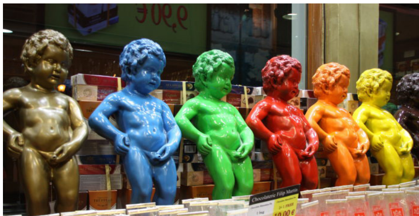
苏格兰方格儿 布鲁塞尔最著名的小朋友—撒尿小童

提到比利时, 首先让人联想到的就是巧克力。把比利时称为“巧克力王国”一点也不为过。无论是巧克力的品种、产量、人均消耗量或推陈出新, 比利时都居世界前列。几乎每个到比利时来的游客都要购买比利时巧克力作为礼物或者自己品尝。