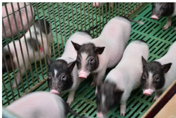
往事 隨風 小猪崽很可爱，而且胆子很小

此外，如果您想养一只可爱的另类宠物，也可以考虑带回一只真正长不大的袖珍小猪“巴马小香猪”。一只真正的广西巴马小香猪体重绝对不会超过 20 公斤，智商非常高，爱干净喜欢洗澡，如厕固定，并且认识自己的主人，喜欢与熟人撒娇。