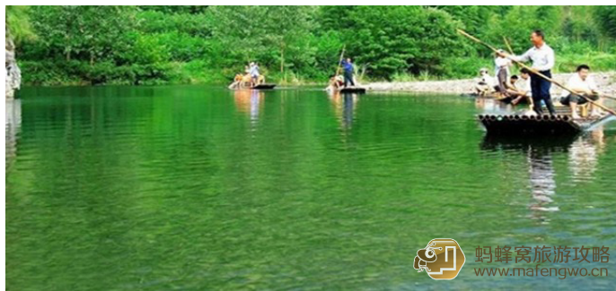
宣城 - 江南第一漂

江南第一漂位于徽水河流经泾县的最后一段，上起乌溪乡姚村，下止黄村镇，景区全长约 20 公里。景区内河道蜿蜒曲折，水流湍急，两岸层峦叠翠风光绮丽，是休闲旅游的好去处。