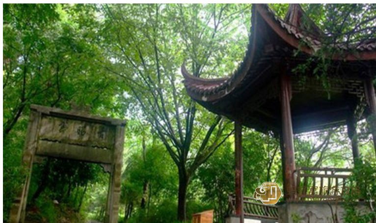
跟我走四方 李白诗中的敬亭，古称昭亭，因避晋文帝司马昭名讳而改名敬亭。现在的敬亭是复建的