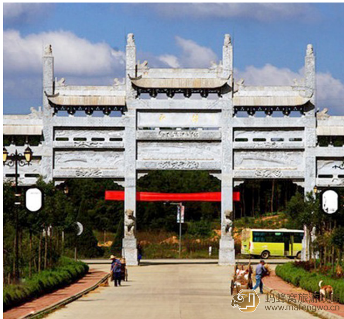
蝠翼清流 江村的大门口

江村，别名金鳌村，位于旌德县白地乡，紧靠205国道。该村建于隋末唐初（600年左右），是一个有1300多年历史的文明古村，这里古祠巍峨，牌楼高耸。现有明清时代的徽派古建筑多处，如溥公祠（六分祠）、明孝子文昌公祠、父子进士坊等。