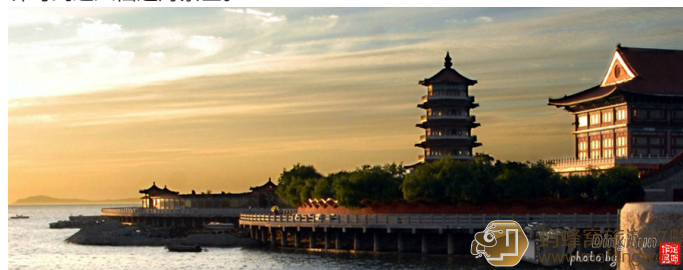
定坤 八仙过海传说在春夏之交，常有海市、海滋出现。

（3）济南方向：济青高速——潍莱高速——威乌高速——蓬莱出口下——向北直行至海滨——向东沿景区指示牌行驶——景区，下高速后约 20 分钟可到达八仙过海景区。