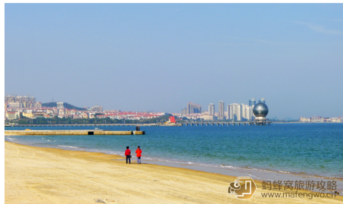
飞象 烟台，一望无际的大海。