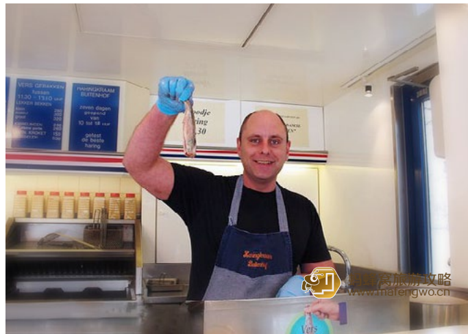
阿兹猫 代表性的食物鲱鱼

阿兹猫 看《大国崛起》系列里面的荷兰篇, 关于阿姆斯特丹的崛起, 有这样一句话让猫猫印象深刻的话: 建在鲱鱼骨上的城市。这个三分之一国土位于海平面之下的小国, 深受大海的恩赐, 鲜美的鱼类经常入菜, 而最具代表性的食物应该是鲱鱼。