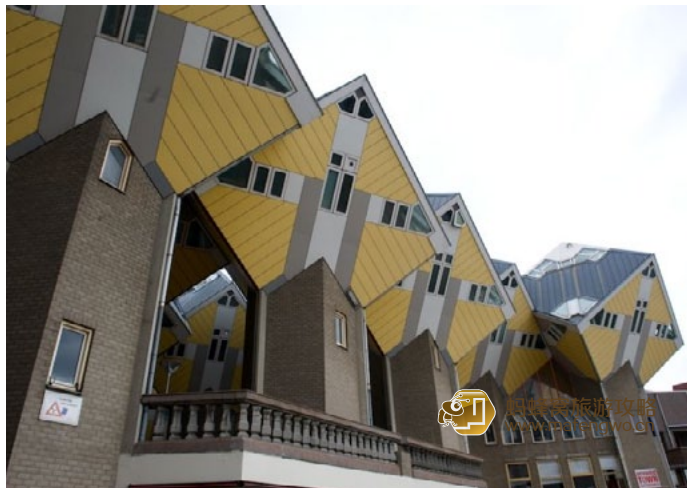
凯尔特战士 Stayokay 青年旅社就在这立体方块房子里面

这个青年旅舍位于 Blaak Metro Station 地铁站对面著名的立体方块屋内，独特的建筑风格另每一位游客都想体验在这里住宿的感受。附近是著名的 BEURSTRAVERSE 购物中心。酒店设有自动售货机、小酒馆和酒吧，且提供免费无线网络连接。每间客房都配有淋浴和卫生间。