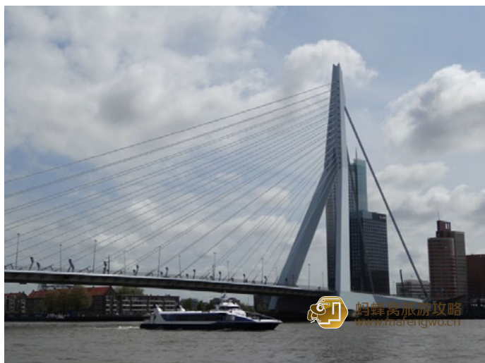
初仔 伊拉斯姆斯大桥

地址：Wilhelminakade 111, 3072 AP Rotterdam