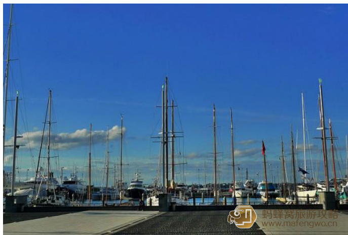
阳光毛毛 奥克兰人酷爱扬帆出海，他们会抓住一切机会，成群结队地奔向离家最近的海滩或港口。

原来是繁华的商用港口，曾经是美洲杯帆船锦标赛的赛场，现在这里是时尚餐饮的聚集地，每晚都人流不息。成群摆放的游艇，具有历史意义的牌匾和城市雕塑，使得这里成为非常适宜漫步和休闲消遣的地方。