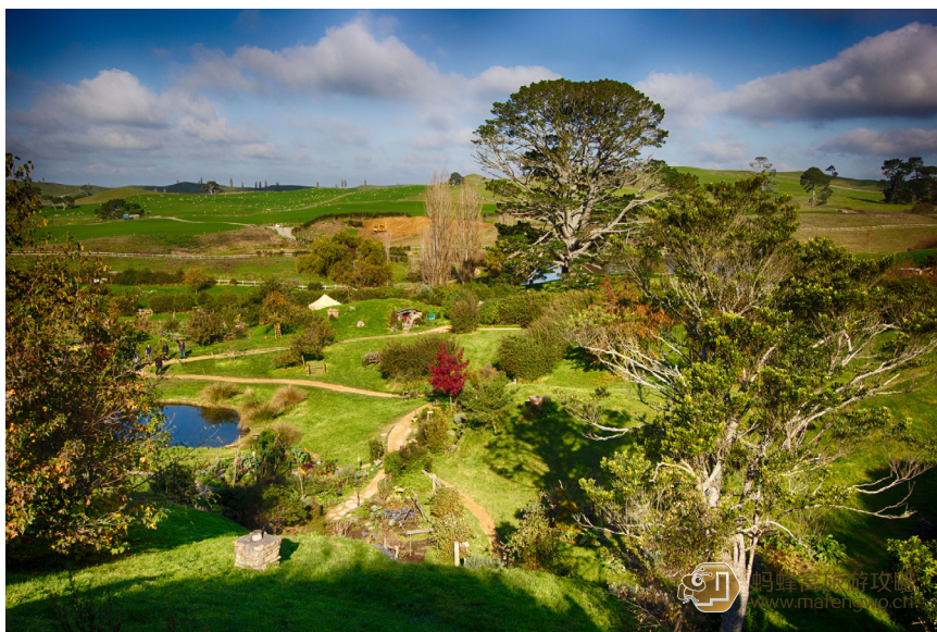
见异思迁 霍比特人村

奥克兰是新西兰最大的城市，位于新西兰的北部，人口有 136 万，三面朝海，一面靠山。可以说没有一个城市像奥克兰那么有地理优势，夹在两个海湾之间，周围环绕着肥沃的农田。另外，整座城市都是沿着火山堆建造的，因此有火山之城的美称。由于海水近在咫尺，据不完全统计，平均每三户人家就有一艘游艇，整座城市的码头一共停靠着约 138000 游艇，远近闻名的“千帆之都”的美誉因此而来。