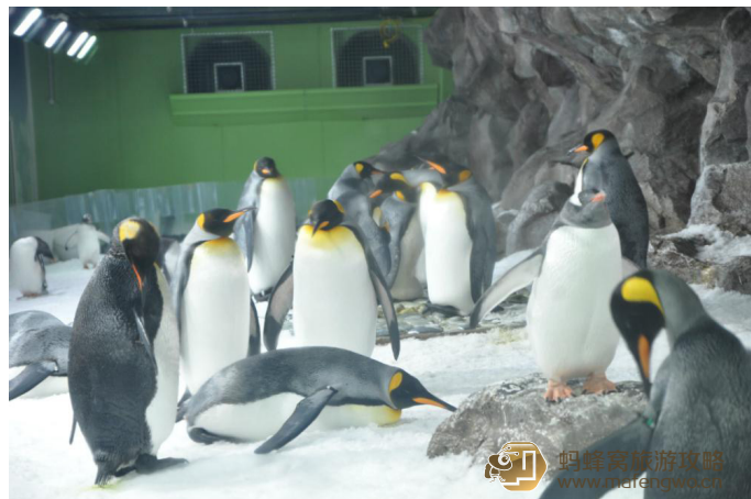
司徒卷卷 凯利塔顿海底世界

凯利塔顿海上世界是新西兰海洋考古学家的杰作，于1985年对外开放，乘坐观光梯穿过透明的隧道，可以观赏各种鱼类在头顶游曳。当然这里最引人入胜的景点就是这里永久的冬日仙境，在这里你可以看企鹅，还可以驾驶雪地车穿过冰雪世界。