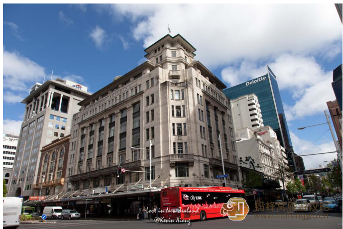
痒痒的熊熊 皇后街一角

皇后街是奥克兰有名的商业中心，位于市中心。也是游客必去的购物街区，两边大型商业机构，商场林立，可以在这里买奢侈品，也可以在这里淘到新西兰特产，基本上能满足你扫货的需要了。