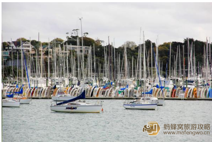
休闲人 港湾里停满各式各样的帆船

这里可是鼎鼎有名的千帆之都啊，没有比驰骋在海湾中更能贴近奥克兰的心脏与脉动了。在奥克兰有千百种亲水方式，可以乘坐游艇出海赏鲸，可以潜水，还可以在当地租一块冲浪板跟当地人一样在海滩冲浪。但是为了避免晒伤，大家还是做好防晒措施再撒欢儿玩吧。