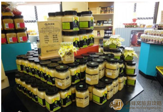
旅途老马 麦卢卡蜂蜜