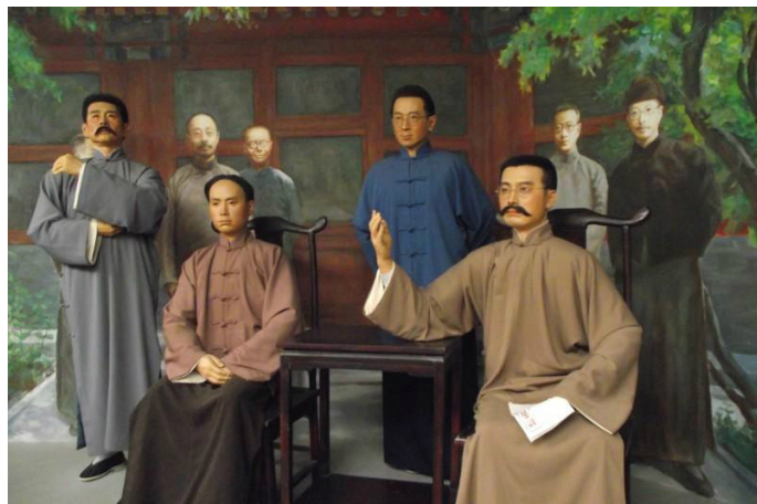
雪舞满天纷纷落 李大钊纪念馆

李大钊纪念馆包含两部分，分别是位于大黑坨村的李大钊故居和位于新城区的李大钊展览馆，不过人们一般直接将展览馆部分称为“李大钊纪念馆”。位于新城区的纪念馆，由江泽民总书记题写馆名，既是李大钊同志生平业绩的展览中心、研究中心，同时也是爱国教育基地和旅游胜地。纪念馆内陈列文物、文献、图片等珍贵资料，让后人能充分的了解这位共产主义先驱的生前风采。纪念馆主楼的西侧还建有占地面积达6000平方米的李大钊纪念碑林，展出了碑刻及复制碑60余块。碑林从不同层面展现了李大钊思想和世人对这位伟大的革命先驱的深切怀念，同时也是纪念馆园区的一处独特景观。