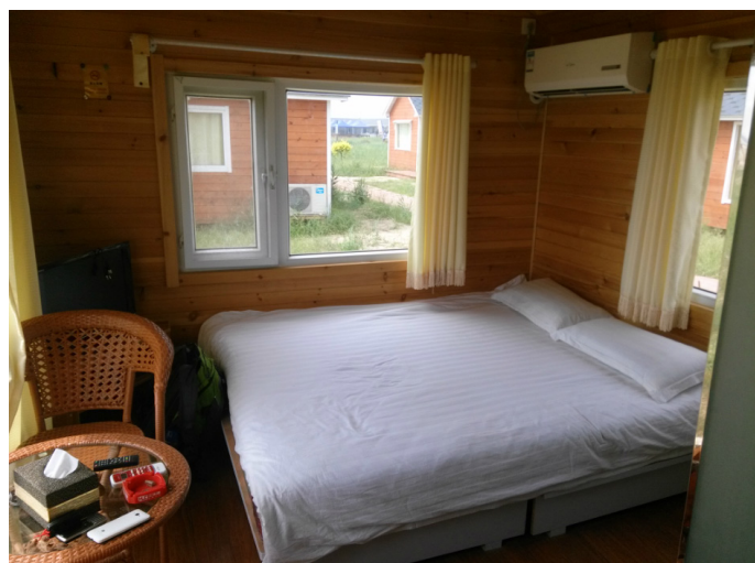
落叶树的妞妞 碧海浴场木屋住宿

落叶树的妞妞 其实我第一眼看上的就是他们这边的沙滩小木屋，有大玻璃窗可以直接看到沙滩和海~~屋子不大，但足够住了，主要是干净！！可能因为刚开业的原因，一切都是新的。