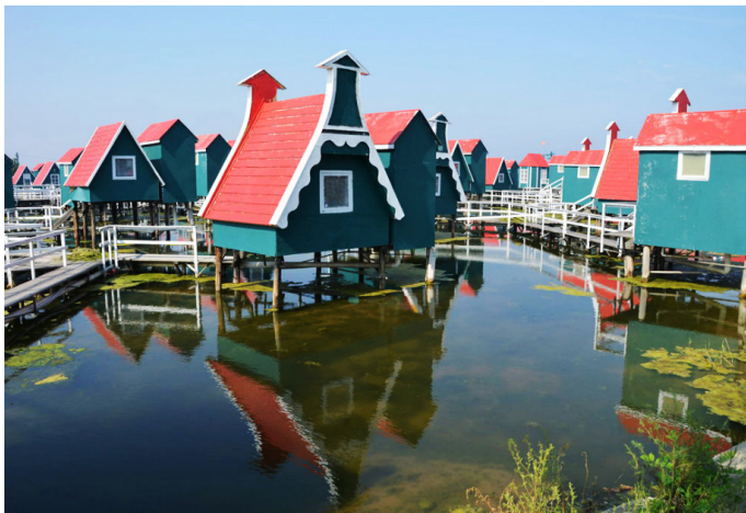
老龙王戴花镜 月坨岛荷兰风情小木屋