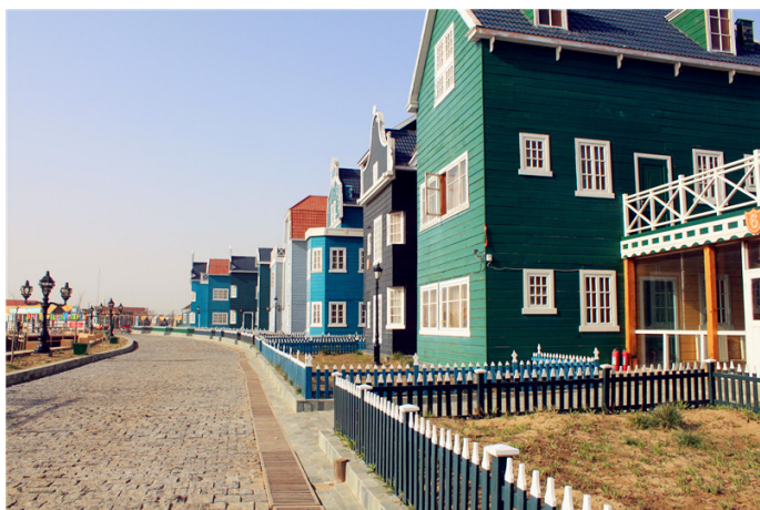
36 号神经病 莉莉丝别墅

月坨岛上的荷兰风情浓郁，不仅有著名的水上小木屋，还有联排的荷兰风情别墅区。这片别墅名叫莉莉丝别墅，是游客们住宿的又一选择。别墅内提供双人标间，带有独立卫生间，可享受岛上开发的温泉水洗浴。别墅周边种植有鲜花与灌木，风景优美，情趣盎然。