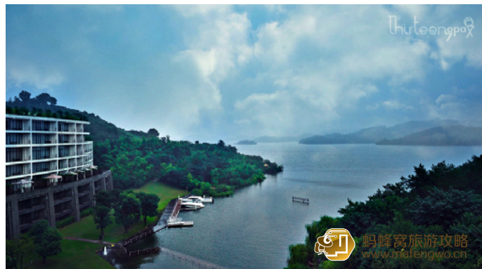
十三疯 溧田半岛中有个叫天目的绿野仙踪