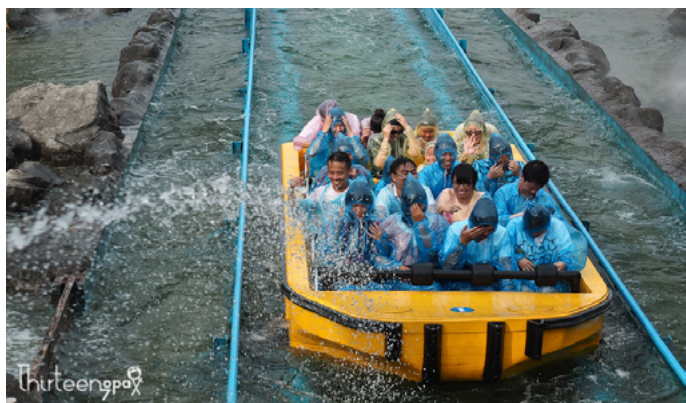
十三疯 恐龙园水世界里的激流勇进

十三疯 激流勇进是游乐场必有的项目。以前记得都不穿雨衣，现在还要买雨衣，玩激流勇进不湿身，那还有什么意义。很多人怕坐第一排，以为水大，其实不然，前面船头激起的水都会往后飞的，后面湿的才最厉害