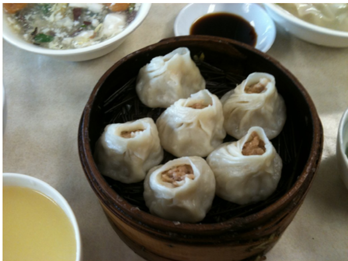
大梅沙lv糕团店的加蟹小笼，名字给力，味道极鲜