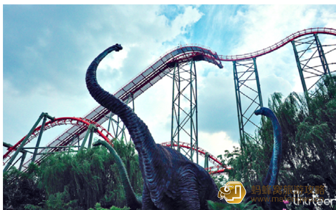
十三疯 恐龙园最著名的4D过山车——过山龙

建议想玩好刺激项目的一定要避开节假日，否则排队排上1小时也是家常便饭。若是人多，建议领好入园指南，规划好次序和路线就可避免浪费时间在排队上。需要注意的是，园内适合1.2米以下儿童的项目不多。出园打车不方便，最好提前预约。