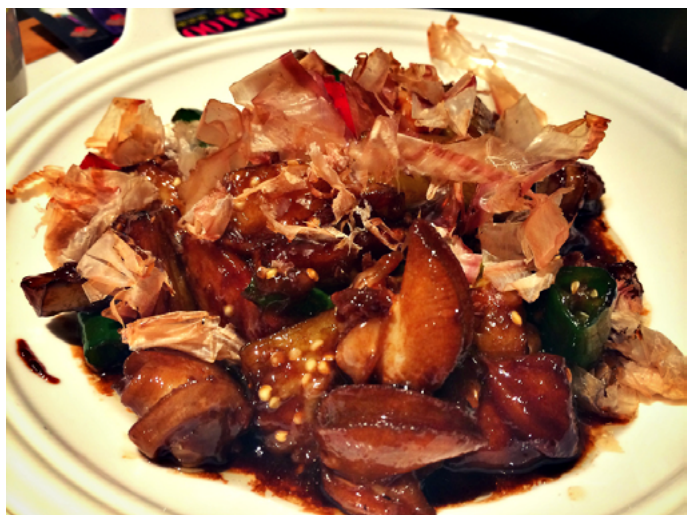
十三疯 “会跳舞的蜗牛茄子”好洋气的名字！

箫篁 不错的店，装修风格都蛮喜欢的，菜的味道不错，跟朋友去的时候没等位，直接就坐，上菜速度也不错哦。