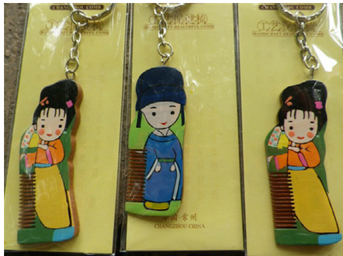
菜菜 纪念型的常州梳篦

常州梳篦、乱针绣、留青竹刻并称“常州三宝”。常州梳篦自魏晋南北朝流行至今已有1500多年的历史。常州梳篦，昔日为宫廷御用的宫梳名篦，现已成为百姓家中每日梳头洁发的必需品和收藏品，并且远销国外。常州梳篦系天然材料制成，据现代医学研究证明：经常使用，有缓解头痛、治疗失眠、醒脑、聪耳、明目之保健功效。梳篦按大小及材质不同，价格也不同，从便宜的几元甚至上百元都有。“白象牌”是比较老的品牌。适合送朋友，买前可尝试梳一下，舒服适合为宜。