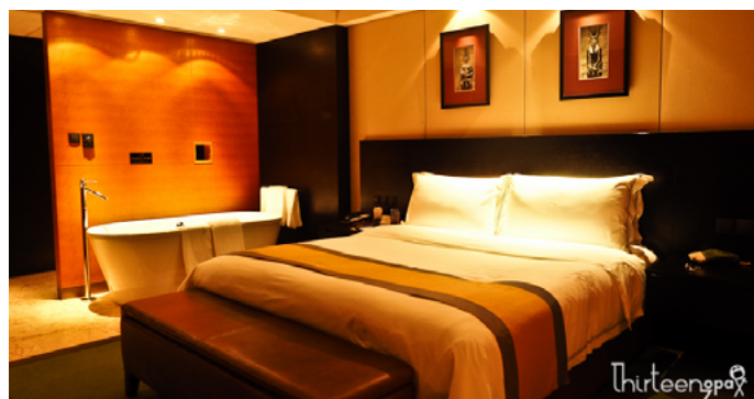
十三疯 客房是标准的 5 星，舒服

十三疯 涵田半岛度假酒店是天目湖我认为最棒的度假酒店。我是冲着温泉来的，但没想到的是屋里并没有温泉，还需要去外面泡，不过晚上 11 点才关门。因为晚上我来得晚，人几乎没有，真的是太爽了，60 几个温泉随意散落在山体自然起伏之间。只因是晚上，看不到什么景色了，还是有点可惜的。酒店是天目湖周围的一个特别的存在，白天这里能看到绝大部分的天目湖，所以来了涵田，天目湖就尽收眼底，而距离湖边也仅仅几米之遥。