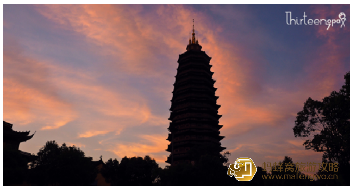
十三疯 夕阳下的天宁寺