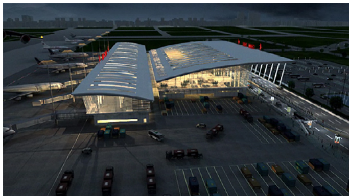
风车车 常州奔牛机场

机场交通：机场大巴 15 元 / 人，每天 9:50-1:50 有班车，具体发车时间会根据航班情况调整，乘车地点：机场候车楼一楼出口处，终点：常州民航服务中心—市区城市候机楼