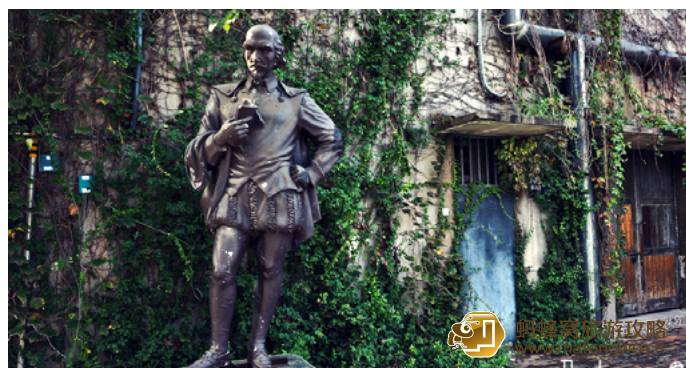
十三疯 离天宁寺不远，开车也就10分钟的样子。同比798这里那真是小了很多，而且没有人，特别的冷清。据说夜晚在运河边上会有很多酒吧，还会热闹一些。

一偏爱左边 文艺小青年必来的地方，前世是老厂房，充满回忆的地方，经常会搞一些活动，画展、美食展。里面有很多有情调的酒吧，锅炉房、空白格。还有个性店家，恒源畅书吧、第壹章节葡萄酒会所、玛韦斯德国餐厅，还有青年旅舍。