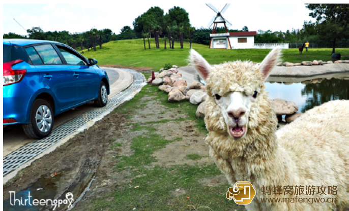
十三疯 从淹城遗址出来，旁边就是淹城野生动物园

地址：常州市武进区武宜南路 588 号 费用：门票 150 元（10.2 米以下儿童免费，1.2-1.5 米儿童及 60 周岁及以上老人凭证每人 75 元）；自驾车 200 元/车（车上人员需另外买票，10 座以下）；租代步车 60 元/时；爱心投喂 5-10 元/个 网址： http://www.yczoo.com/ 开放时间：9:00-17:00（乘小火车 16:00 截止） 演出时间：动物表演时间根据季节的变化会有变动，下列供参考：表演地点：森林大马戏表演场，表演内容：森林大马戏，表演时间：周一周五 13:00、周六周日 11:00、14:00；表演地点：百兽斗秀场，表演内容：猛兽表演，表演时间：周一周五 11:30、15:00、周六周日 12:00、15:00；表演地点：东门内广场，表演内容：小丑迎宾，表演时间：周六周日 9:30-10:30 联系方式：0519-68881111/69698959/88266726 到达交通：在春秋乐园旁，步行可达 用时参考：3-4 小时