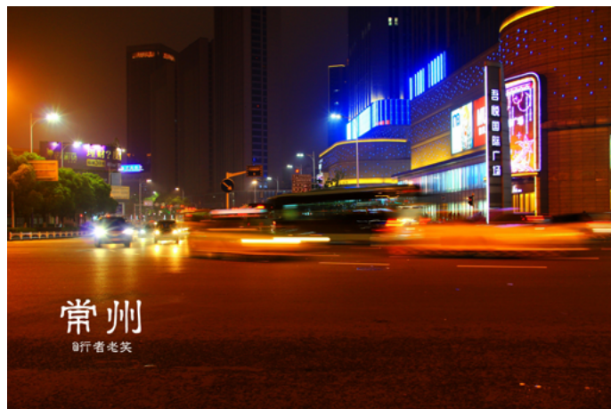
行者老笑 找了个栏杆作支架，这么好的夜景可不能错过