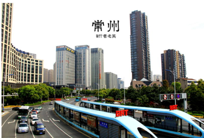
行者老笑 西新桥 BRT 车站

常州公交线路很多，有三种车次，即普通公交车、空调车、快速公交车 BRT 线路，票价均 1 元，刷卡 0.6 元。快速公交车 BRT 还可站内换乘，市区都为空调车。其中，Y（游）1 路公交车是当地的观光路线，可去往市内的几处景点，如红梅公园、天宁寺、文化宫、人民公园、青果巷（长安大厦）、西瀛里、篦箕巷、瞿秋白纪念馆（早科坊）、文笔塔。