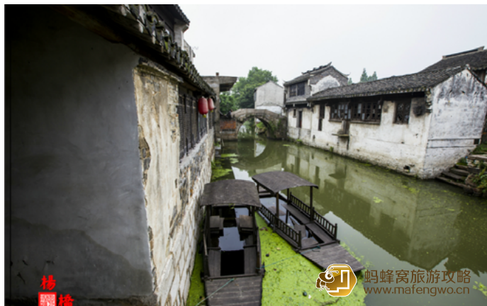
sniperzp 杨桥古镇不要门票，游人很少

这座以村南有一座单孔石拱桥“南杨桥”得名的古镇，与江南的名镇名村相比，其体量和历史文化积淀虽称不上顶尖，但保存完整是其今天最大的优势，游走在镇内的古街古巷，那古河、古桥、古井、古宅，甚至是古屋上的门窗、屋檐角也依然风貌犹存，古韵十足，令人叹为观止。再加上家家户户都挂满了红灯笼，让沉静的老镇也不失活泼一面，大可尽情用你的镜头发挥创作，只是不要惊扰了当地人家。