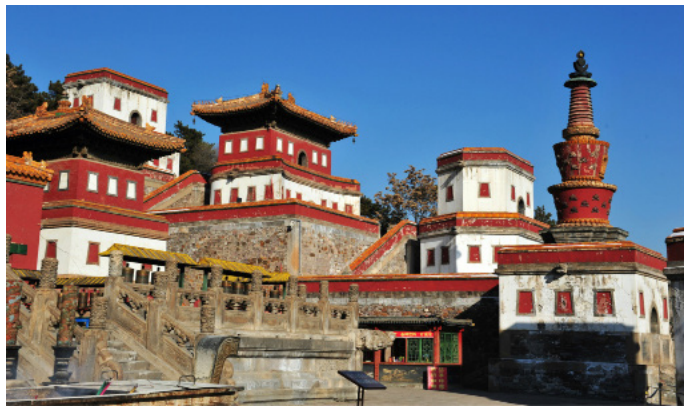
害人精 普宁寺景区

景区由皇家寺庙群中的普宁寺和普佑寺组成。普宁寺是仿西藏最早的佛教圣地三摩耶庙的式样而建，融汉地佛教寺院和藏传佛教寺院的建筑格局于一体，寺内供奉有世界上最大的金漆木雕佛像——千手千眼观世音菩萨。普佑寺是喇嘛研习佛教理论典籍的经学院。