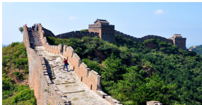
热爱足球的 IT 界影评 摄影者的天堂

傅师康 金山岭顶峰上的楼台称为“望京楼”。楼分上下两层，站在楼顶，北眺可见承德的棒槌山，南望可及北京城的轮廓。山势陡峭的将军顶上一段长城有尺余宽，300 多级砖台石阶，被称为“天梯”，基本上属于直上直下。登上天梯，有一座挺拔高峻的“仙女峰”，峰孤势险，峰顶上还有一座“仙女楼”，常常被云气笼罩，故而又雾中之阁。