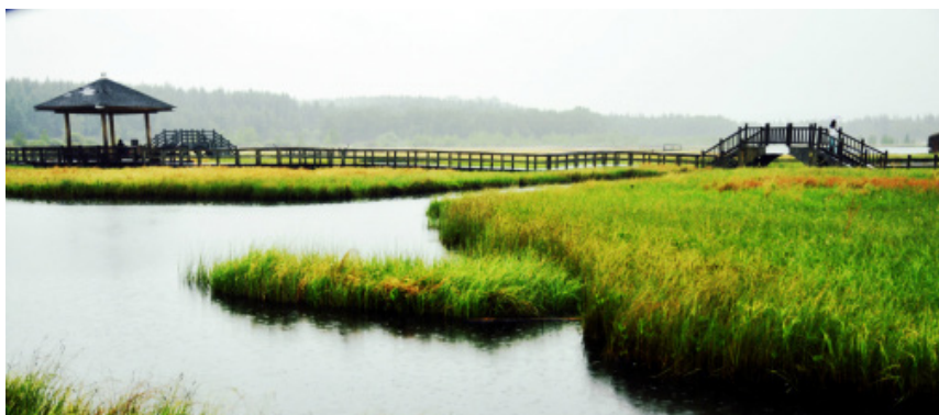
Eternal33 水清草碧的木兰围场

木兰围场自古便是清朝皇帝狩猎的场所，每年七八月间，一望无际的碧草连天，姹紫嫣红的野花绽放，大大小小的湖泊宛如仙子散落的水晶珠链，给木兰围场增添了几分灵性。策马扬鞭，头顶蓝天白云，奔驰在碧绿的草场中，你自己都分不清这是画还是现实。如果赶巧，还能遇上——一边艳阳高照，一边大雨倾泻如注的奇妙天气。