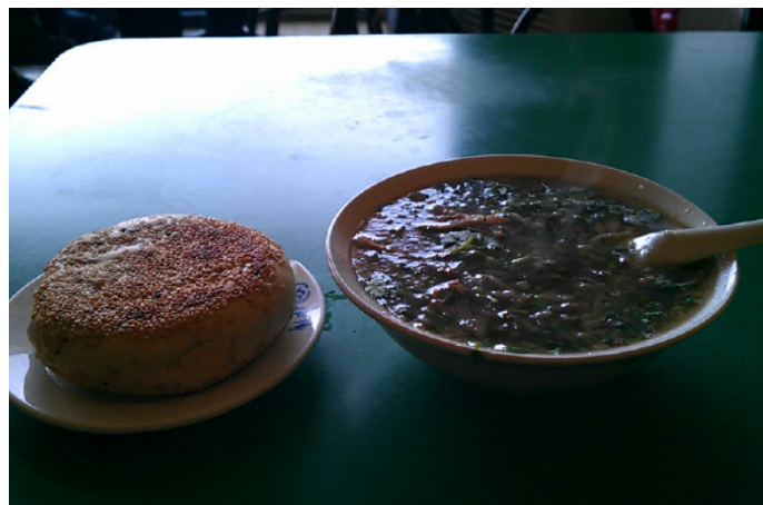
行走中的胖子 美味又营养的老三羊汤

行色 到承德一定要去一去老三羊汤店。羊汤很鲜膻味不重，汤里面有羊肚，羊肝，羊肺，羊肠，吃的时候在放上点辣椒油和醋，那味道才是绝了。喜欢吃饼的朋友还可以配上芝麻饼，也很美味哦。