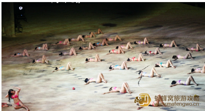
老虎的师傅 《印象海南岛》实景演出

到海口，一定要抽时间去欣赏《印象·海南岛》，这是一场以大海为实景、以大海为主题的实景演出。演出以音乐剧为主，通过独特的魔幻水升降舞台将海南岛独有的热带休闲文化表现得淋漓尽致。梦幻舞台、浪漫夜空映照下，剧场每晚还燃放激情焰火，水上烟花与外沙滩烟花齐放，与《印象·海南岛》的演出一同照亮黄金西海岸灿烂的夜空。