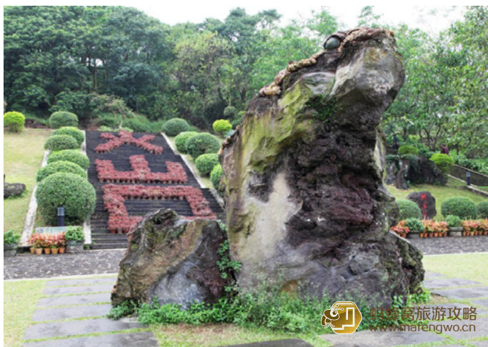
稻草人 雷琼海口火山群世界地质公园

我国唯一的城市滨海热带火山，也是海南省第一家世界级旅游景区。公园地质遗迹主体为40座火山构成的第四纪火山群，似一座座天然的火山地质博物馆。标志性景观是马鞍岭火山口，融合在古榕树群、野菠萝群、热带水果林之中，展现了火山的无比魅力。