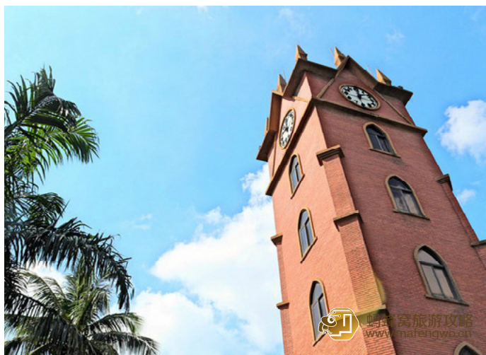
温塘飘飞 姿影绰约的钟楼

钟楼面向入海口，南面中山横街与中山路相对，北临海甸溪，依街傍水，姿影绰约，景致十分幽雅。