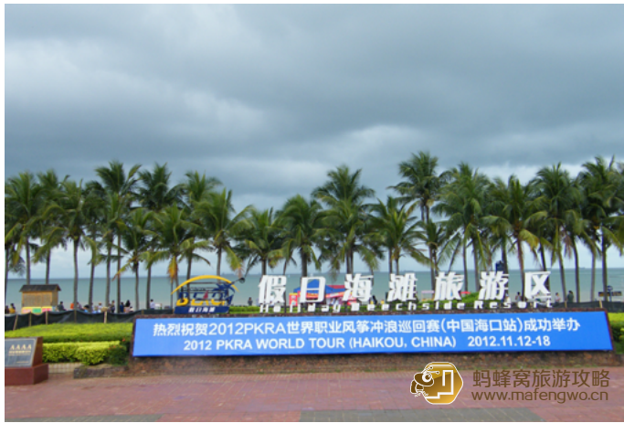
温塘飘飞 假日海滩

绵长的海滩边是一望无际的琼州海峡，常有帆船出没。规模庞大的露天海鲜烧烤广场晚间热闹非凡。附近有贵族游艇会及多家豪华酒店。沿着假日海滩，有宽广干净的滨海大道，在这里散步吹风很是舒服。此外，晚上可以在海滩东边的剧场看《印象·海南岛》的实景演出。