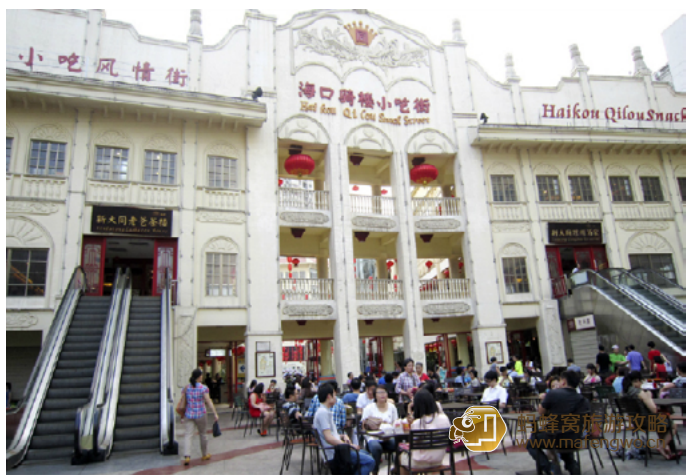
Ashes Kay 骑楼小吃街

小吃街将海南骑楼、琼剧、黎锦、黄花梨、海捞瓷、小吃等六大海南文化元素融为一体，以其独特的装饰风格和传统的风味小吃得到了游客赞赏，闻名海内外的文昌鸡、加积鸭、东山羊、和乐蟹，还有海南粉、抱罗粉、陵水酸粉、琼海粗粮、定安肉粽灯光小吃都能在这里吃到。