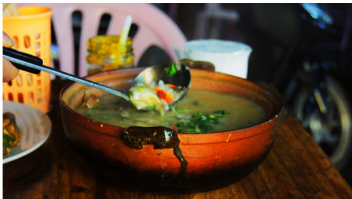
Mr Orange 海南名菜—蟹粥