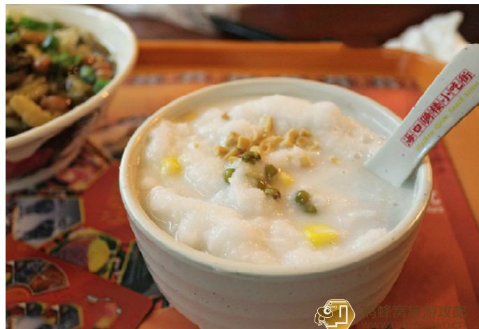
老虎的师傅 闻名遐迩的清凉补

海南的清补凉原料少则十几种，多则二十几种，常见的就有花生、红豆、绿豆、通心粉、新鲜椰肉、红枣、西瓜粒、菠萝粒、鹌鹑蛋、葡萄干、凉粉块、珍珠、薏米、芋头等，甜的、酸的、南方的、北方的、甚至国外的，有如魔术般完美组合。