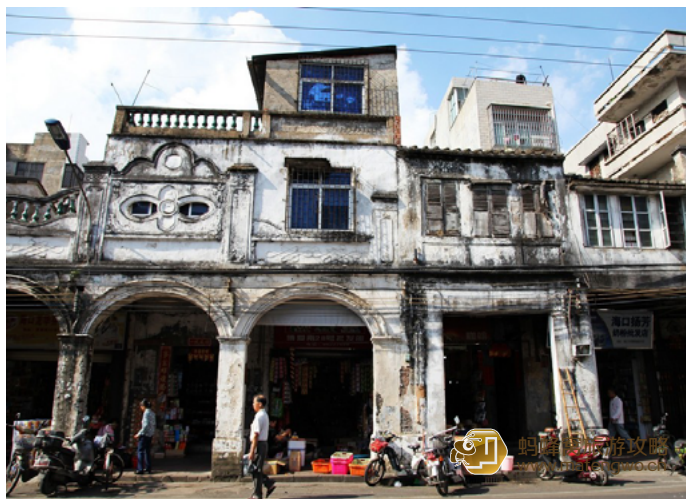
稻草人 外观斑驳的骑楼老街

这是海口最具特色的街道景观，其中最古老的建筑四牌楼建于南宋。老街主要分布在市区得胜沙路、新华南路、中山路、博爱路及解放路一带，街道两旁是近百年历史的充满南洋建筑风情的骑楼。尽管已过去了百余年，走在海口的骑楼老街上，仍能欣赏到街边建筑的美。