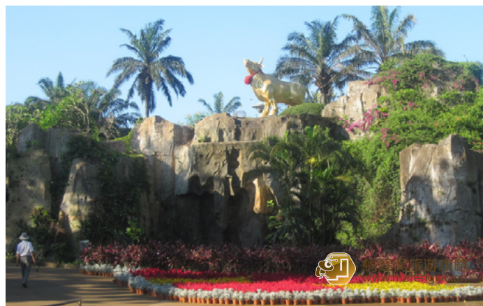
单车上的风景 金牛岭公园

园内一年四季树木苍翠、景色秀丽而独竺，享誉“海口名胜”。“金牛瀑布”是金牛岭公园的象征物。从入口进去，抬头仰望可见一头浑身金光闪耀的巨大金牛，四蹄踏踏实实稳稳地踏在石头顶上。东面清澈的水流漫过石山直泻下来，形成“金牛瀑布”。