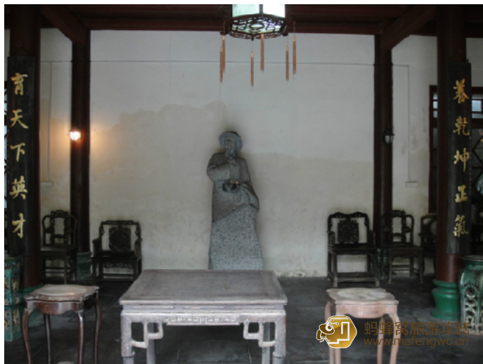
探海石 琼台书院内饰

琼台书院是典型的岭南建筑布局。主楼“魁星楼”，是一座绿瓦红廊的砖木结构建筑，保存完好。琼剧传统剧目《搜书院》中的故事就发生在这里，琼台书院也随着这出戏而蜚声海内外。