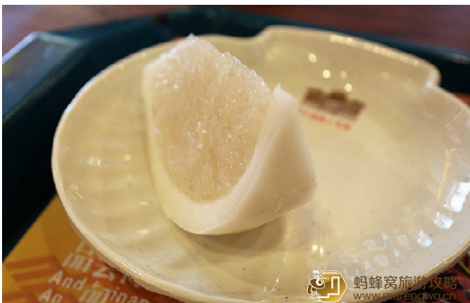
老虎的师傅 海南椰子饭

在海南的民间食品中，椰子饭是一种极为独特的食品，是由海南优质糯米、天然椰肉和椰汁一同蒸熟而成，是海南传统农家小吃。