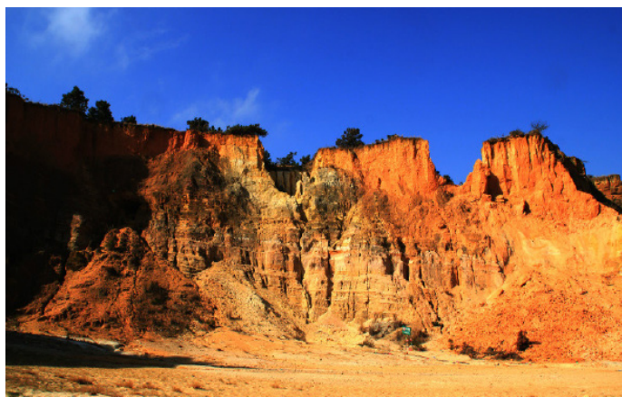
濠阳河畔 彩色沙林

陆良彩色沙林是一个以天然形成的沙柱、沙峰为特征的景区，整个沙林呈“Y”字形，以黄、白、红、灰为主色调。在沙林，除了可以游览世界少有的彩色沙林风光，还可以参观表现古代爨文化的浮雕，玩沙雕，欣赏当地的民俗风情表演。此地还被多家影视摄影单位选为外景拍摄地，曾拍摄过《三国演义》、《炎黄始祖》等多部影视作品。