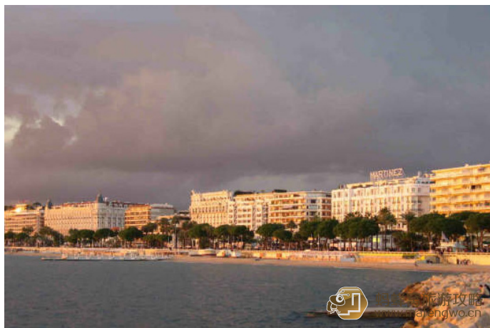
猫猫 戛纳恰似电影的颜色

对浪漫成瘾的法国人来说，戛纳既是过冬的胜地，也是避暑的天堂，这里冬天有和煦的阳光，夏天有凉爽的海风，风景优美的长沙滩。戛纳最引人入胜的是美丽的海滨大道 (Boulevard de la Croisette)，宽阔整洁，一边是沙滩海湾，一边是雅致的酒店，酒店的建筑有上世纪的古建筑群，也有非常现代化的楼宇。在街道中间的绿化带，全年皆有繁花盛开，阳光下生机勃勃的棕榈树，给小城更增添了魅惑的元素。