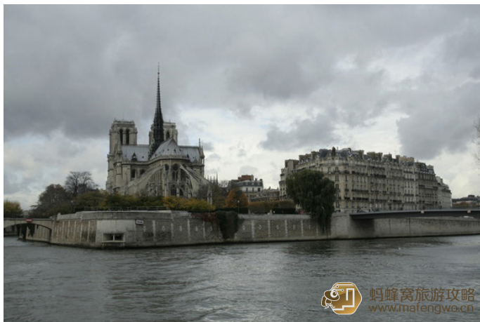
00 另一个角度看巴黎圣母院

很多博物馆内不允许带水和食物，里面也没有卖，比如卢浮宫，所以请提前做好准备，还有别想蒙混过关，进卢浮宫有安检，和上飞机安检差不多。