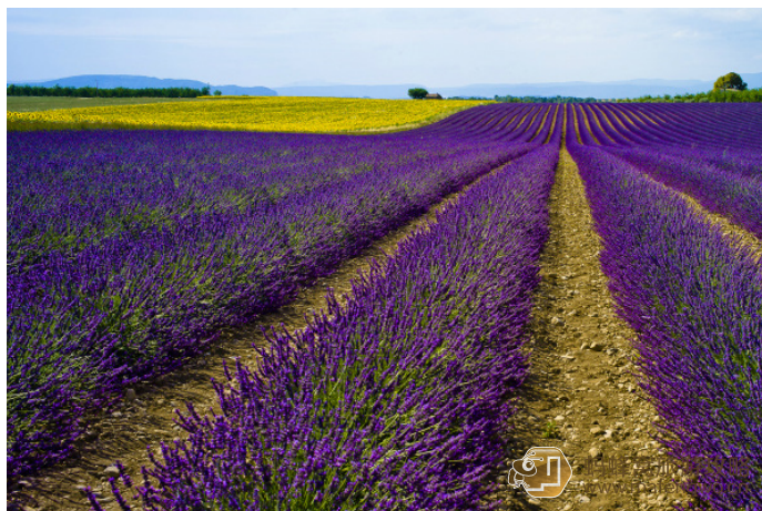
无忌 -Sajia 普罗旺斯的薰衣草田

或许真的是艺术家有了太多的幻想，又或许是在他们心中的普罗旺斯，薰衣草和葡萄都是不可缺少的。普罗旺斯最美丽最著名的葡萄酒之乡，幻想在紫色的薰衣草的摇曳中，留下甜滋滋的回音。