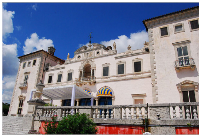
月满西楼 维兹卡亚花园博物馆

月满西楼 安逸寂静的园林,实在适合坐下来喝杯咖啡慢慢欣赏;虽然只是蜻蜓点水的掠过花园,也为这100年前的园艺感动和震撼。可能有的人会感觉,再豪华,毕竟也是欧洲的舶来品,仿制的意大利复兴时期的建筑,不能同真正意义的欧洲建筑相媲美。但是如果能思考一下,与美国短暂的历史相比,值得可数的人文景观的确不多,参观这里的同时,体会当时主人的良久用心,体味当年的人文文化,还是很有启发的。