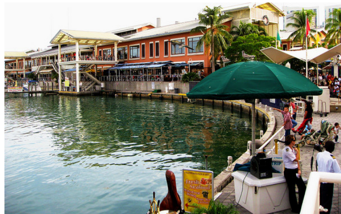
UFO 海湾市场 Bayside Market

Sabrina 傍晚的时候去最佳，在跨海大桥上行驶的时候，可以欣赏日落，港湾旁边有无数的游艇和三五艘巨型油轮停靠的港岸。这个 Bayside Market，重点可以不在 shopping，而在于体验式的购物环境，西班牙艺人在小广场表演，停靠的渔船背景餐厅。