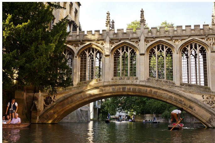
慧眼看世界 著名的叹息桥了是圣约翰学院的一部分

不仅因为它的典故，叹息桥本身也很精美，连维多利亚女王参观这座桥时，也赞叹不已：“这么秀丽！这么别致！”