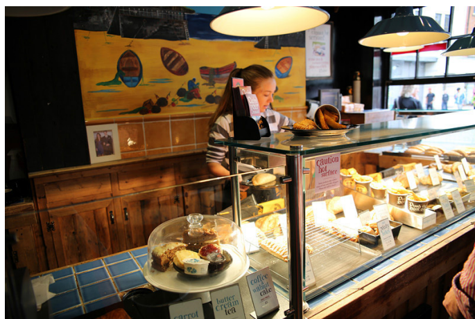
dina 大小姐 在英国的快餐包子店

英式下午茶, 绝对是高贵和轻松自在的代名词。曼妙的红茶配上美味的甜点, 下午茶文化从维多利亚时期一直延续至今。在剑桥的小巷中也有不少喝下午茶的小店, 让你享受一下高雅和精致的慢生活。