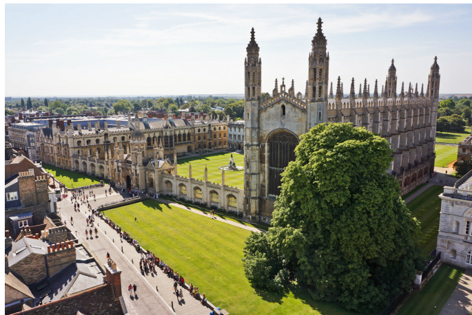
慧眼看世界 国王学院

经历了一个世纪才正式完工。礼拜堂是哥特式建筑的杰出代表，拥有着世界上最大的扇形拱顶和最出色的中世纪彩色玻璃，异常华丽。