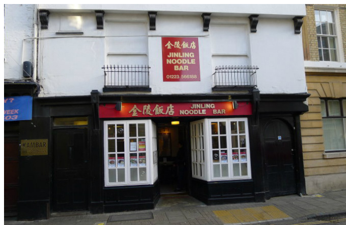
山水子游 剑桥的一家中餐馆, 味道还行

餐厅主人是一位有几十年厨龄的厨师, 厨艺精湛。餐厅用最新鲜的原材料, 为你烹调中国菜肴, 特色菜有椒盐鲜鱿、脆皮豆腐。也可以点上一碗牛腩饭或金陵招牌汤面, 都能让人吃得满足。