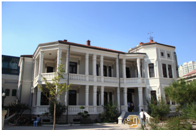
龙城弟弟 梁启超故居

夏芷 梁启超故居是一个很大的一个院落，门前有售票处，正中有梁启超先生的个人雕像，建筑风格是仿照欧式建筑风格，参观的人不多。作为历史古迹保存起来了，很有教育意义。