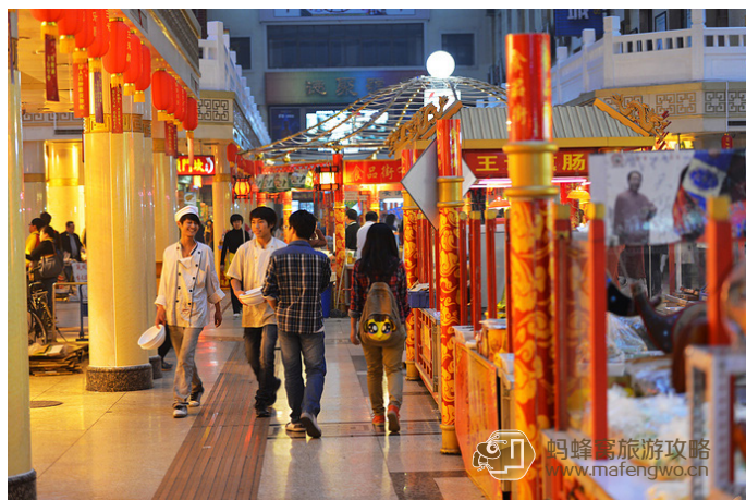
没着落 南市食品街，可品尝小吃