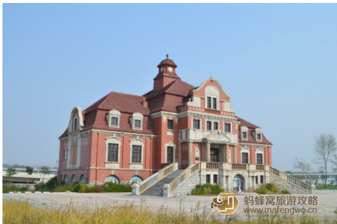
实力馅饼 古老的天津西站