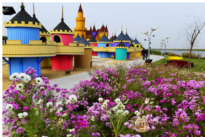
没着落 七里海国家湿地公园

此外，这里还有热气球、亲水观景走廊、儿童乐园、童话城堡、骑脚踏车，适合孩子游玩。也有特色餐饮小木屋、中央喷水舞台、玫瑰庄园浪漫花海组成的美景，不少新人也选择来此拍照。附近为著名小说《红旗谱》改编的连续剧拍摄场地。