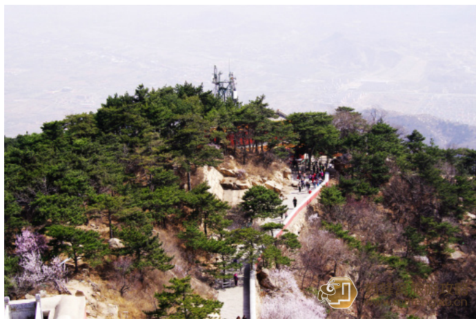
梦总被尿憋醒 盘山山顶秀色宜人

十三疯 沿着小路过了万松寺，就到了一座山的山顶，但不是最高峰，再翻个小山就是挂月峰了，也就是从这里开始，我觉得才是盘山的精华。基本上就是在山脊上行走，没有了烦人的台阶，都是土路、小路，感觉相当到位！