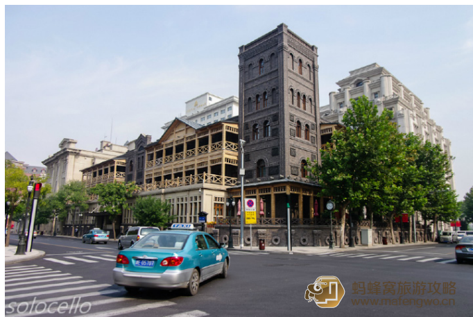
solocello 利顺德大酒店尽显中西合璧风格

Leavegoway 饭店经历了136年的风雨历程，仍保留着英国古典建筑的风格和欧洲中世纪的田园乡间建筑的特点，是天津市租界风貌独具特色的代表建筑。