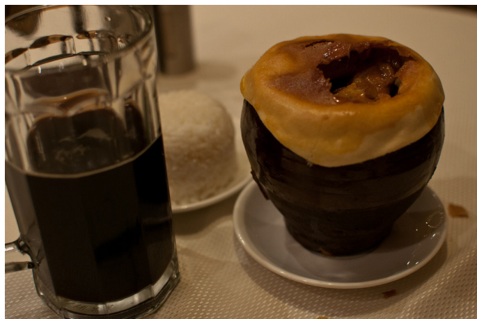
Scoby 起士林的黑啤和罐焖牛肉