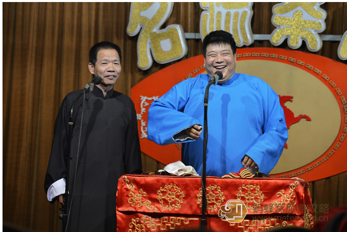
没着落 名流茶馆听相声，马三立先生题写的匾额

猎户星座 名流在天津有好几处场地，我看的是古文化街，50元坐在左边一个角上，单人座，视野也很好，值。名流的相声段子总体是最干净的，但仍然很搞笑，所以难能可贵。演员的水准也很整齐，老中青都很有功力，中青年梯队比别的团队要强很多。我现在能清楚记得人脸并且明确知道是哪个茶馆哪个团的，属名流最多。开场的快板往往是老人，名流这一场是毛躁媳妇的御板书，老段子仍然很有趣，说书的先生很有股正气和仙气。还有一胖一瘦的年轻搭档，胖的固然沉稳有方，瘦的也天生一股讨喜之风。还有个谢洪利（音），咬音很特别，有点听不清，但是神态很有意思。