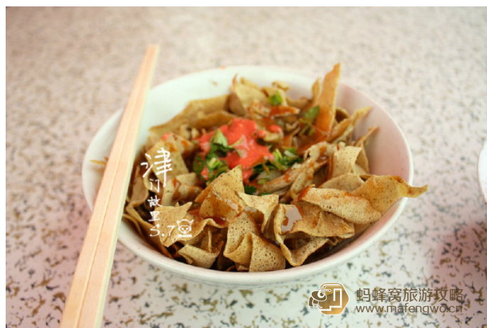
太飛 Se7eN 锅巴菜

蝠翼清流 天津人吃早点讲究搭配。锅巴菜配死面窝头、老豆腐配发面饽饽、大饼夹果子果蔑儿再来碗豆浆、烧饼配羊汤、高汤馄饨爱配嘛配嘛、包子配稀饭，煎饼果子，还有老面茶……相当反感那些烧饼里脊、灌饼之类的外来品种，那不是天津人的早点！