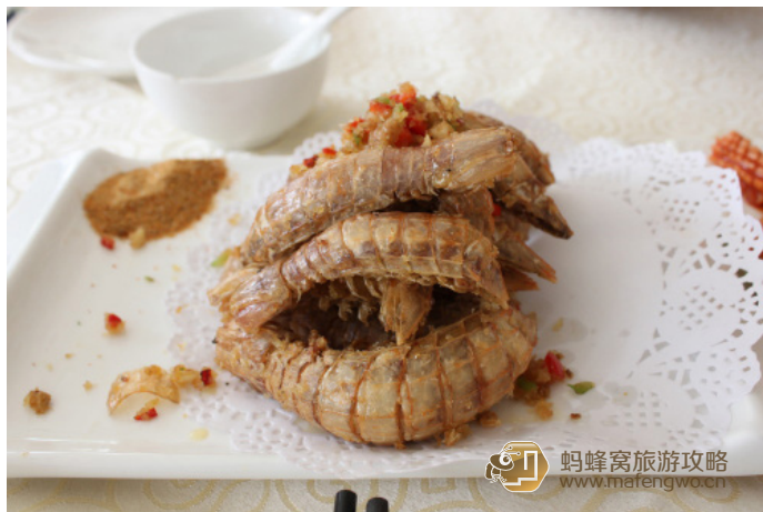
大宝 北塘海鲜城的皮皮虾

此外，天津的海鲜也是不可不尝的，多集中在塘沽。在北塘也有许多渔家餐厅，价格都不高。但在旅游黄金季节里同样也存在坑人的现象。随着每年北京、唐山等地的游客增多，海鲜的制作口味、工艺大幅提高。天津北塘海鲜风味系列虾酱、虾油是很多人所钟爱的，几乎每家店铺都有，一定要找懂行的看看质量如何（拆后重建的海鲜餐厅味道大不如前，请谨慎选择）。