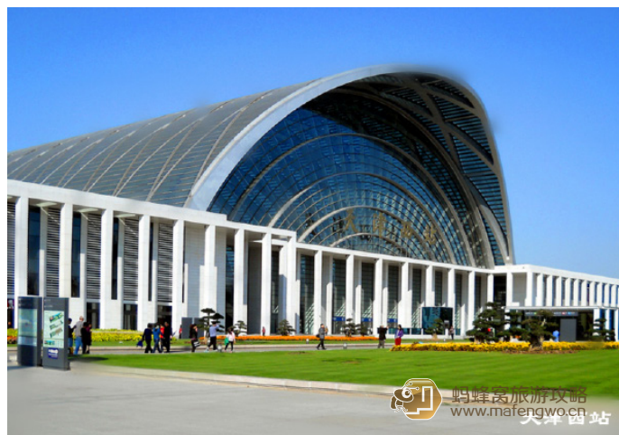
小波 23 天津西站（高铁站）

小波 23 2011年夏天新建成的高铁站，现在普车也停靠。出站后你所在的是地下一层，可以直接沿着路标指引去地铁1号线，乘坐地铁去往目的地。如果是乘坐公交，同样在地下一层顺着指示标，去往南广场的公交站，有3个站台，每个站台都会有详细的公交线路。