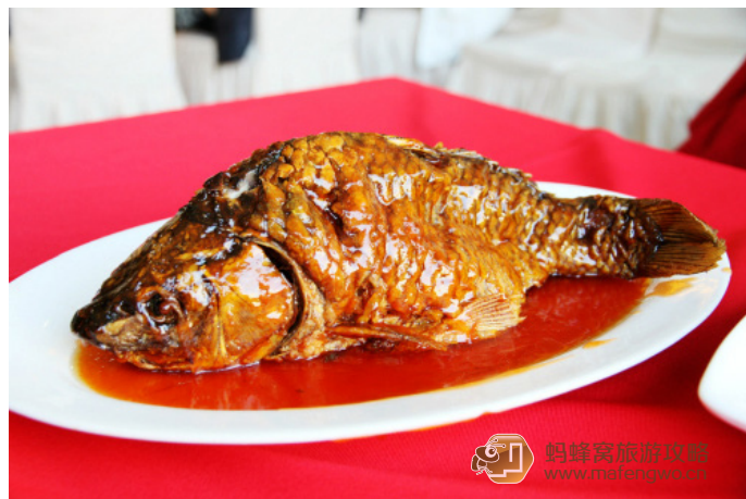
ez2001 晋蹦鲤鱼（60 元，不说了，相当好）

zilan 小时候家里经常在这里吃饭，现在仍旧保持着不错的风味，菜量也很实惠，味道很正宗！服务员依旧是国企范儿！