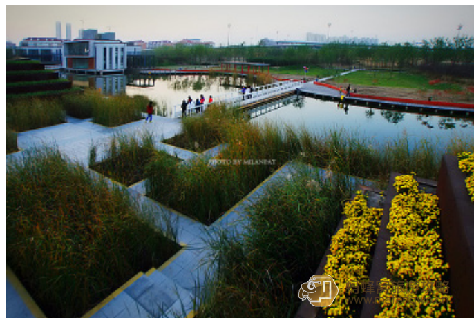
蝠翼清流 天津市最大的人造生态湿地公园——桥园

蝠翼清流 桥园在快速路卫昆桥附近，是天津市区内唯一一个湿地公园。它像城市里的一片绿洲，令人豁然开朗。花木扶疏、跨水架桥、湿地水泡交织融合，确实别具特色。