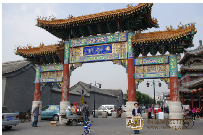
橙汁 杨柳青最有名的御河古街门前的牌坊

到达交通：自驾车可通过京津高速转荣乌高速到达，或在天津站乘 824 路、便民 9 路，也可在市内其他地方乘坐 175、津西 1 路、津西 2 路到达 用时参考：半天或 1 天