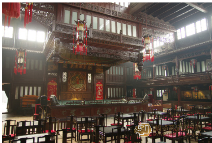
冷香 戏楼是广东会馆的主要建筑

地址：天津市南开区南门里大街 31 号 费用：门票 10 元 / 人（学生半价） 联系方式：022-27273443 开放时间：9:00-11:30，14:00-16:30 到达交通：乘 15、161、168、611 快车、635、657、693、840、855、863、865、便民 61 路等公交车在鼓楼站下车即到 用时参考：1-2 小时