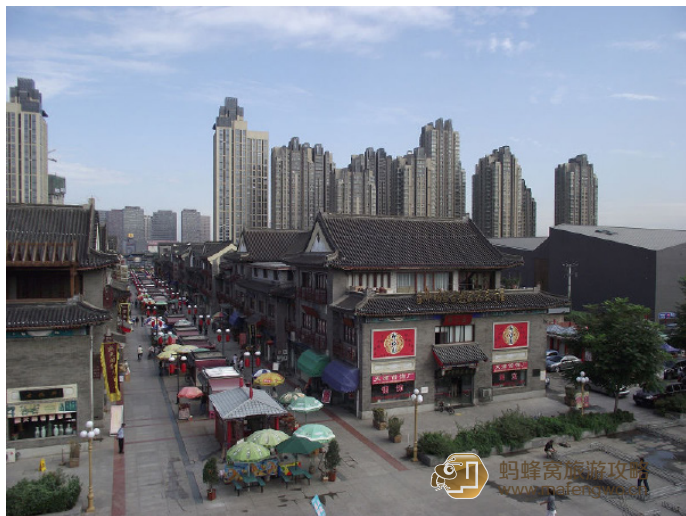
沙娱 2013 鼓楼街

新安购物广场、古文化街、文庙、南市食品街、旅馆街、西南角商业区、大胡同小商品批发市场等旅游商贸区环布四周。