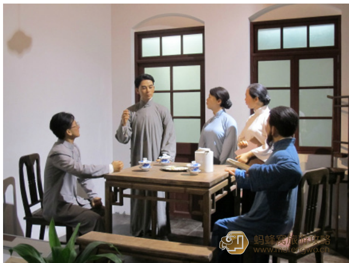
青松 周邓纪念馆内的陈设

青松 专机厅在周恩来邓颖超纪念馆主体建筑东侧，绿茵丛中陈放着一架伊尔 14 型 678 号飞机。周恩来总理专机陈列厅为钢球网架结构，两道弧型球网架梁交叉支撑，四周为敞开式弧状，顶部由蓝色半透明耐力板装饰，远远望去，仿佛是一只雄鹰在蔚蓝色的天空中翱翔，向人们展示周恩来青年时代的理想——“愿相会于中华腾飞世界时”。