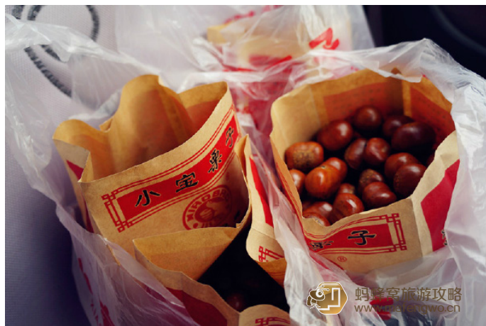
anan 小宝栗子也是当地人经常吃的，栗子很香，但不会甜得发腻