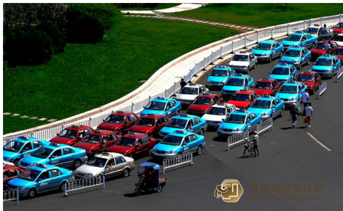
沙娱 2013 天津的出租车

重在机场、火车站、各宾馆、饭店和旅游点都有出租汽车昼夜服务。根据车型的不同,主要是丰田威驰和花冠,每公里1-2元不等,起步费8元,另加燃油附加费1元。