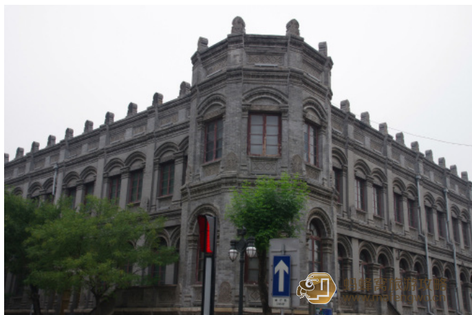
冷香 原大清邮政津局