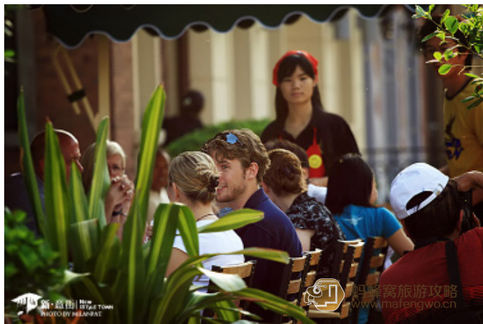
蝠翼清流 意式街附近的餐饮以西餐为主，酒吧也不少

到达交通：乘地铁 1 号线在小白楼站下车，或乘 9、9 区间、9 杨楼区间、831、845、902、951、观光 2 路空调等公交车在桂林路站下车，步行约 130 米即到