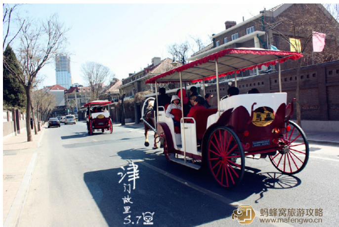
大飛 Se7eN 在五大道上乘坐马车

箩箩 如果想要更了解每栋建筑的历史，建议选择马车，会有专业讲解员陪同，大马车 50 元一人，还有 360 包车一圈的（上图左下）和 800 元包一圈的。当然了，坐上宫廷式的马车，“哒哒哒”地跑在五大道上，确实别有一番风情。