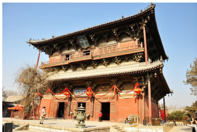
暮云斋 观音阁上的“观音之阁”是李白的，而观音阁上的另一块“具足圆成”则是咸丰御笔

独乐寺是现存三座辽代寺庙之一，由山门、观音阁和东西配殿组成。因有着我国现存最早最尊贵的庀殿顶山门，及现存最高的元代泥塑观音而出名。细看你会发现观音头上还有多个人脸，十分特别。此外，“观音阁”牌匾据说出自李白之手，寺门“独乐寺”是严嵩题的，而“具足圆成”是咸丰手书的；侧面皇帝行宫内的乾隆手书石碑也值得品味。趁着每年正月传统庙会或二月十九（观音诞辰日）、四月初八（佛祖诞辰日）等法会纪念日来，更加盛大热闹。