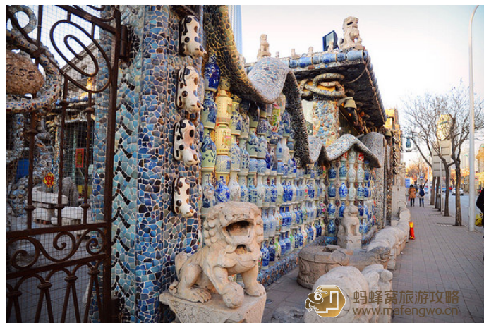
鲁晓琪 瓷房子外围的“瓶”安墙，用的是大小不一的 635 个古瓷瓶堆砌而成

傻子：大痔若鱼 瓷房子很震撼，它那房顶给人很纠结的感觉，不过整体很大气。整个房子外表因为用特殊材料——瓷器镶嵌而成，透着一种别样的美，可以说是用艺术品造就的艺术精品。