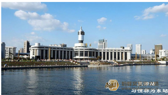
小波 23 天津站出站之后是南广场，会有指示牌指引你去往公交站台，有5个公交站台，每个站台上都有详细的线路图

这是天津最大的火车站，这里是京山线与津浦线、津蓟线交汇处，通达北京、山海关、济南、蓟县、霸州等五个方向，从天津有开往北京、石家庄、广州、西安、上海、南京、杭州、哈尔滨、满州里、香港九龙等40余座城市的列车。