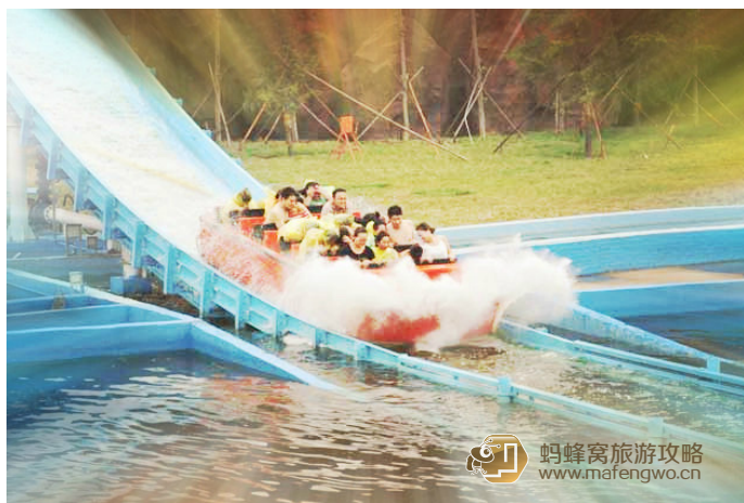
小巴布 大家钟爱的激流勇进也在“穿越无限”区，不准备齐全绝对让你体验透心凉

带适量饮食，能简单充饥即可，园区内有但价格不菲；务必带上防晒品及雨具，激流勇进下来溅起的水花可不是一般的爽，不穿雨衣就能把全身湿透，园内也有卖一次性雨衣的，但价格很坑爹。