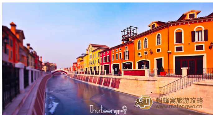
十三疯 天津武清佛罗伦萨小镇，其实就是个卖名品折扣的地方，依照意大利佛罗伦萨风格建造

紫璇 这座小镇的设计充满经典意大利建筑风格，贡多拉小舟沿着清澈的小河在 16 世纪意式古典建筑和拱桥中流连，优雅的庭园、浪漫的广场、美丽的喷泉和精致的廊柱点缀其间。其设计为 16 世纪意大利式开放式小镇的建筑，重现 16 世纪意大利小镇的生活场景，不管是建筑的外观工艺还是石板小径，甚至廊柱和门廊的每一处装修细节都独具匠心，别有洞天。丰富的奢华及时尚精品，Prada 和 Fendi 首次登陆中国奥特莱斯，Giorgio Armani、Salvatore Ferragamo、Bulgari、Tods、Versace、Burberry、Celine、Zegna、Moncler、Missoni 以及 Lancel 等世界级名牌；还包括 Diesel、Coach、Guess、CK Jeans、Follie Samsonite 和 BMW Lifestyle 等，这些可以掏空女人钱包的东西，在佛罗伦萨小镇都可以找到。