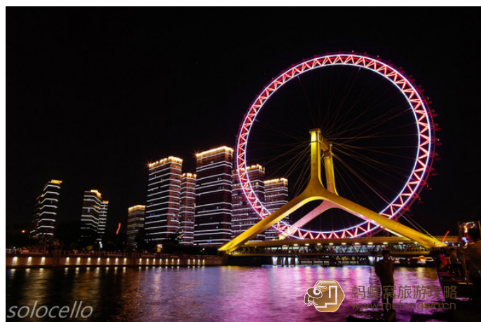
Solocello 天津之眼，金黄的座架，藕荷色的光环，在静静的海河上异常醒目

这是世界上唯一建在桥上的摩天轮，极具巧夺天工和奇思妙想。其高 120 米，轮外装挂 48 个透明座舱，每舱可乘 8 人，工作人员也会很贴心地将认识的人安排在同一舱内。摩天轮转动速度缓慢，并不刺激。你可眼见车辆从两边疾驰而过，别有妙趣；随着升高，脚下温柔的海河如平镜般让人安心，当到达最高点时，距离地面的高度可达 120 米左右，相当于 35 层楼的高度，能看到方圆 40 公里以内的景致，是名副其实的“天津之眼”。传说摩天轮上的每个盒子里都装满了幸福。与爱人相偎相依，叫人如何不想把握住此刻的幸福与浪漫。