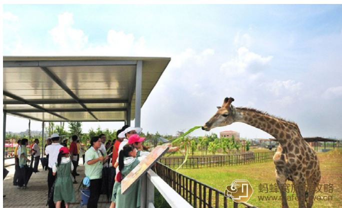
chiwah 超可爱的小动物，儿子看着都不想离开了

寮步镇的香市动物园可谓动物园的 web2.0 升级版，澳洲的袋鼠，非洲的长颈鹿、河马，美洲的羊驼、松鼠猴，联合国动物欢聚一堂。园内提供了多处与动物亲密接触的场合，憨态可掬的黑熊为求得蜂蜜而手舞足蹈；乖巧可爱的环尾狐猴瞪着好奇的大眼睛，围着人们团团转；颇具绅士风度的长颈鹿伸出长长的舌头要品味青草的芳香——奇妙的交流，回归自然的感受