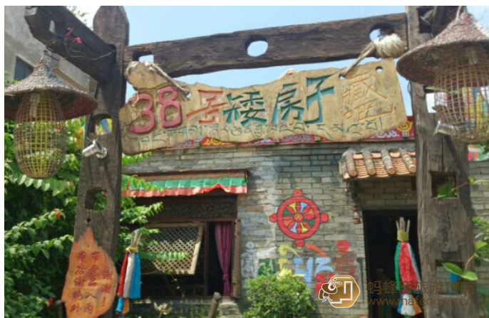
Owl 38 号矮房子藏吧

痒痒 纯正的藏式风格，浓情的色彩，原木的凳子上随意摆放着柔软的尼泊尔靠垫、羊毛纸质的灯罩中散发出幽幽的光、绘在房梁上藏式和尼泊尔式的佛眼、神秘悠扬的藏传佛教音乐沁入心扉……神秘的异域气氛弥漫在这小屋。