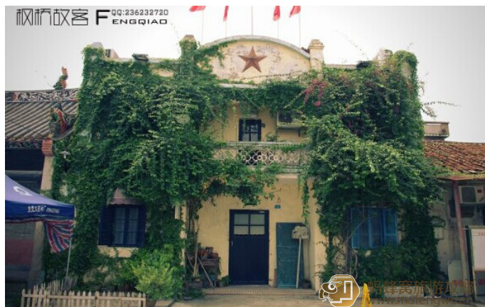
蔷薇之光

大部队的旧楼，幽静的小园，上世纪的老家具。这里除了是一间独立品牌设计室，还有一间咖啡厅。来这里随意逛逛，或点一杯饮品，感受一下老味道吧。