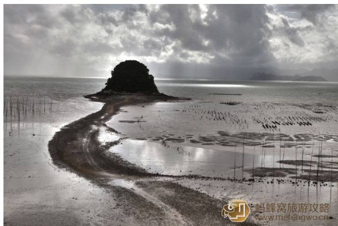
宋大都督 NiCK 围江馒头山

这里在常人眼里几乎没有一点艺术价值可言，可谁又知道她的美竟然深深蕴藏在黎明之前、潮汐间，这里就是令无数摄影爱好者起早摸黑追寻光影艺术的圣地——馒头山。主要可以拍摄海上日出、挂晒晨景、馒头山风光以及渔民晾晒海带等劳作场景。