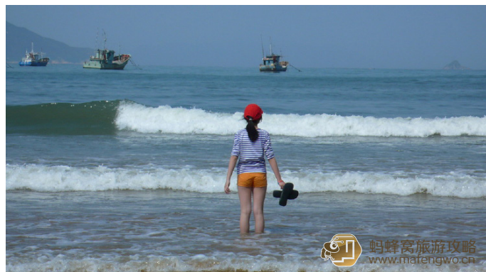
水中漫步 天然海滨浴场

岛屿风光秀丽、美不胜收。游客可享受天然海水浴、日光浴，清晨观看日出，夜晚聆听涛声，白天林中吕茗，也可在沙滩开展排球、足球、放风筝活动；抑或乘快艇在海上飞驰、上岛探险、观礁、垂钓、拾贝，更富情趣和刺激。