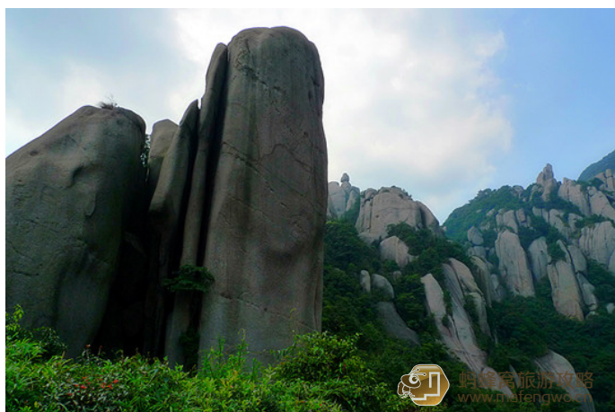
芒果干先生 太姥山

太姥山分为太姥山岳、九鲤溪瀑、晴川海滨、桑园翠湖、福瑶列岛五大景区，还有冷城城堡、瑞云寺两处独立景点。如果想观赏太姥山的红叶最佳时间为 11 月下旬：景区西南侧杨家溪尽头处的渡头，有两片面积为 250 亩的天然枫树林。林边河涌上夹有面积百余亩的荻花滩，每年秋末初冬，枫林红透，而荻花则一片雪白，别有情趣。两片枫林间的古榕树林更是盘龙交错，各显姿态。