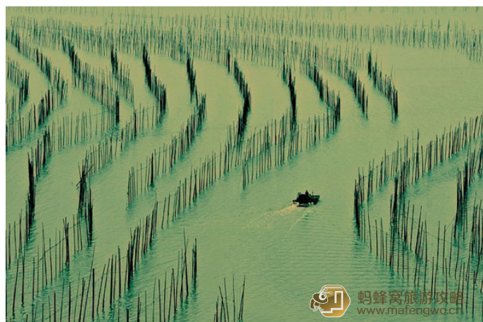
尼洋 沙江水面上的 S 型竹竿美景

沙江的海面上，一根根竹竿排成了一个大大的 S 湾，渔船在这湾道中蜿蜒穿行。众多插在滩涂上的竹杆形成的优美线条错落有致，每当海带收获季节，竹杆上挂满晾晒的海带，渔民驾着小船在 S 形港湾水道穿梭忙碌，此景构成了一幅完美的滩涂风光画。