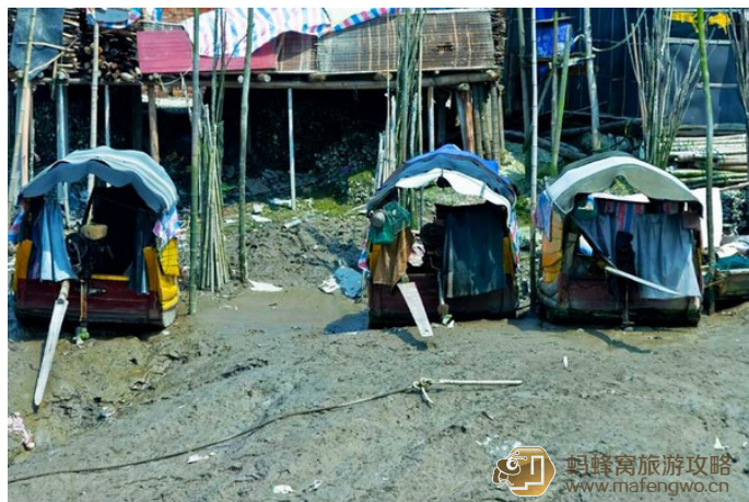
尼洋 海上吉普赛生活

盐田的拍摄重点是富有浓郁人文气息的连家船民生活。连家船民是指几代人靠打渔，拾贝为生，长年居住在简陋的小船内，一条船就承载着一家人全部的财产，过着艰辛的海上漂泊生活，人称“海上吉普赛”。