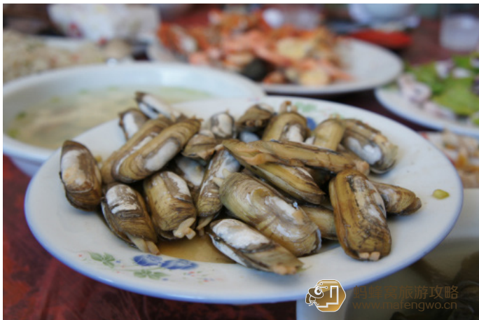
Bao1223 霞浦代表美食—剑蛸

剑蛸： 霞浦的福宁湾是国内唯一能形成剑蛸采捕业的海区，换言之，剑蛸在其他地方是没有的。霞浦剑蛸，壳薄肉脆、鲜美异常，炖炒蒸煮均为佳肴。