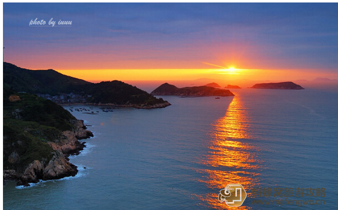
哎哟哟 金色霞浦，闪耀四方

霞浦是摄影爱好者的天堂，最迷人的就是滩涂，潮汐之间，滩涂裸露，每个季节的滩涂都会呈现出不同的风韵和景致。来到霞浦，行摄之旅必不可少，除了炫美灵秀的滩涂风光外，霞浦的惊险漂流也值得花上一整天时间去细细体验。