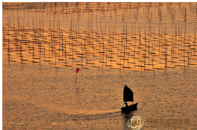
Dan 色彩斑斓的摄影天堂

夏：夏天天气晴好，雷阵雨之后或者台风前后，空气特别通透，云霞变化迅速，天空走云，阳光穿行，地面变换瞬间迥异，这时你要耐心等待，天随人愿，那些“舞台光”“电筒光”准会照临在你拍照的主体对象，你心中的激动真是妙不可言。台风来临前天总是蓝天白云，而海上却大浪滔天，晨昏可拍到数米甚至数十米高的金浪，难得惊涛拍岸壮观。夏天可拍小皓海滩、沙江晾收海带，三沙东壁晚霞、溪南镇围江挂蛎等。