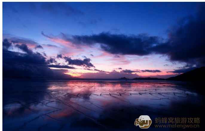
跟我走四方 沙塘里炫美彩霞

沙塘里面向福宁湾，视野开阔。当日出时，满天绚丽的朝霞，反射到“人”字形围网滩涂上，产生五彩斑斓的暖色光纹，所以是不折不扣拍摄日出的最佳景点之一。停泊在海湾滩涂上的数百只小渔船在朝霞的渲染下也十分壮观。