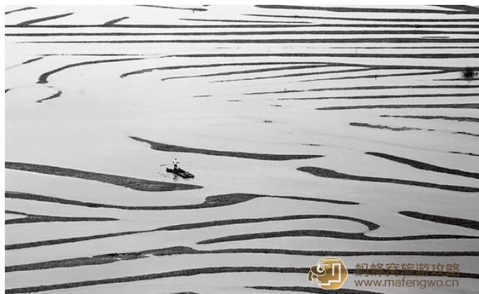
一镜收江南 潮水退去后的七都滩涂

退去才将神奇的七都滩涂展现在每个摄影人的眼前。七都可以拍摄潮涨和潮落，更多的摄影者选择拍摄潮落，所以把握好潮汐的规律是至关重要的，原则是宜早不宜迟。