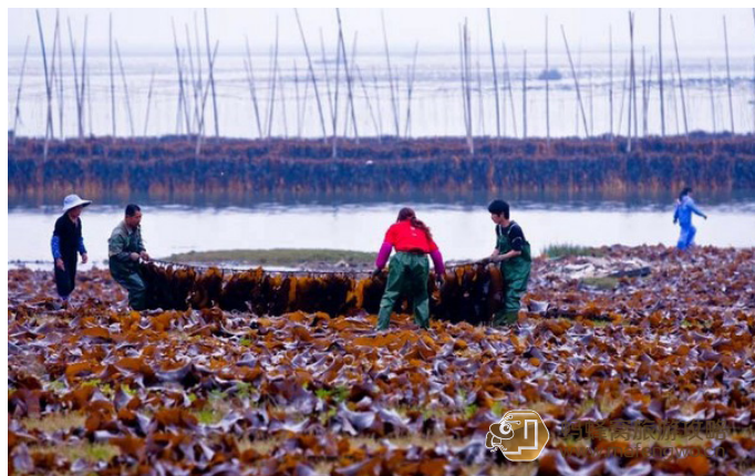
尼洋 中国海带之乡

霞浦地区海水环境较好，是中国著名的海带、紫菜生产地。此外，霞浦因其独特的气候还盛产晚熟荔枝。这些都是从霞浦旅游归来值得一带的伴手礼。