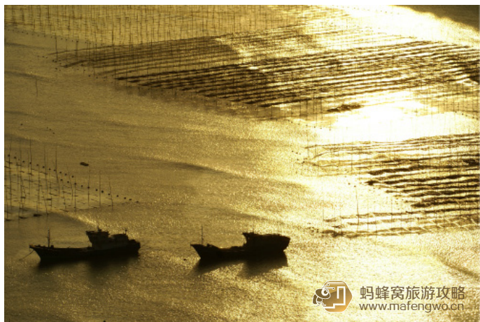
Aly 波光粼粼的小皓海滩

最佳拍摄点： 沿 981 县道穿小皓村而过后的一条路边小道爬上山头，在高高山崖边拍摄壮阔的海景，和脚下的小皓村。