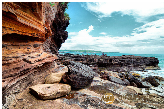
简韵 cherry 涠洲岛上的火山遗迹

线路详情：提前一天坐下午最后一班船上岛，住在五彩滩，5点早起看日出，吃完早餐后，在去鳄鱼山公园的路上，远眺惟妙惟肖的猪仔岭。在鳄鱼山公园的巨大观景台眺望碧海蓝天，在月亮湾影下最美的瞬间，此地需玩半天时间。中午去滴水丹屏或石螺口海滩吃海鲜，休息会儿后，去岛上最大的天主教堂，最后回到码头，坐16:00的船回到北海。