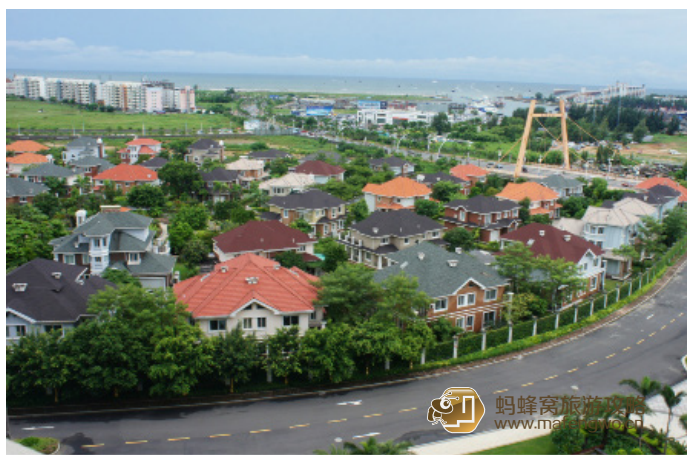
QQ 老熊 银滩别墅区内犹如童话般的房子

未央 从酒店另一面望下去的房子，像不像童话王国里的房子啊？微博里天天说什么北欧童话王国里的房子，在北海我就看到了！