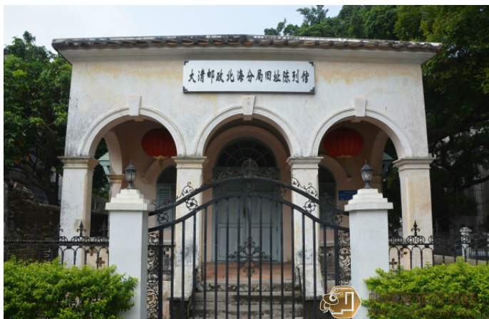
窗前的星星 大清邮局里可盖邮戳

★ 北海大清邮局旧址里，在明信片上盖下“大清邮局旧址”的邮戳，从北海老街为朋友送去一份穿越的思念。