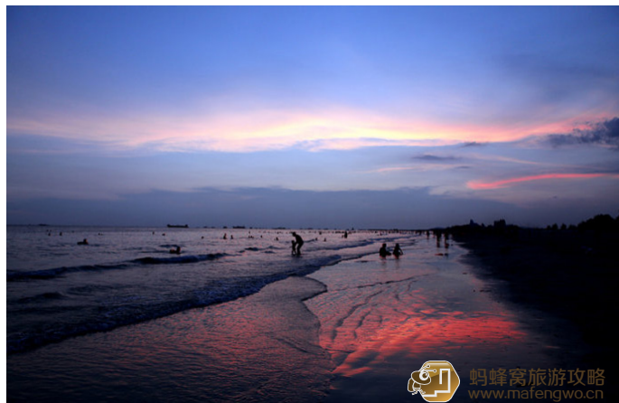
小妖 0725 晚霞将天空染成红色，于是连海水浸过的沙滩也影成了红色。

岛上以海鲜为主，青菜和肉比海鲜贵。建议到码头附近菜市场买爱吃的海鲜，再请大排档的人加工，加工费很便宜。约7:00或16:00渔民卸船时，海鲜最为新鲜，也最便宜。