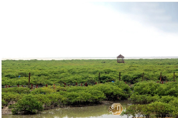
想流浪的大树 茂密的北海红树林

英罗红树林距离市区较远。每逢退潮时，可以看到高达8米的红树林，盘根连冠，蔚为壮观；涨潮时，树冠隐于海水之中，在海上泛舟可过树梢，别有一番情趣。值得一提的是，在红树林内，还可以看到跳鱼上大树、海蛇舞红林等奇观。但从2012年1月1日起，山口英罗红树林暂停对外开放。