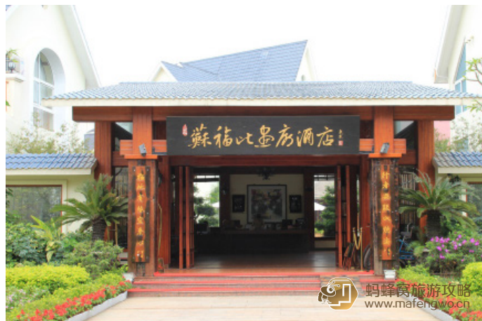
妞妞 很艺术的苏福比画廊酒店

酒店每天上下午固定时间段有专车免费接送客往返银滩酒店。但别墅群内路标指引不明确，自行出入较不便，且特价房的房间不大。需要带阳台的房间在预订时要提及。