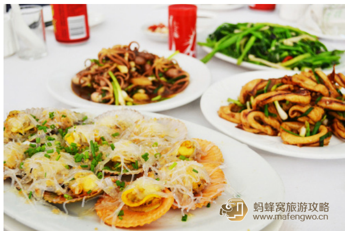
小阔很有爱 半坡肥仔的海鲜

小阔很有爱 我们去了一家叫半坡肥仔的海鲜大排档。下图的是粉丝蒸扇贝，右后方的鱿鱼圈是当地最好吃的菜，是新鲜炸过之后烧制而成的，不太爱吃鱿鱼的我，都觉得味道很是很好呢。