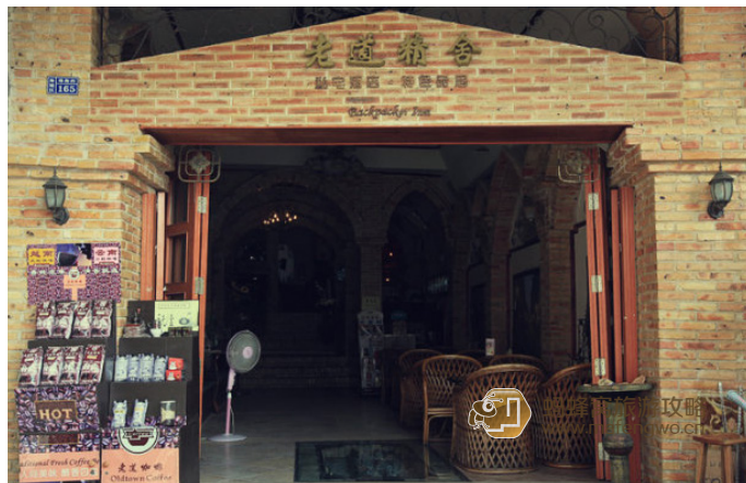
小妖 0725 老街口附近的老道精舍

一家北海老街有名的背包客栈，位于老街入口处，闹中带静。装修风格是低调不失大气的欧美，内有不同房型，房间还免费提供2瓶矿泉水和台式电脑（可免费上网），适合各种消费人群。有6种房型，但总共才13间房间，最好提前预订。