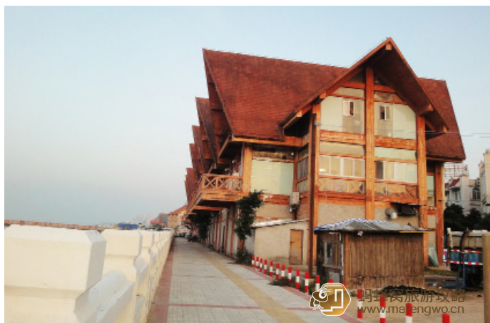
梓辰大侠 外沙岛是吃海鲜的集中地

外沙，是北海市区北端的一个狭长形的小岛，它是由千万年海潮的冲刷形成的一座沙岛。外沙港内渔船密布，樯桅如林，形成了浓郁的海滨渔家风情。外沙海鲜大排档傍海而建，这里共有酒楼、大排档70多家。较讲究档次的游客可以来这，合适商务接待，当然价格也比较高。选择较经济实惠的在外沙岛大门外，过外沙桥左转，栈桥附近一路大排档为外沙渔民所开，味道不错，价格合理，海鲜比较正。