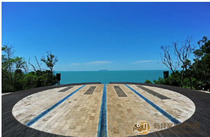
铿锵芋芳 鳄鱼山公园里的月亮湾

★ 涠洲岛上的月亮湾广场是拍婚纱照最美的地方，新娘穿上雪白无暇的婚纱，记录自己最美丽的瞬间。