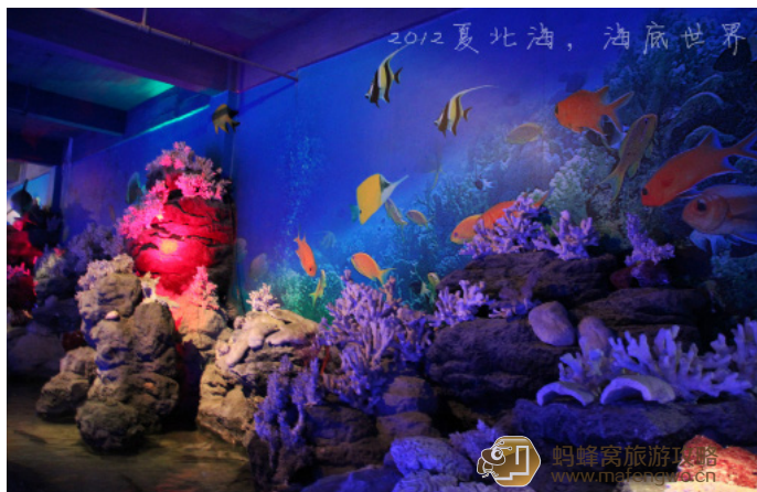
走吧, 为了爱 五彩斑斓的北海海底世界