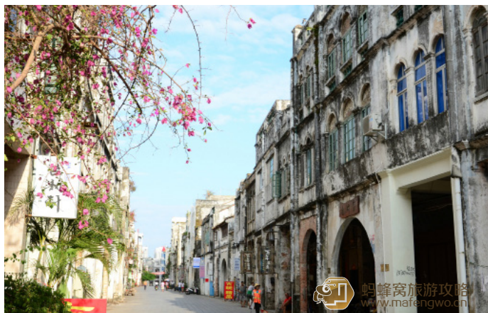
HEQIONG 北海老街与三角梅

附近有个大清邮政北海分局旧址，是目前广西尚存历史最长的邮政局址，陈列了吊灯、马鞍、留声机、钱币、钱罐等珍贵物件，可免费参观。