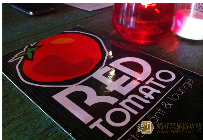
兰卡威的 Harry 红番茄餐厅

NO 5, Casafina Avenue, (Opposite Underwater World), Pantai Cenang, Langkawi.