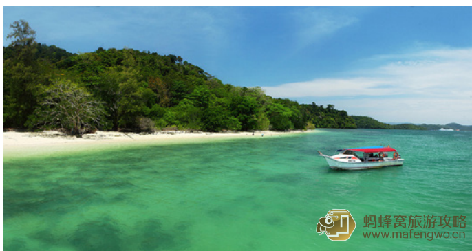
风灵捕手 海上活动

兰卡威的芭雅岛海洋公园是与大海亲密接触的好地方，它距离兰卡威19海里，它包含了芭雅岛、兰布岛、赛干丹岛及卡加岛。芭雅岛海滩周围被珊瑚礁所环绕。在这个海洋公园里充满各式各样迷人的海洋生物及植物，许多濒临绝种的鱼类及海洋生物得以生存于这个避难所，故这里的海水是最适合浮潜、深潜及游泳等活动的。在众多迷人的潜水地点中，“珊瑚花园”是一个由众多色彩明亮缤纷的柔软珊瑚所覆盖而成的地方，鱼群众多，五彩斑斓的热带鱼在身边游过，伸手可及；海底是更加丰富多彩的珊瑚、海草，看得人眼花缭乱。如果你运气好的话还可以与小鲨鱼一同在水中嬉戏。芭雅岛被茂密清翠的树林覆盖，而洁白幼滑的沙滩、碧绿海洋、蓝天白云，更为芭雅岛增添了如画的风光，使她成为马国最令人心旷神怡的美丽海岛之一。如果你还觉得不过瘾，也可前往兰卡威最大离岛“孕妇岛”上的淡水湖游泳，或三五好友结伴搭乘香蕉船，享受急弯翻船的乐趣！