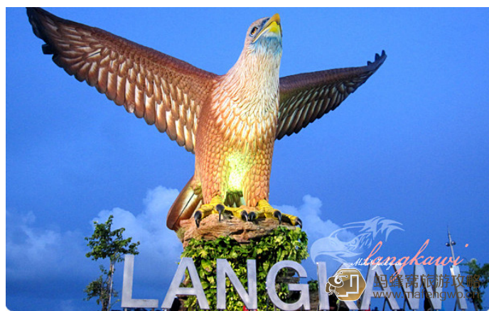
小米的私人角落 巨鹰广场

广场上还有景色优美的湖泊、喷泉、小桥、回廊等，规划完善，是个欣赏夜景、享受海风吹拂的好去处。