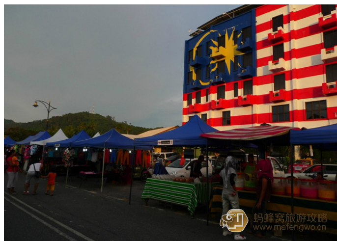
兰卡威的 Harry 夜市

这是个当地人聚集在一起买日常用品和马来食品的地方，有时候还卖些新鲜水果和蔬菜。夜市是流动性质的，每天的地点都不同。一般从17:00-21:00营业。