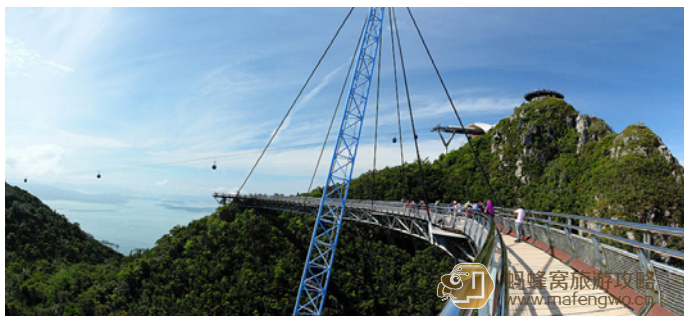
风灵捕手 天空之桥

天空之桥距离兰卡威另外两个著名景点，七仙井和东方村不远，可以将它们规划为一个行程。