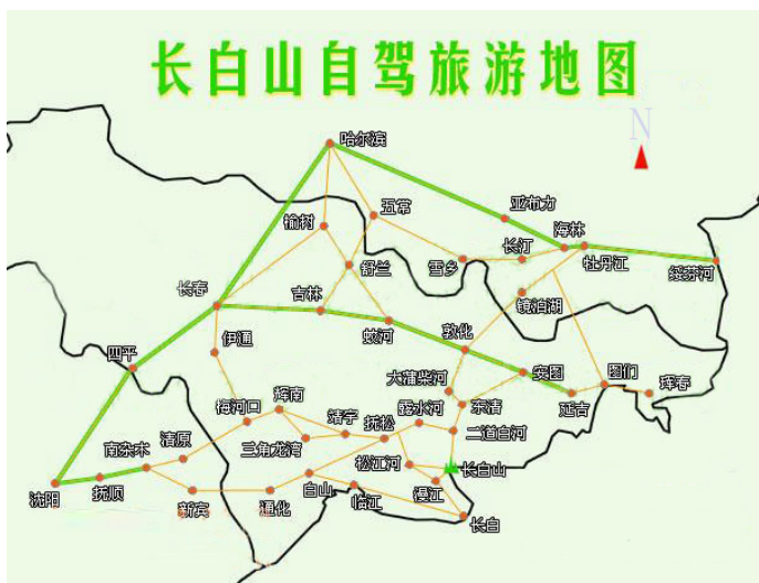
长白山自驾线路图

joe3007 对于外地人，建议包车，这里有很多山路，很多地方限速 40，只有当地人才知道，外地人自驾超速的罚款都够包几辆车了。