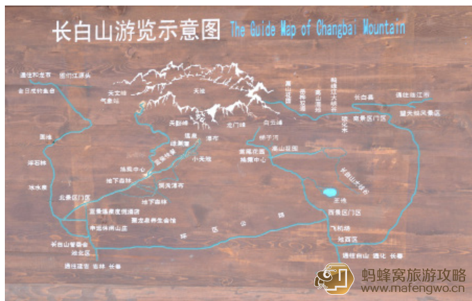
刚子 长白山导游图