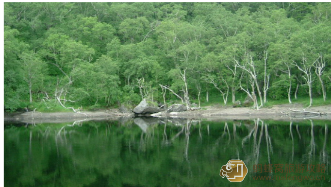
梧桐雨 小天池，在一片密林中