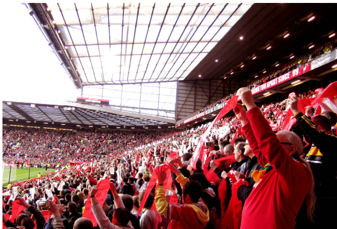
东奔西跑 围上围巾，瞬间融入气氛当中，变成超级曼联粉儿

对很多人来说，去曼城的唯一理由就是看一场曼联的球赛，红魔魅力势不可挡，现场感受一定更让人兴奋不已。