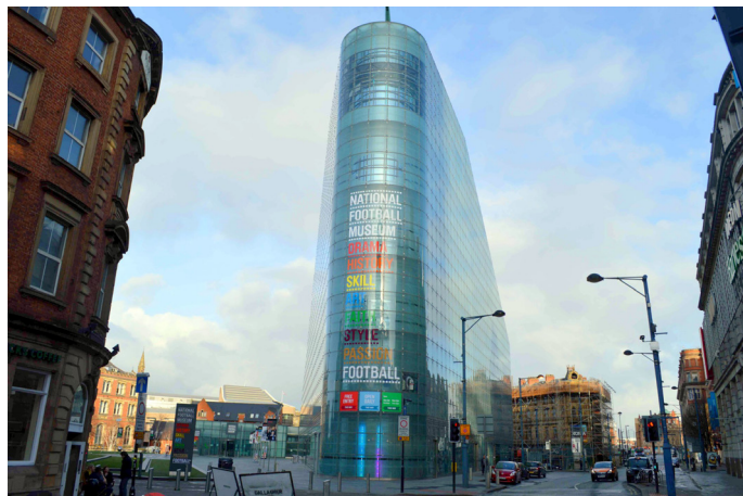
东奔西跑 这是广大球迷的朝圣之地