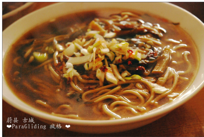
蔚县 古城 ♥ParaGliding 疯格 ♥

就可以捞出食用了，搭配上事先用豆腐或者肉、红白萝卜等做好的“臊子”，真是让人口水直流的北方佳肴。