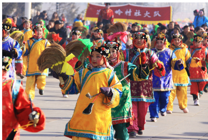
无悔追踪 社火表演