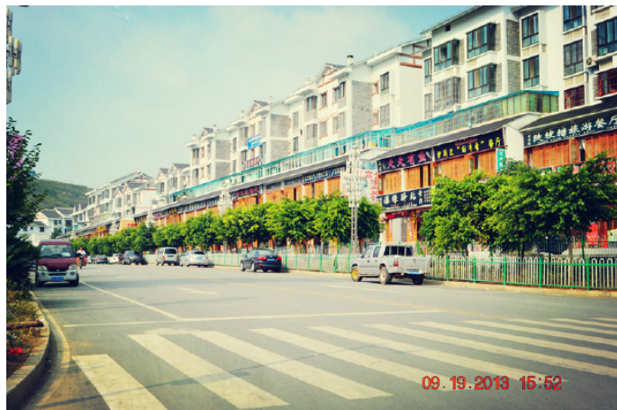
风雨兼程 票务中心对面的一排楼房，吃住都可以搞定

地址：黄果树风景区售票大厅对面，黄果树风景区迎宾大道 联系方式：0853-3773300 参考价格：128-198 元