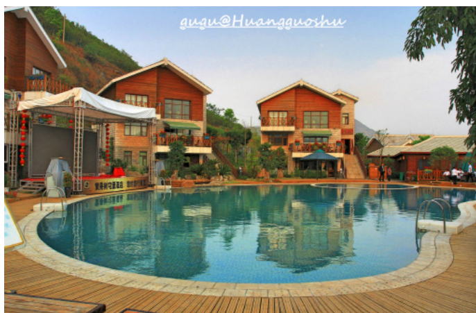
鼓鼓 晚上游泳池边的舞台会 K 歌，露天酒吧会有很多人喝白酒

注水知音 这家酒店是独栋别墅类型的，一栋楼里面有好几个房间，挺适合一大家子或者一大帮朋友一起住一栋的，大家一起在客厅开个 PARTY 啥的感觉挺好。当然了，酒店里面也有酒吧游泳池什么的，挺适合在这里好好度假休个闲的。