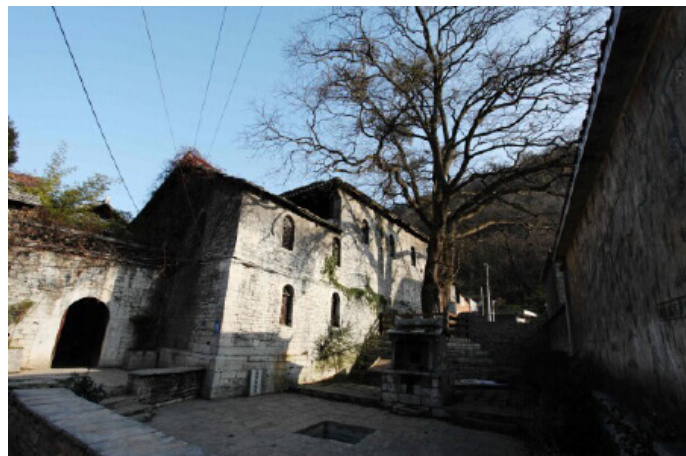
大头 天龙屯堡很原生态

大头 天龙屯堡里设的茶驿、戏台、庙宇、学堂一一看过，奔着安顺的地戏到演武堂看了今日演出“三国演义之三英战吕布”，堂中客人寥寥，但舞者依然进入状态的在场上格斗厮杀演着几百年传承下的古老戏剧，地戏内容相对单一，以武戏为主，在一锣一鼓的伴奏下，一人领唱众人伴和。带着耳边回旋起的隆隆声，走过石头寨，经过的中年老妇基本都穿着古老的风阳汉装，绣花宽袖大襟长袍让我一下子穿越回六百年前。