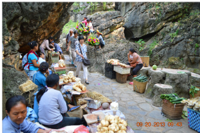
风雨兼程 景区内很多本地的阿姨摆小摊

景区内可供吃饭的地方主要集中在几个景点的大门口，景区内也有布依族老妈妈们自家出售的小食品，有玉米、黄瓜、甘蔗、花生、煮鸡蛋等，卖得都不贵。