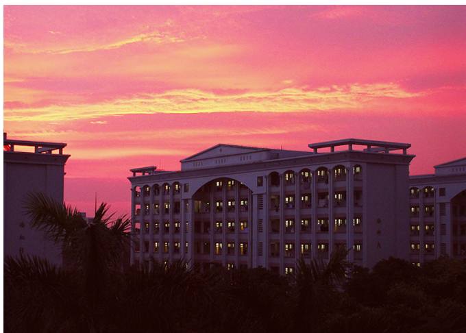
赤子小白 广东海洋大学