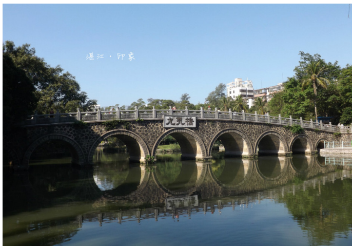
霍文杰 寸金桥公园的标志性建筑九孔桥

寸金公园旧时曾叫西山公园、人民公园，后为纪念 1898 年遂溪人民抗法斗争而改名，园内有一座寸金桥，其名称蕴含着“中华国土寸土寸金不容外敌侵占”之意，园中心的广场屹立着抗法英雄雕像，上有郭沫若“一寸河山一寸金”的题字。园中景色优美，四季鲜花常开，有光苑、圪苑、花圃等观赏园，以及动物园、儿童乐园、金竹园舞场、文化广场等休闲娱乐区，游客可在公园内观景赏花、骑车划船、溜冰跳舞等。寸金公园是湛江人民殊死保卫祖国河山，英勇无畏精神的象征，“寸金浩气”也是著名的湛江八景之一。