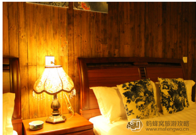
逆離墳墓的宥 碧水云居的木质房间

就在富安桥旁，房间颇有些江南调调，不大但是很干净，特别是酒店的小院，泡杯茶闲坐或者晚上看星星都是一种享受。