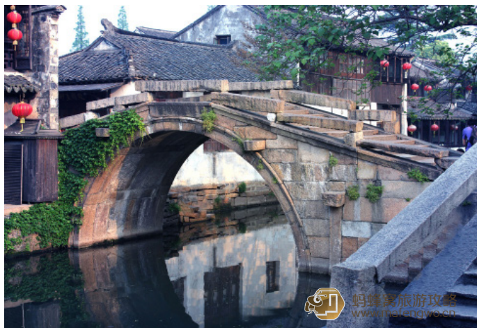
天无翼风 双桥局部