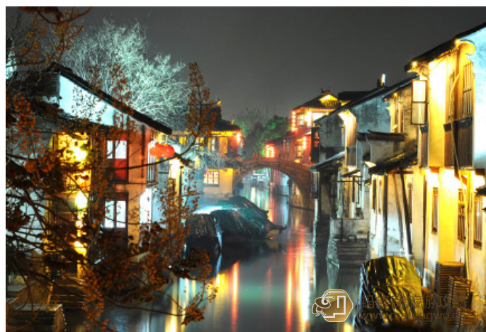
目目 周庄绚烂的夜景

古牌楼（检票口）—贞固堂—逸飞之家—双桥—古戏台—张厅—沈厅—全福讲寺—迷楼—蚬江渔唱—贞丰民俗文化街—贞丰古牌楼 特点：集中游览周庄经典景点，体味浓厚历史文化气息