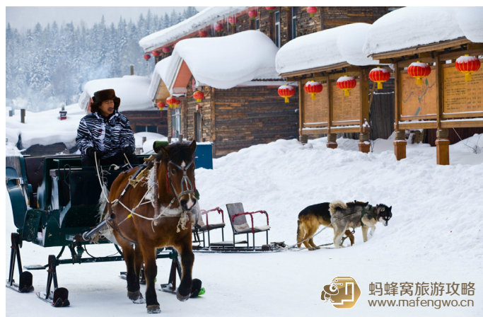
尼洋 马拉爬犁和狗拉爬犁

在雪乡的马拉爬犁已经不是之前那种原始的木爬犁，现在为了快捷，为了游客乘坐舒适都改装了。加之最近两年雪乡万嘉集团的垄断和不太正规的管理经营模式，造成马拉爬犁几乎没有生意可做。因为现在雪乡的马拉爬犁只能在村庄内乘坐，不能走到原始森林里面去。试想那么小的一个村庄，路两旁又都是游客，这个马拉爬犁乘坐起来实在失去了意义。要乘坐马拉爬犁就是应该到原始森林里面去走一段，让马儿欢快的跑起来，并且在森林中拍照才有那种气氛。所以近两年自助游的客人基本没有乘坐马拉爬犁的，都是旅游团的人很无聊也无奈的在街上乘坐一下。