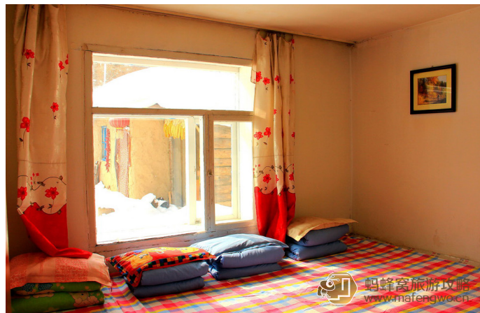
PS 废柴 张利成家大火炕，睡的真舒服。

当然最有当地风情的要属雪乡民居了，雪乡居民几乎每家都会有一间或几间的屋子腾出来供游客住宿，家庭旅馆随处可见，简单卫生。雪乡游客接待能力有限，吃住条件都还不错，住的都是火炕，有少数人家可以提供洗澡。“大炕上面摆酒桌，笨鸡蘑菇大块肉，大碗白酒对着喝”，让游客充分体会到东北人的豪爽和热情好客。