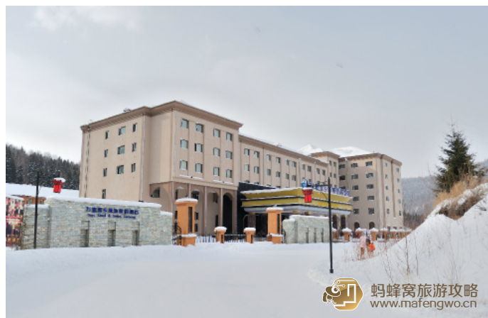
伊林 到达雪乡入住的酒店一万嘉雪乡戴斯度假酒店已经是 17:30 了

叉叉鱼 雪乡唯一的一家正式的酒店，价格 880 元 / 晚，这价格开始有点犹豫，就开始考虑住炕，左思右想包一个炕也差不多要 500-600，还是酒店算了，一咬牙就定下 2 晚，后来发现这个决定实在太英明，到酒店去 check in 的时候，前台死活不相信这个价格，一圈核算下来后只能按照这个价格让我们入住，那时候前台的价格已经超过 1680 元 / 晚，协议价也要 1280 元 / 晚。