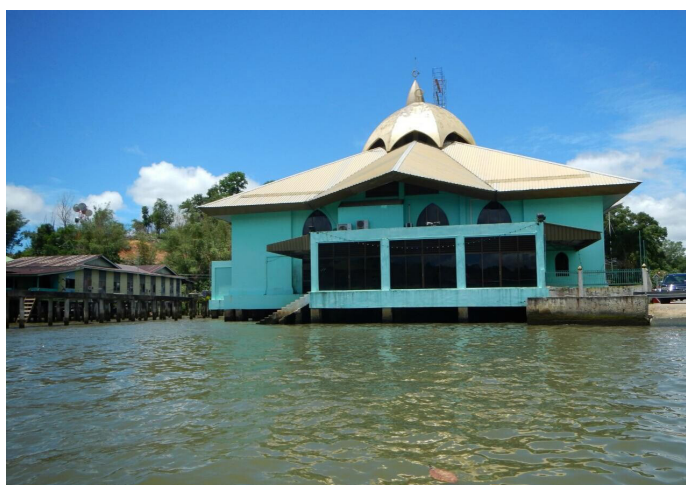
东风瓜瓜 坐落在水上的清真寺