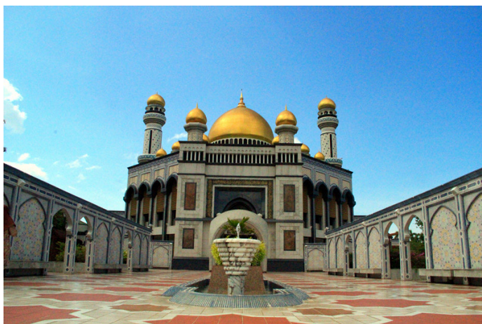
Elenamag 从正面观赏恢弘壮阔的杰米清真寺

寻惑 杰米清真寺金碧辉煌, 有一个可容纳 3000 人同时祷告的大堂, 顶上悬挂着硕大无比的奥地利水晶灯, 灿灿生辉。地上铺满祷告用的地毯, 一人跪坐的大小就是一块地毯的大小, 数一数地上的地毯就能知道可以容下多少人了。所有入内参观的游客必须脱鞋进入, 女性则需穿免费租借的黑袍。寺内不允许拍照, 手机、相机等一切摄影器械需放在包内, 实是一大遗憾。