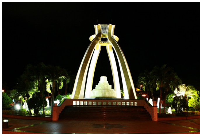
○ 游走天下 ○ 公园门口的雕塑, 在夜间灯火辉煌, 闪耀无比