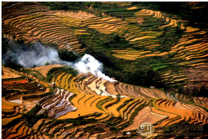
瞄了个咪咪的 坝达美景