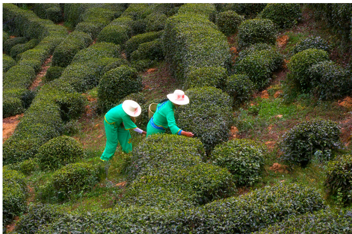
波波男 西乡斗茶会