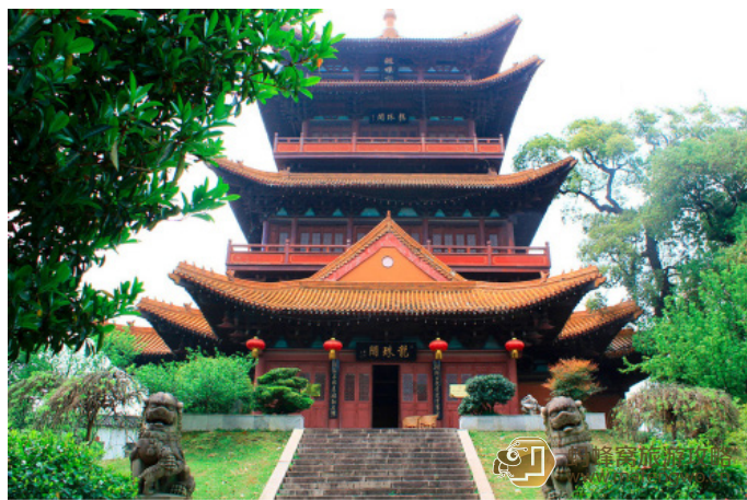
蘑菇张 - NKU 龙珠阁外景

蘑菇张 - NKU 古代皇帝们的生活也太过于精致了，小到养蟋蟀用的罐子，大到众人分汤用的大盘，都有多种花式多种样子，作为有个塑料饭盒就能吃饭的现代人我实在感到无比羞愧了。