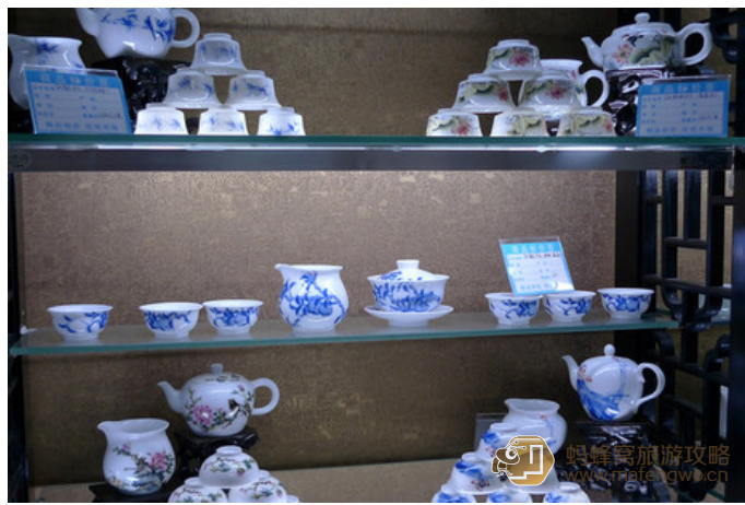
新疆流浪猫 景德镇国际商贸广场里卖瓷器的店铺

逛完，可以去湖田古窑址，参观民窑博物馆、元代葫芦窑和宋窑场址，有人带的话还可以捡些宋代元代明代老瓷片，运气好的话在杨梅亭还可以捡到后唐的白瓷。完事儿了，去三宝国际陶艺村“世外陶源”吃个饭，这地方环境较好，依山傍水的，口味也还好，不贵。重点推荐：雕塑瓷厂的陶艺地摊和世外陶源，陶艺地摊只有周六日上午才有哦，而且人多拥挤。