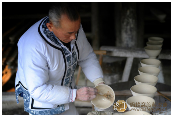
细草穿沙 陶瓷历史博览区，来景德镇不能不来的地方。

bluestop 古窑景区里不但有鼎鼎大名的镇窑，还有小柴窑、葫芦窑等。镇窑里还有烧制好的青花瓷碗卖，不过小号的也要四十一个，古窑的旁边有一个古香古色的小门，没有任何标记，走进去才知道这里是泥胎制作区，一件件精美的瓷器就是从这里诞生的。古窑区还有很多卖瓷器的小店，从装修来看，似乎每家都很有历史，里面的瓷器真的很精美，店里的员工说，景区里的窑现在都在用，店里的瓷器都是在这里烧制的。每家做好自己的泥胎，等到烧窑的日子就把东西拿过去，开窑了再各自取出来卖。差不多可以去听瓷乐表演了。青花瓷的衣服，瓷乐，配上水榭，真的很有意境。紧挨着表演区的是明清古建筑区，里面有一些明清的古建筑，再往门口的方向走，就会到达清园和玉善堂，里面是一个小型的历史博物馆，不但讲述的景德镇发展和制窑的历史，还可以看到很多小文物和各种窑的缩小版模型，让人更直观的了解各种窑的构造和的特点。出了清园，离景区出口就不远了。