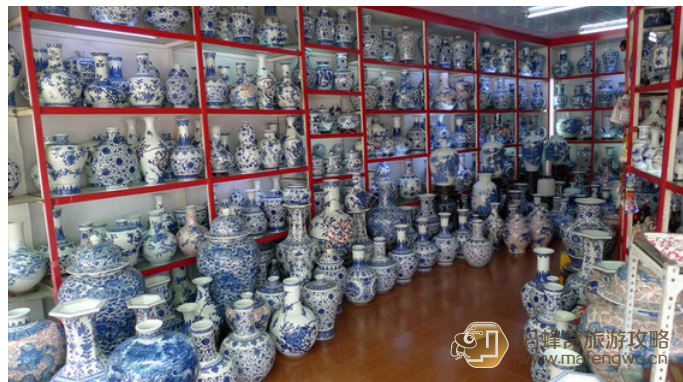
新疆流浪猫 景德镇国际商贸广场里到处是卖瓷器的店铺