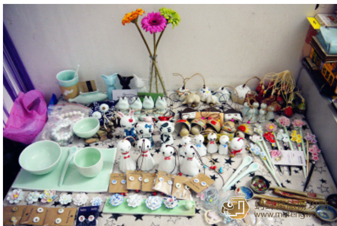
fish 的旅行 我败的这些小游戏儿，超喜欢的

到达交通：1007、1013、1033、13、2013、2033、23、3033、23、3033、33、3、7 路雕塑瓷厂站