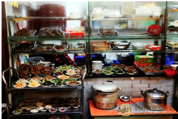
爱拉 毛仔特色小吃，店面不大，人气很足