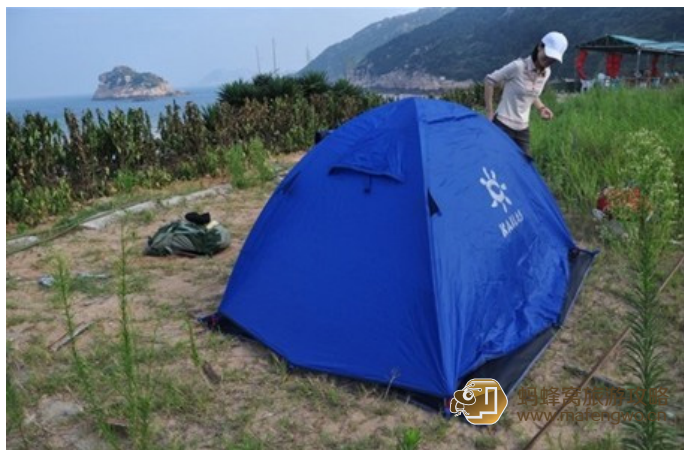
面朝大海 扎营发呆~