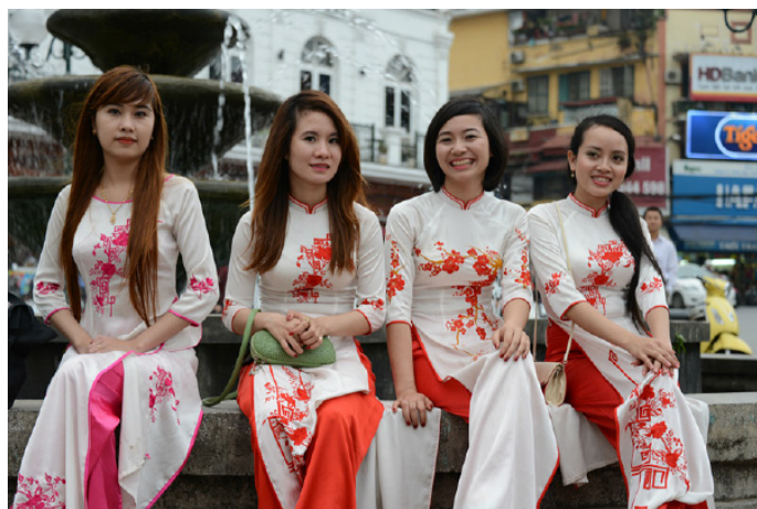
JOJO 带你游世界 定制奥黛

它是越南的“国服”，类似旗袍，开衩到肋下部，两侧露腰，下面多一条宽松的配套裤子。而整个越南，就数会安的裁缝手艺最好，所以很多游客专程到会安定制一套奥黛。