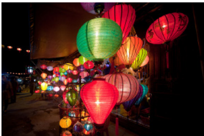
挂满了灯笼的会安古镇

会安古城位于越南中部，距离岷港距岷港 30 公里处海边，属广南省。1999 年联合国教科文组织将会安古城作为文化遗产，列入《世界遗产名录》。会安仿佛是一座中国古镇，满街的中式会馆挂着红灯笼，到处可见的中国文字。会安给人的感觉是宁静的，安逸的。秋盆河上的行船贸易已有百年历史，港口依旧热闹繁华。街道的布局、建筑的式样，既展现了中华建筑的古朴和优雅，又融入了当地人的自然审美观和生活情趣。游客在这里既能欣赏到古老的文化传统，又能感受到浓郁的地域气息。