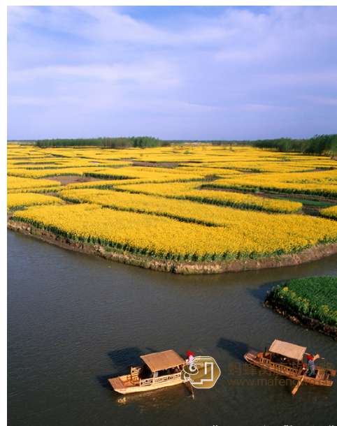
张翔 兴化漂亮的色彩

2015 年的兴化油菜花由 3 月中下旬逐步进入赏花期，2015 中国·兴化千垛菜花旅游节于 4 月 3 日至 5 月 3 日举行。