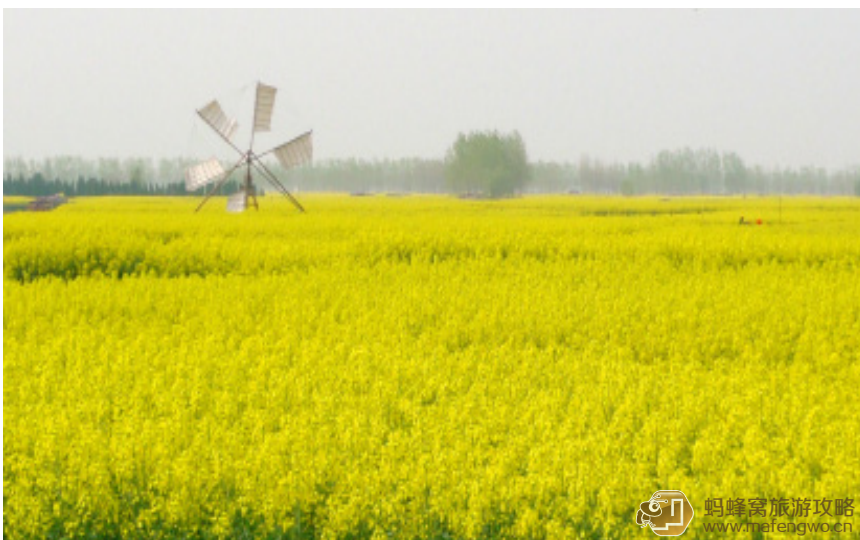
astongao 饼干 缸顾乡千岛菜花

板桥道情、茅山号子、段式板凳龙等特色文化影响深远，茅山号子曾唱进中南海。今天我们将去游览的李园、县丞署、元老府、郑板桥故居、东岳庙、古城墙、成家大司马府、上池斋药店、赵海仙洋楼就是其中的佼佼者。