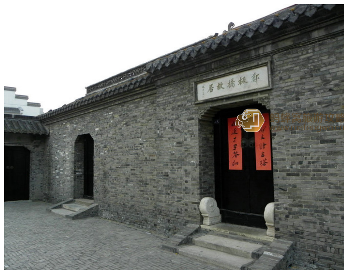
邪恶熊宝宝 郑板桥故居

自驾（兴化市到徐马荒）：全程约 16.9 公里，五里东路 1.1 公里→环岛第 2 出口走五里西路 1.5 公里→右转走过境公路 3.4 公里（过建业路、大溪河桥后第一个路口左转）→左转 10.8 公里，抵达徐官村。