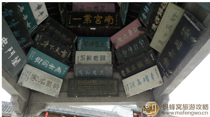
astongao 饼干 兴化四牌楼亭“南宮第一”

苏中其实没几个城市是有吃早茶的习惯的，似乎也只有兴化和泰州市里有这个习俗。早茶，已经深入兴化人的骨髓，全名参与，吃的是一份情趣，让人倍感亲切。