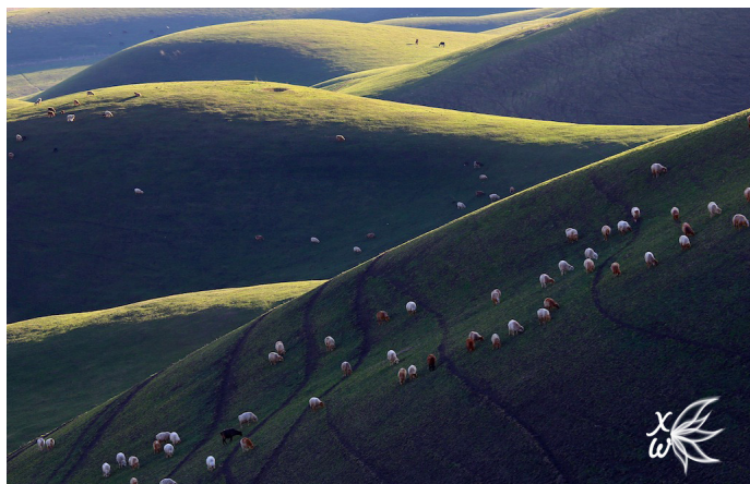
狐行天下 散落在绿草地上的马群。

好在伊犁盆地中已经形成比较完善的交通网络，取道任何一个方向，都可比较便捷地到达包括杏花沟在内的各旅游景点。如果条件允许，包车是游玩这些景点的最佳方式。