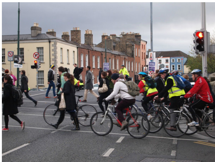
梦回雪山木兰围场 酷爱骑行的都柏林居民