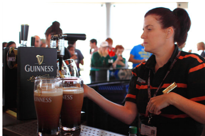
小猫芯 健力士黑啤展览馆顶楼酒吧

健力士黑啤(见 10 页)是爱尔兰人最喜欢喝的啤酒品牌, 这个以此为主题的展览馆共 8 层, 从黑啤酿造过程到企业发展史再到产品展示, 向游客详细而有趣地介绍了健力士黑啤的发展状况。参观完后还有现场教学, 教你如何酿造一杯属于自己的黑啤。你还可以一边喝着免费的香醇黑啤, 一边在顶楼边 360 度俯瞰都柏林的无限风光。