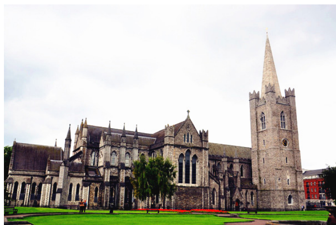
穿背带裤的猴子 古老的圣帕特里克大教堂

这是爱尔兰境内最大的教堂，《格列佛游记》的作者斯威夫特曾经是这里的主教，前两任爱尔兰总统也选择死后长眠于此，此教堂的地位自然不容小觑。教堂看起来古老而庄严，呈哥特式风格，西侧的钟塔里还收藏着爱尔兰最大的钟。教堂旁边还有一块同名的绿地公园，中心是一座小型喷泉，在树木的遮挡下，一座古城堡时隐时现，夏天门前开满鲜花，十分美丽。