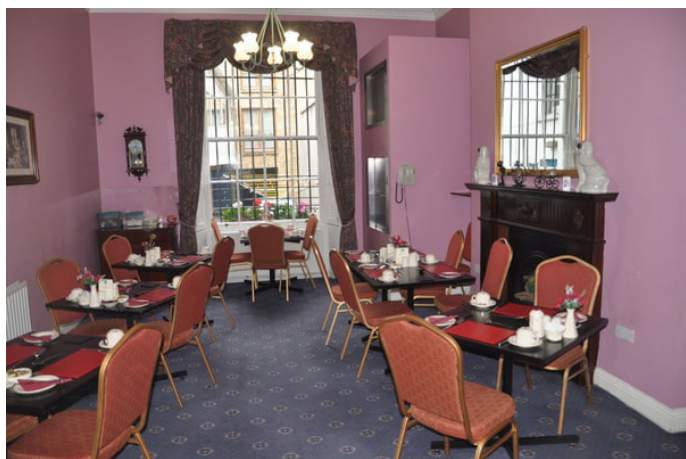
自得其乐 酒店的自助餐厅

自得其乐 旅馆提供早餐，每人 8 欧元，是自助餐，旅馆的软件好，硬件也不赖，客厅和餐厅是古典式的，像电影里看到的贵族住家一样，就餐时客厅音响播放着古典音乐，很对我的口味，令我胃口大增。