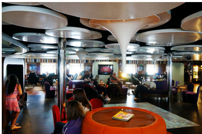
赵钱 孙李 远洋轮渡一角

Seatruck Ferries 官网: www.seatruckferries.com