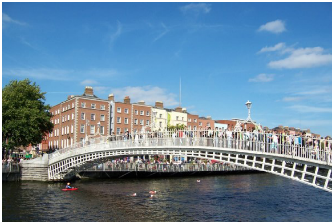
左岸右转 半便士桥

D4：早上驾车前往凯利莫修道院，这是一座坐落在山间的修道院，静谧而古老，有种世外桃源的感觉。旁边的维多利亚围墙花园也精致美观，不可错过。