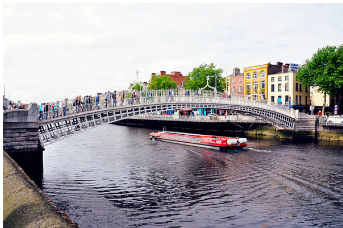
穿背带裤的猴子 繁华的半便士桥风光

曼 纯真发酵 /ka 这个桥是爱尔兰典型的爱情桥哦！以前桥上全是各种各样的锁，但是因为内些锁都太重了，说是这样下去，桥会有塌掉的危险，所以在 2013-2014 年期间就把桥上所有的锁给清理掉了……不过现在去还能看到一两个刚刚挂上去的锁！