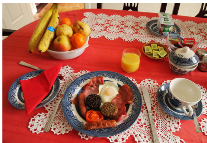
梦回雪山木兰围场 酒店女主人做的爱尔兰传统早餐

爱尔兰的传统早餐与英式早餐相似，包括培根、香肠、煎蛋、血肠 (外表类似中国的香肠，又名黑布丁，肉质紧致美味)、烤面包和煎西红柿，有的时候还会配有炒蘑菇、烤豆子和苏打面包。早餐时通常配以爱尔兰早茶和新鲜水果，品种多样，营养均衡。都柏林的很多宾馆都会提供这样的早餐。