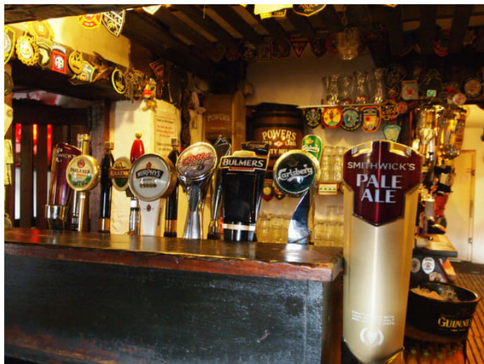
梦回雪山木兰围场 品种多样的酒

地址: 15 Merrion Row, Dublin 网址: +353-1-6607194 营业时间: 周一至周四 10:30-23:30, 周五、六 10:30- 次日 00:30, 周日 12:30-23:00 联系方式: +353-1-6607194 到达交通: 距离圣史蒂芬绿地 270 米, 步行可达; 或乘坐 25、25A、25B、25X、33X、38、38A、38B、38D、39、39A、51D、51X、66X、67X、70 至 Huguenot Cemetery 站下车步行 50 米 参考价格: 人均 10 欧