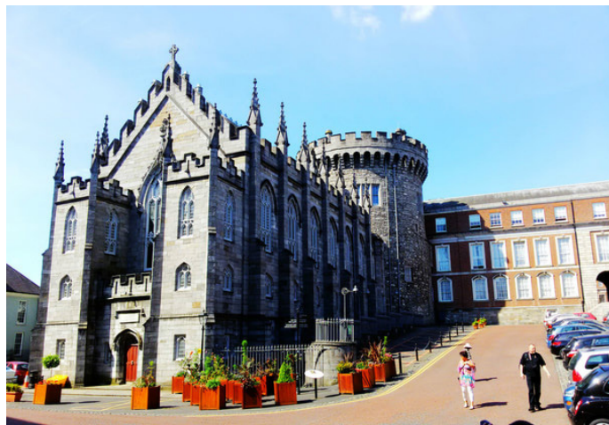
赵钱孙李 阳光下的都柏林城堡

建筑于 1204 年的都柏林城堡是都柏林市内最古老的建筑之一, 其建筑风格和规模在当时堪称欧洲之最。这座城堡式的建筑四周是高高的围墙, 正门有吊桥。厚厚的石头外壁, 中间是古堡大厅。城堡之前用以盛放国王的金银珠宝, 如今珠宝已不知去向, 城堡却依然矗立着。现在城堡内部的国宴厅、两个博物馆、咖啡厅和花园可供游客参观, 2 个政府办公室所在地不允许游客入内, 在门前可以看到明显标识。