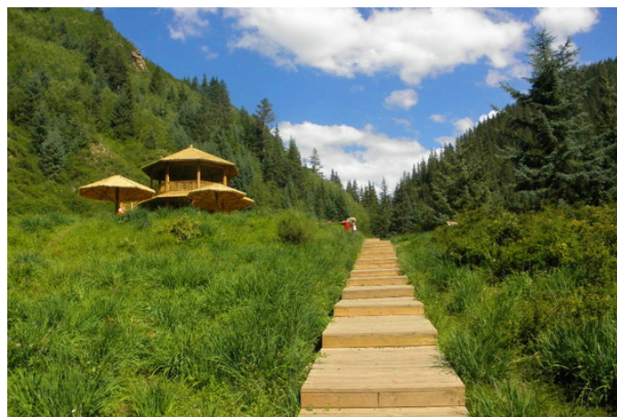
疯峰峰 焉支山风景区

焉支山上原始森林覆盖，主要为松柏一类，风起时松涛阵阵，使人有出尘之意，山上尚有玉皇观及钟山寺两处人文建筑，其中玉皇观为山丹县道教协会所在地。山下有一峡谷被称为焉支峡，峡内有溪水一条。焉支山的主峰是毛帽山，海拔最高处有3978m，是仅次于祁连山的一座独立山脉。建议5-8月间天气暖和时游玩。