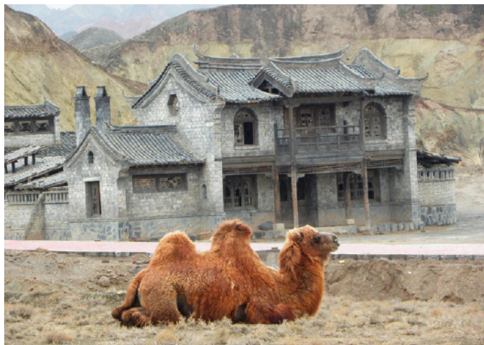
山大王 《三枪拍案惊奇》中的麻子面馆

路到天边你也得去呀！逗的一行人哈哈大笑！前面是断崖窄窄的小路也断了，站下举目四望，这里的丹霞地貌又是另一番景象。