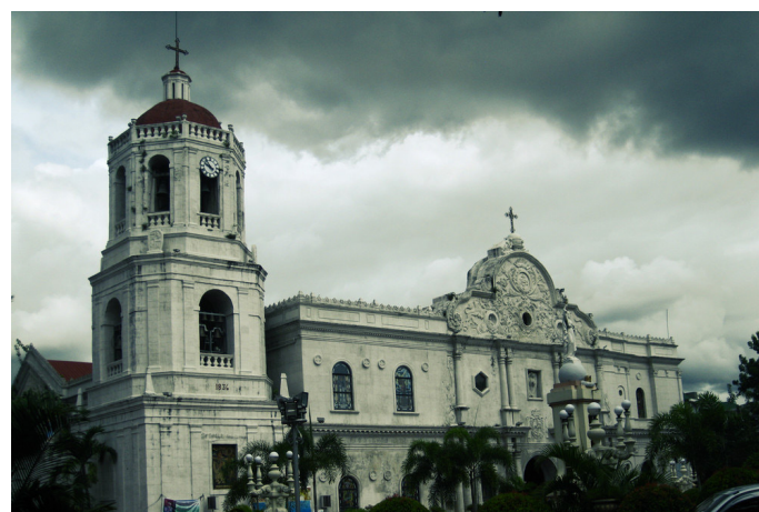
镜 king 宿雾大教堂

hingewang 很有特色的教堂，做礼拜的人很多，运气好的话能看到当地新人在此举行婚礼。