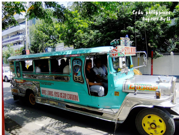
本田 GUI 佑 五彩缤纷的吉普尼

吉普尼 (JEEPNEY) 是宿雾市内最方便的交通工具，是菲律宾主要大众交通工具，在宿雾市区内搭这种车非常方便，一趟约 70 比索；车内有计价器，市内起步价 35 比索，每 200 米收费 2.5 比索，吉普尼有指定的路线，由数字和字母标示，车的侧面也会有相应的标示。大多数吉普尼都会先去市中心再去路线的起终点。吉普尼当年是从回收美军淘汰吉普车而来，每一辆吉普尼都被司机精心打扮，在菲律宾你绝对找不到两辆相同的。