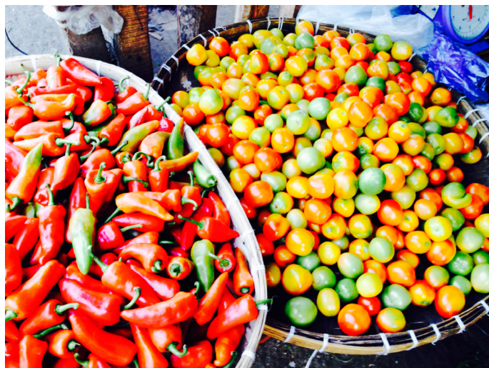
26 楼的小爱 卡尔邦市场里的蔬果

26 楼的小爱 卡尔邦市场永远都是人流拥挤，活色生香的市井生活，很有真实的味道。那些水果也是便宜到无法叫人相信。我最喜欢的青柠 1 公斤 40 披索，大约 6 元人民币一公斤。一想起青柠就想到夏天的味道。