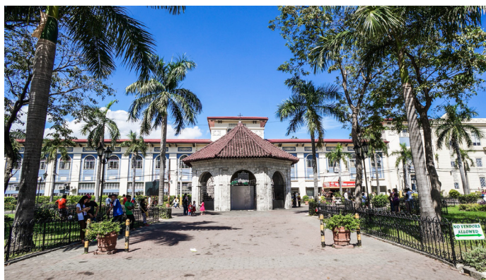
zhang_xunan 麦哲伦十字架外观

火星哥哥 画在穹顶的壁画很美，是十字架的来历故事。外面有很多大妈，统一穿黄色衣服，拿着一捆蜡烛，你只要付 50P，就可以让她来给你许愿。关键是，他们边跳边念念有词，煞是好玩。