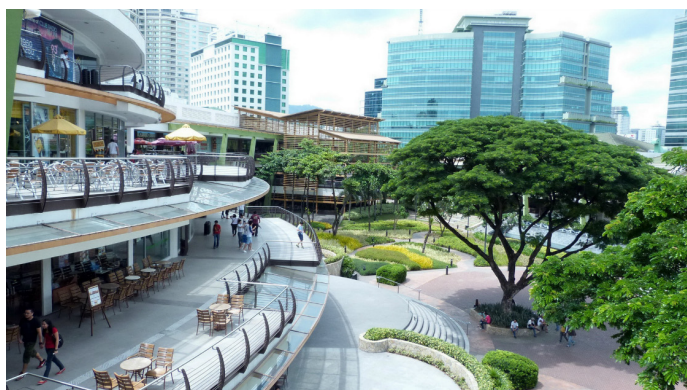
Ayala Center 的感觉还不错，有点在新加坡的感觉

juice050 进商场要安检，商场内到处都是持枪的保安，商场里面其实和国内的差不多，整体物价比我们天朝要便宜些，买了条 Lee 的新款短裤，200 多人民币，比国内便宜很多；Lives 的价格和国内差不多。