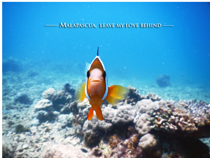
边缘儿 Hey, Nemo 你好!

边缘儿 妈妈拍丝瓜岛上每一天的海水颜色几乎都不同，远眺时能看见非常分明的颜色层次，除了海水深度变化之外，更重要的原因是靠近海岸的地方生长着好多海藻，所以颜色会比较深，也让整个海岸线不再单调。