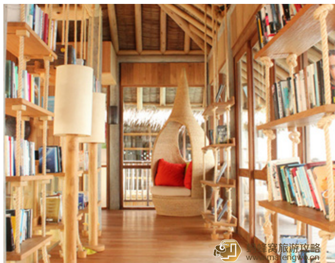
Wario 第六感拉姆岛上的图书馆

爱旅游爱奶茶 岛上所有收费事项均要加上 6% 的消费税，2.5% 的碳排放税，10% 的服务税，税赋很重的啊。出海浮潜 45 美元，出海看海豚 90 美元（未含税）。神奇的是，我和猪妹花钱出海看海豚没有看到，反而是吃早饭时、吃晚饭前、临走收行李时，看到了 3 次海豚，每次地方不一样，海豚果然天天出勤的路线要变化啊。Laamu 岛两大特色，一是岛的一边随时有大浪，适合喜欢冲浪的人，二是岛周围一圈都是海豚们出勤热爱的路线。