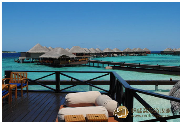
泡芙小妹 瓦度岛一角

hailan_evol 关于 Vadoo 的房间，日出水屋是朝向岛的，日落水屋是朝向海的，各有各的好处：日出水屋下水后的水域相对风浪会小一些，更适合浮潜初体验；视野没有面对海那么宽广，因此价格也更便宜；曾经