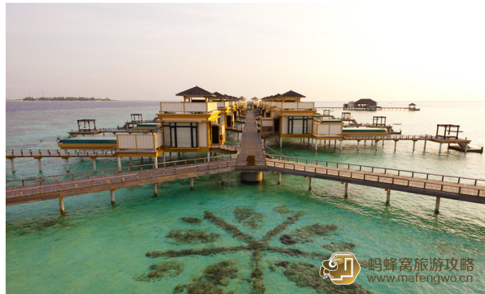
Colorshell 薇拉瓦鲁岛的水中阁

Colorshell Velavalu 根据当地语言翻译过来也是绿色海龟的意思，因此也叫做海龟岛，即 AV 岛。岛的北侧有全岛面积最大的沙滩，而且由于离各种公共设施（酒吧、餐厅、婚礼堂）较近，是客人在全岛的集散地，所以便于开展各种娱乐活动。由于沙质较好、水也是由潜入深，所以水上娱乐中心也设在这里。沙滩上还能踢足球、打排球，有各种沙滩床、躺椅和太阳伞。尽管在岛的北侧，但是由于地形的关系，有一个向西的凸起，所以不仅可以享受到来自南侧的阳光，也可以欣赏到日落余晖。喜欢拍照和热闹的朋友可以选择临近这里的房间居住。