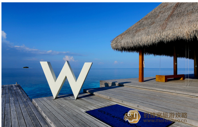
小妖 0725 看到这个硕大的 W 的标志就到宁静岛了

小妖 0725 我把在 W 岛的后面两晚定了 Seascpe Escape 的房型，圆形的亭子，圆圆的大白床，圆形的泳池边缘，泳池、海水、天空不同层次的蓝融合在一起，在这里什么都不做，只是发发呆晒晒太阳也是一种终极享受啊。