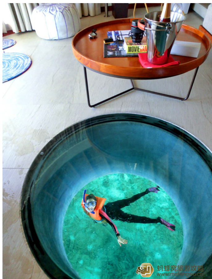
小妖 0725 潜水的乐趣