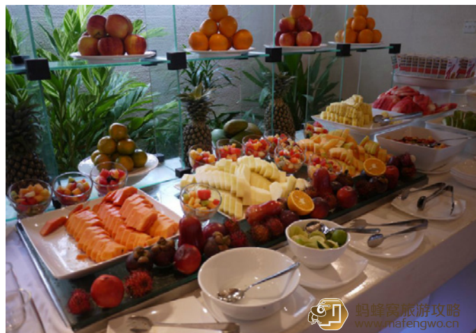
大叔的亲亲 lily 岛的早餐餐厅