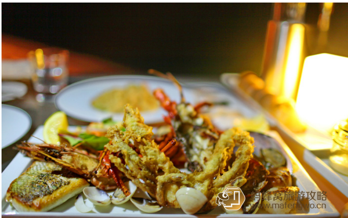
小妖 0725 FISH 最有名的便是这个海鲜拼盘。一份两个人享用足矣

在这里，你可从当天捕获的新鲜鱼类以及来自世界各地的优质进口海产中任意挑选，也可在寿司吧前舒适就座、细细品尝，或在临水而建的双人餐桌旁欣赏一望无际的美丽海景。