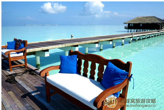
小飞侠 泰姬珍品一角

小飞侠 泰姬珍品是个名副其实的蜜月岛，是马尔代夫最大的泻湖岛。说到这个最大的泻湖岛，意味着它拥有最美的海水颜色，但是也意味着水下白沙一片，没有珊瑚（虽然没有珊瑚但是鱼不少哦）。对于浮潜爱好者，或者对于去马尔代夫就是要选择水下环境丰富的人，看到这里就可以不用考虑了。马尔代夫浮潜分级，泰姬珍品分到了第三级（一共就三级，第三级是浮潜时啥珊瑚都没有），这个分级绝对靠谱。但是对于不会游泳、对浮潜没过多要求的这个岛非常适合。水相对浅，安全系数高，鱼很多，也很有看头。