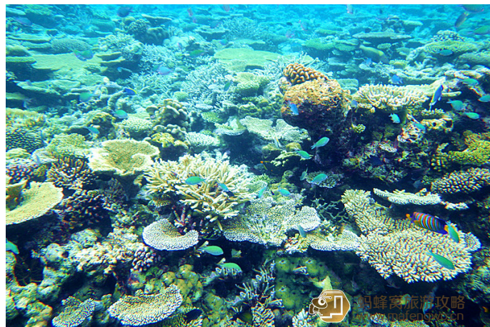
小飞侠 泰姬珍品无边的珊瑚山

最大的泻湖岛，所以水性好，又喜欢浮潜的，不推荐。大都是白沙，没有珊瑚。只有豪水下有很多鱼，珊瑚看不到什么。