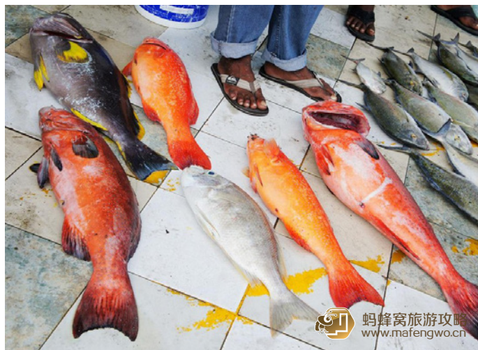
Alice Blue 马累鱼市上的各种鱼

Alice Blue 几乎每个来马累的游客都会来鱼市场观赏他们宰鱼。这是一大特色，他们说，这里的宰鱼是全世界宰鱼最快的。卖鱼的只负责卖鱼，不负责宰鱼，在市场里面专门有人宰鱼，另付宰鱼的钱，按大小论条的算。除非你买的是大鱼已经宰好切块卖的。