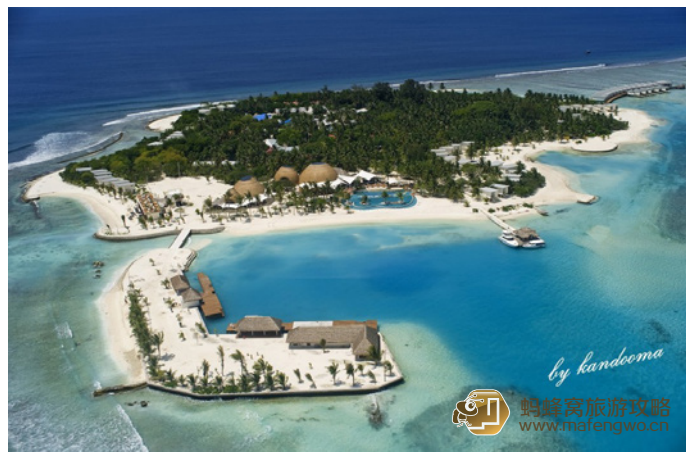
大熊猫 康杜玛岛的全景图

到达交通: 酒店提供马累国际机场到康杜玛岛的接送, 从机场乘坐快艇 40 分钟即可到达。