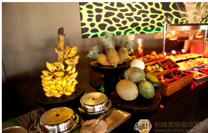
Colorshell 薇拉瓦鲁的餐厅，水果很丰盛

Colorshell 主岛上在码头处还有一家精品海鲜西餐厅，英文名“Funa”。这家餐厅只提供晚餐，而且并不是每天都开，需要提前进行预订。由于可以欣赏到夕阳西下，所以用餐的景色要好一些，也较浪漫，但是收费自然很高，一餐的消费从 300 到 500 美元不等。