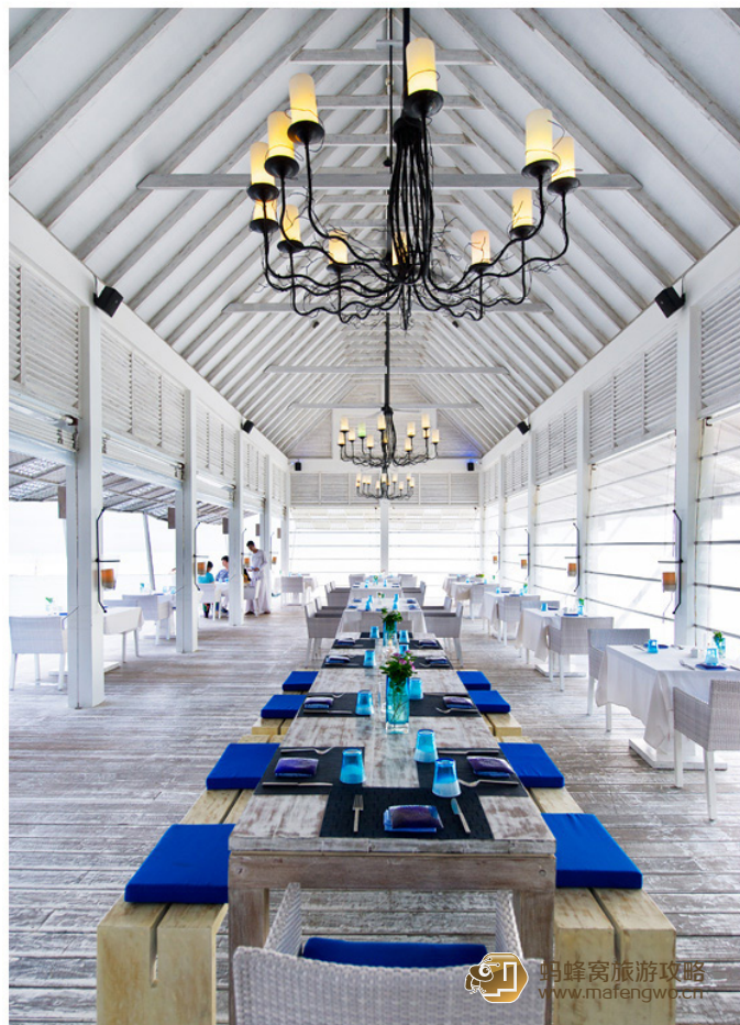
gtis 四季兰达吉拉瓦鲁岛餐厅

它是一个位于距海滩不远的室外餐厅，那里不仅有来自海洋上美丽的风景和新鲜的空气，还提供有美味的刀削肉和海鲜食品供游客尽情的享受。