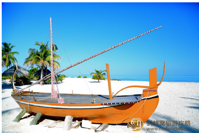
Wario 鲜艳的 Dhoni 多尼船，白天用来装饰，晚上用来摆放沙滩自助餐的食物

Wario 说说岛上的活动，主要有陆地活动和水上活动。其中陆地活动有网球、篮球、乒乓球、台球、桌上足球、电玩室、自行车和 LUX* ME Fitness Center 健身中心。水上活动就特别丰富了，有风帆冲浪、风筝冲浪、滑水、喷气式滑水、浮潜、深潜、快艇、皮划艇、脚踏船、日出晨钓、日落海钓等等和各式各样的其他活动。LUX* 岛上活动的种类多也是我们当初选择它的原因之一。如果你要出海浮潜和深潜，就必须要通过每天下午在 Water Sports Center 水上中心进行的一项游泳测试，通过后才能自己出海，如果你就近进行浮潜的话就不需要进行此项测试了，直接去水上中心借浮潜装备即可，记得每天下午五点前归还。第二天我们选择了 Sunset Fishing 日落海钓，从 17:30 到 19:30，海钓归来正好晚餐。钓起来的鱼可以交给岛上的任意一个餐厅加工，无需付费，但是一个房间只能选择一条鱼，并且要在海钓的第二天晚上才能享用。