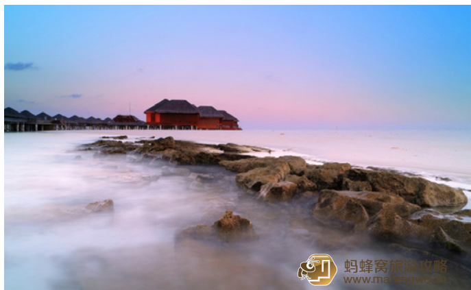
一品逍遥 芙花芬岛

芙花芬岛位于马尔代夫马列北环礁，“Huvafen”是当地语言“梦”的意思。正如她的名字一样，芙花芬度假村诠释了一种似幻似真的绝美意境。海岛在海底 40 米处拥有世界上第一个玻璃构成的水下房间、第一家水下 SPA、水上瑜伽帐篷、海底酒吧以及地下酒窖。岛上共有 44 间海景或海上豪华别墅，屋内都是极简精致时尚的海洋设计风格，每栋别墅都有自己的特色且皆拥有私人泳池。