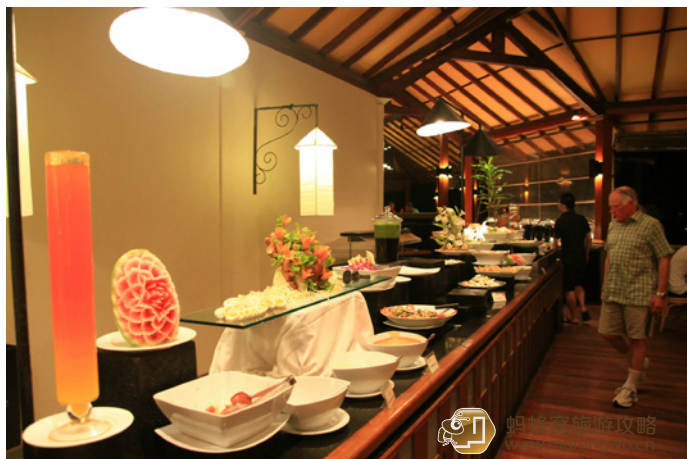
cindy0207 蜜杜帕卢岛的助餐厅