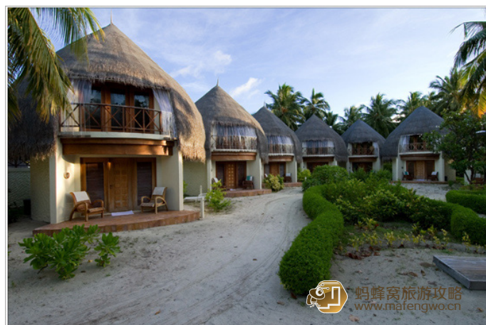
gtjs 班度士岛上可爱的茅草屋造型高级房

到达交通：距离马列国际机场及首都马列大约 7km，乘 15 分钟舒适的快艇就可抵达，或是乘坐当地的小艇 45 分钟亦可到达。