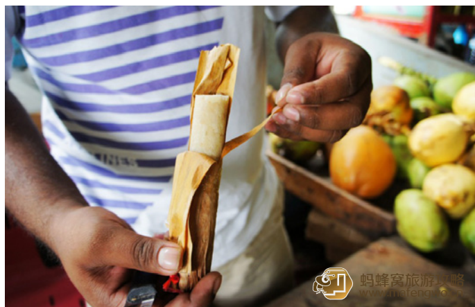
Alice Blue 马尔代夫巧克力，很甜。

本地市场位于海路，距鱼市仅一个街区远的地方，不过几分钟的路程。它相当于中国的农贸市场，由一个个小货摊组成。这里聚集了来自马尔代夫全国各岛的人，在这里兜售他们本岛的产品。与鱼市那种紧张忙碌的气氛比较起来，这里节奏较慢，气氛平和。