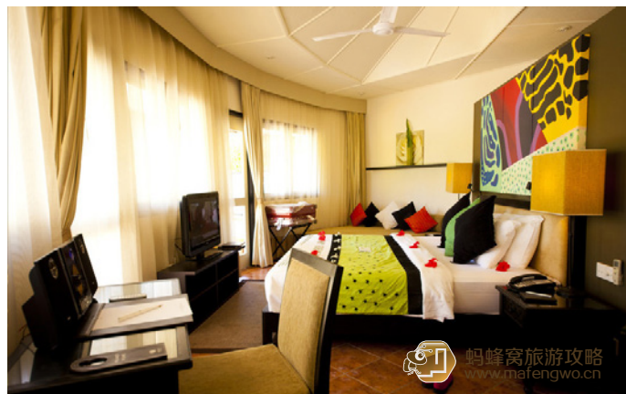
Colorshell 薇拉瓦鲁岛沙屋的卧室。从门口往里看的视角

Colorshell Velavalu 根据当地语言翻译过来也是绿色海龟的意思，因此也叫做海龟岛，即 AV 岛。岛的北侧有全岛面积最大的沙滩，而且由于离各种公共设施（酒吧、餐厅、婚礼堂）较近，是客人在全岛的集散地，所以便于开展各种娱乐活动。由于沙质较好、水也是由潜入深，所以水上娱乐中心也设在这里。沙滩上还能踢足球、打排球，有各种沙滩床、躺椅和太阳伞。尽管在岛的北侧，但是由于地形的关系，有一个向西的凸起，所以不仅可以享受到来自南侧的阳光，也可以欣赏到日落余晖。喜欢拍照和热闹的朋友可以选择临近这里的房间居住。