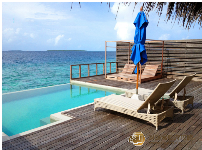
春意繁芜 都喜天阙岛房间的露台和游泳池的房间

D、泰国的酒店集团印象好。泰国菜，SPA，都是我爱的。据说 DUSIT 的这两项都是皇室水准。