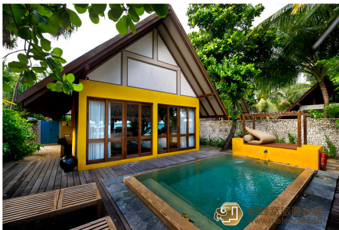
gtis 四季兰达吉拉瓦鲁岛的房间

gtis 这个岛的面积大，环岛走一圈大约要 35-40 分钟。房间内的洗漱用品全部提供的是欧舒丹。大堂的设计感很好，裸色的墙壁和地面，原色的木长椅，加上暖色系的靠垫，感觉很舒服。可能家庭概念是四季的着重宣传点，这个岛同样也配有儿童活动中心，还有室外游乐场。沙滩屋我非常喜欢，院子里的游泳池和观景凉亭都很不错。