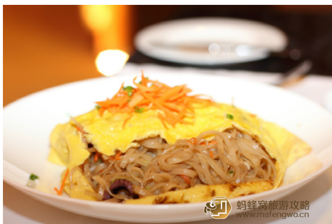
小白兔呖 Park Hyatt 泰式海鲜炒粉

小白兔呖 全岛免费 wifi，之前看攻略说，这里有中文翻译，但我们这次去时没有中文翻译，只有一个像是韩国人的女孩子，讲的中文是英语直译过来的那种，还好我们都听得懂。水屋 14 间，villa 45-51 的房间都比较接近海沟。房间打扫早晚一次，一般都是放 2 美金在枕头边就可以了。管家我们也是去之前在网上查询，说这里要给 5 美金，而且最好每天固定，结果发现不是这样，其实 2 美金也可以，他一样很友好的对你。