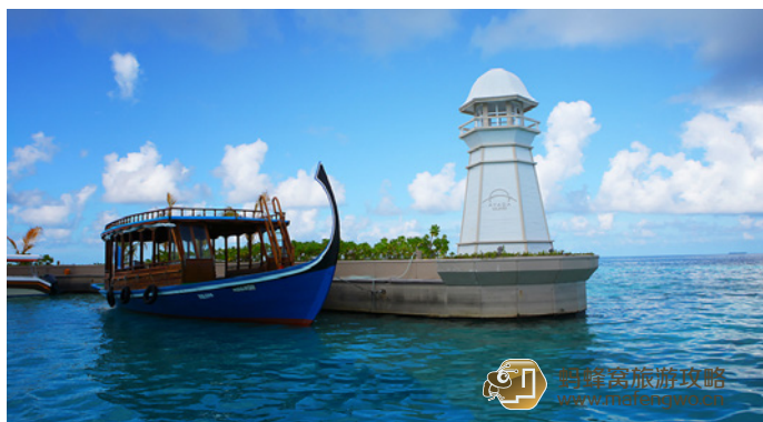
叁月 阿雅达岛出海的码头

蜜月赠送 住满 4 晚送 5 道菜烛光晚餐，欢迎鸡尾酒，一次别墅内早餐服务。（结婚证半年有效，不过根本没人查）