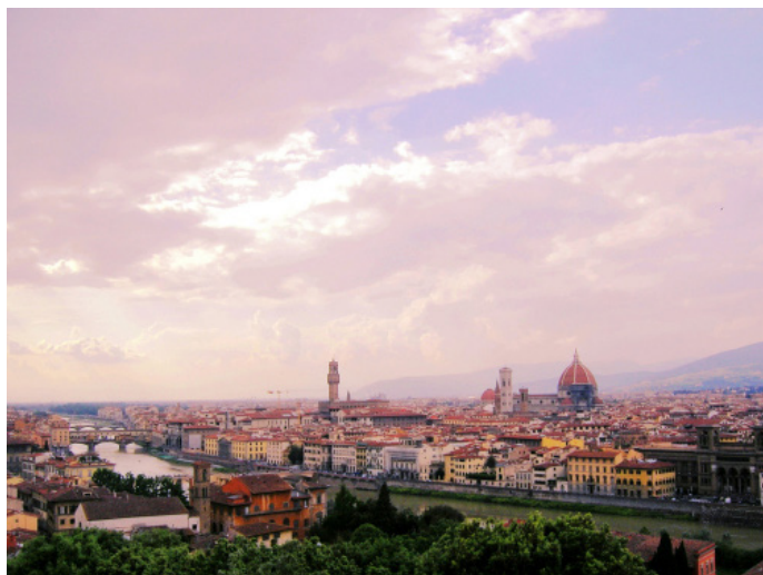
大葱 米开朗基罗山上俯瞰佛罗伦萨城

晚上佛罗伦萨广场有许多街头艺人表演，百花教堂晚上也会打灯，用完晚餐之后不妨到街上逛逛，感受凉爽空气。 Cheer* 淇