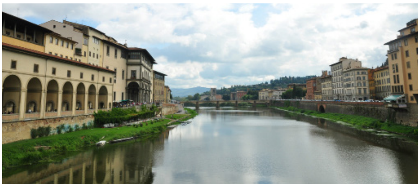
笨笨蟹老桥上看阿诺河两岸。

松露拥有无法描绘的滋味，佛罗伦萨人最珍贵的食材，只要几克松露就会令一整盘的意面散发出诱人的美味，如果想在一年四季中随时尝到一小口这种美食，可以到高级餐厅如 Procacci (见 10 页) 品尝。