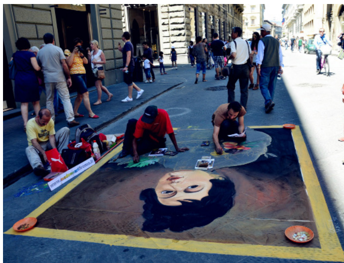
突围扬州 路边粉笔画

木木 如果说罗马城有着厚重的历史，佛罗伦萨则处处散发着艺术气息。街头的墙壁上是涂鸦，连停在巷子中的一辆车身上也喷上了抽象线条和色块。教堂门口街头艺人在挥笔绘制素描肖像，另一位用水彩笔在裁好的白纸上飞快地抹几笔，点染几下，换用不同色彩，一幅百花在山间原野绚烂盛开的田园小品就跃然纸上了。一个男孩子蹲在地上，以路面为纸，描绘大幅的肖像画。