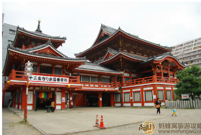
kindTan 寺庙里面是不能拍照的，不能违背菩萨的意愿，外面拍一个就好。

观音寺又称真福寺，正式名称为“北野山真福寺宝生院”，文库收藏着包括古事记的副本在内的 1 万 5 千本古书，有“日本三大经藏”之称。寺庙原本在岐阜的大须，1612 年德川家康在名古屋建城后，才派人将整