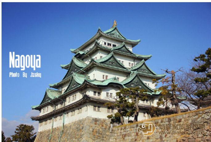
Jzsky 这就是名古屋城了 感觉他比大阪城要胖一点

名古屋城和大阪城、熊本城并称为日本的三大名城，最初由德川家康修建，其中的天守阁是德川家三代世袭居住之地。名古屋城经二战损毁后重建，并增设了电梯，可直接前往顶部天守阁参观博物馆内的文物。城中最为著名的是金鯱，作为防火的符咒被用来装饰大梁，后来成为城主权力的象征。春天 2000 多株樱花盛开，和城堡掩映成趣，是名古屋城最漂亮的时候。每到周六日和节假日，二之丸还有饰演德川家康、织田信长等人的战国武将队，进行人气歌舞表演。