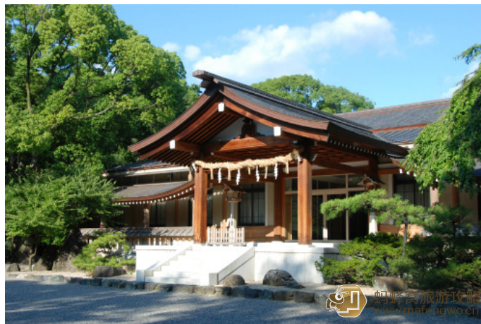
不会飞的旱鸭 溜达在这样的路上整个人心情都会变好呢~

热田神宫是日本最古老和地位最高的神宫之一，历史气息浓厚，以供奉日本三大神器之一的草薙剑而闻名，然而神器并不对外展出。二十五丁桥、佐久间灯笼等古迹分布于此，热田神宫最吸引游客之地则数宝物馆，藏有 2000 多件古董、艺术品和古典文献。内部还保存着织田信长桶狭间战役胜利后捐赠的信长屏。众多祭祀、节日活动都在此举办，其中有神职者一边走一边笑的醉笑人活动，每年 6 月 5 号的热田祭是这里最热闹的时刻。到此参拜的民众络绎不绝。