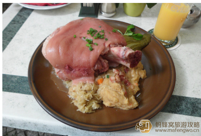
小虫子 ADADADA 德国猪肘和酸菜

德国可谓是“大口喝酒，大口吃肉”的民族，到德国一定要尝试一下正宗的德国猪肘，味道纯正、分量足。德国香肠的种类多样举世皆知，主要原料从猪肉、牛肉到蔬菜或动物内脏都有，也经常搭配各类香料而制作成风味独特的地方口味。在吃法上，不仅可以水煮、油煎或烧烤，同时也可以做成沙拉、煮汤、或直接生吃。德国人爱吃土豆也是世界闻名的，它有众多的烹饪方式：土豆泥、煎土豆饼、炸土豆条等等，既可作为主菜，又能做配菜。