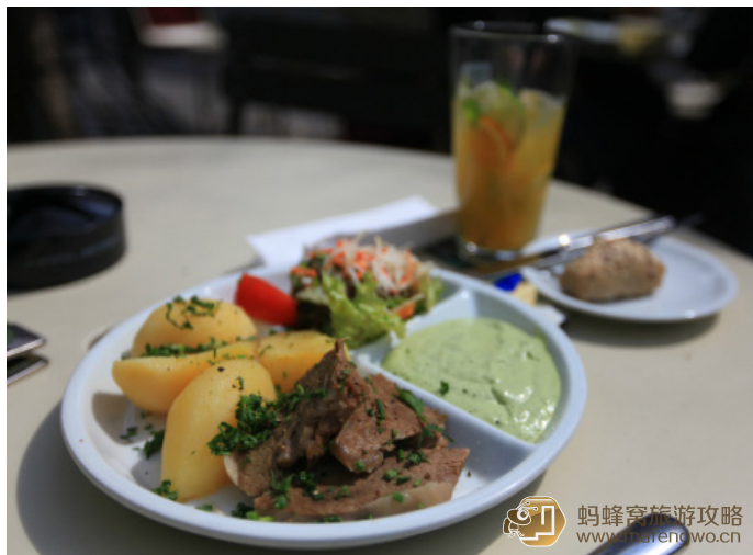
Cloudy 焦小姐 法兰克福美食