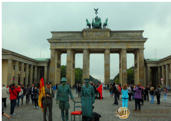
小虫子 ADADADA 勃兰登堡门

勃兰登堡门位于柏林市中心, 坐落在巴黎广场 (Pariser Platz) 上, 是举世闻名的柏林标志性建筑。随着 1961 年柏林墙的建立, 勃兰登堡门在其后 28 年间始终是一道不可逾越的城门。作为德国重新统一的标志和象征, 它凝聚着这座城市的历史。门上的铜塑雕像, 展示着胜利女神维多利亚驾驶一辆四马两轮战车的英姿。