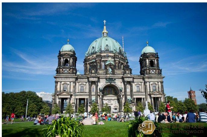
笑漪妹妹 Smile 柏林大教堂

柏林大教堂建于施普雷岛（Spreeinsel）北部，是柏林最大的教堂和曾经的王室宫廷教堂，也是德国最重要的教堂建筑之一和德国新教教会中心之一。这座教堂的建筑带有巴洛克和意大利文艺复兴鼎盛时期风格，地下室的陵墓安葬着几十位王室成员。