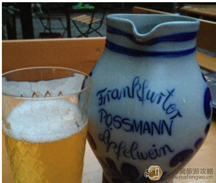
Cloudy 焦小姐 很多人推荐的苹果酒