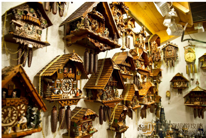
笑漪妹妹 Smile 黑森林特产布谷鸟钟

德国的各种产品，其品质、实用性及耐用性均获得一致的好评。德国出产的刀具和厨具均耐用持久，且价格比中国出售的价格低。而德国出产的皮具质量很过硬，钱包、手提包等不管是实用性还是设计感都很出众。除此以外，还可以购买带有德国当地特色的工艺品，比如布谷鸟钟、姜饼、手工艺品等作为旅行纪念。