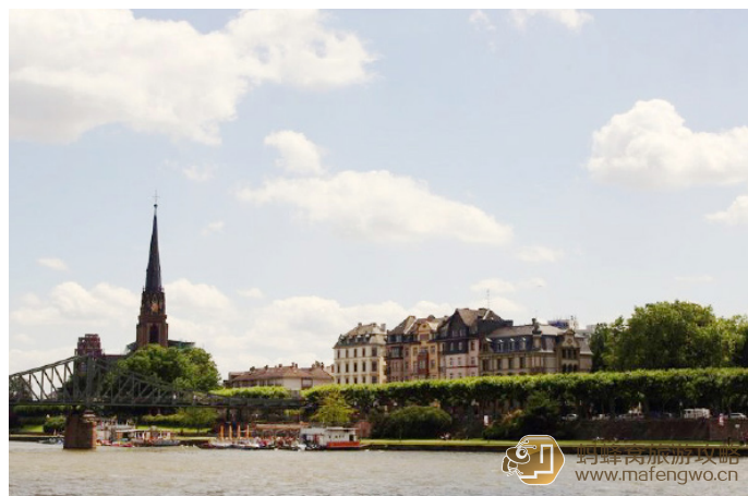
Lucifer 同学 美因河畔

上午从法兰克福最主要的建筑法兰克福大教堂开始游览，接着至罗马广场。参观完后向北至采尔大街、歌德大街感受热闹的购物街区。下午可至博物馆区参观几处博物馆。晚餐一定要到萨克森豪 (Sachsenhausen) 附近的餐厅，品尝正宗的法兰克福苹果酒，Affentor-Schänke 和 Wagner 都是不错的选择。