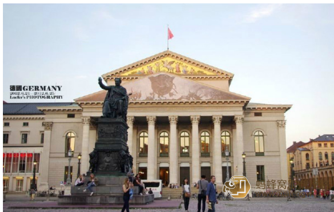
Lucifer 同学 歌剧院

慕尼黑拥有三大享有世界声望的乐团：巴伐利亚州立歌剧团、慕尼黑爱乐乐团和巴伐利亚广播交响乐团。六、七月有古典音乐节和歌剧节。尤其是在巴伐利亚国家歌剧院 (Bayerische Staatsoper) 上演了许多堪称歌剧世界之光的著名作品。歌剧院是一座宏伟美丽的古典主义建筑，每年的七月在这里都会举办慕尼黑音乐节。