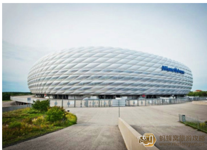
Lucifer 同学 安联球场和鸟巢，是出自同一个设计团队之手

安联球场是 2006 年德国世界杯开幕式赛场。球场占地面积 3.76 万 m 2 37600m，可容纳 66000 人。是拜仁慕尼黑俱乐部和慕尼黑 1860 俱乐部的公用球场。该体育场是欧洲最现代化的球场，它不同寻常的表面由 2874 个菱形膜结构构成，膜结构具有自清洁，防火、防水以及隔热性能，里边永远保持 350 帕斯卡的大气压。每个膜结构都可以在夜间被照成红蓝白三色，分别对应于拜仁、1860 以及德国国家队的队服颜色，几英里外都可以看到。