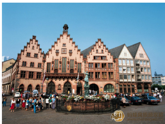
打死也不说 罗马厅

罗马贝格广场是法兰克福老城的中心，广场的名字来源于广场西面叫罗马厅 (Römer) 的 3 座连体楼房。这 3 座楼房为哥特式建筑，楼顶呈人字型，现今作为法兰克福的市政厅。广场中间面向市政厅的喷泉雕塑为正义女神，她手持着象征公正的天平。圣诞节期间，罗马广场是法兰克福圣诞市场所在地。