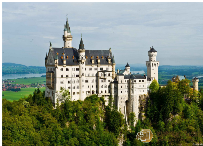
笑漪妹妹 Smile 新天鹅堡

大熊小猫 进入新天鹅堡参观, 需要根据不同的语言, 分成不同批次的参观小组。在指示牌上会显示每个批次参观的时间和实时的空余名额。告诉售票者你需要哪种语言的讲解及希望的参观时间 (当然越早越好), 随即票上会显示你被安排进堡的时间。