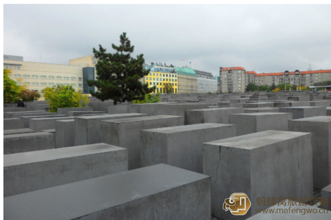
小虫子 ADADADA 欧洲被害犹太人纪念碑。虽然造型简单, 但穿梭在纪念碑之间, 也能感受到那份凝重。