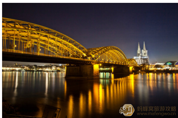
风清扬 科隆横跨莱茵河上的大桥 Hohenzollern

白衣小黑酱 走在霍亨索伦桥上，一边欣赏莱茵河畔的风景，一边猜测那些锁上的爱情故事，别有一番趣味。