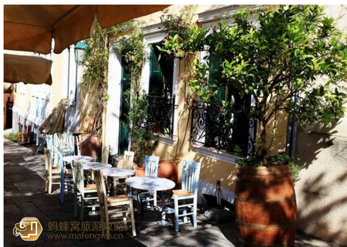
飒飒的飒飒 路边小店

波拉卡区范围很大, 商店非常多, 所以需要多花些时间好好的比较一番。在波拉卡购物除了货比 N 家外, 别忘了拿出你的杀价工夫来, 有时商家也会自动给予 6—7 折的折扣, 通常付现金可有较大的折扣, 付美金可好好讲价一番。