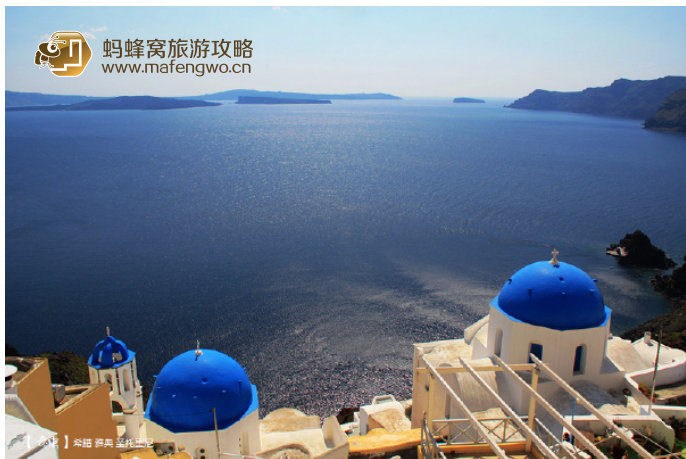
黄虫 圣托里尼的蓝白印象

圣托里尼有费拉（Fira）和伊亚（Oia）两个主要村镇。小镇都建在高高的悬崖之上。最佳的日落观赏地点在圣岛的伊亚小镇。伊亚，位于圣托里尼岛北面，从费拉可乘巴士直达，游人沿巴士站前的小街，往前走 10 分钟可到达悬崖的边沿，那里是看日落的最佳角度。在这里，沿途的每一条小巷都是一个独特的风景，有很多商店和酒吧，商店的招牌、橱窗都很有特色。明信片上的招牌式风景在一条小巷里，蓝色的圆顶教堂与白色的墙壁相映成辉，散发出超凡脱俗的美。