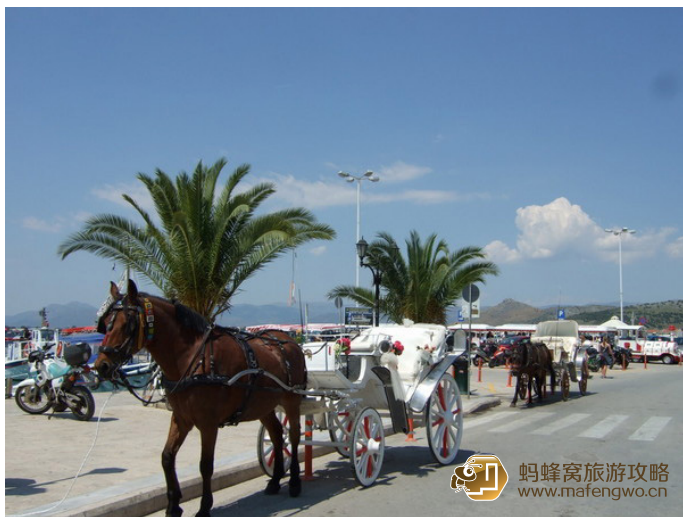
缭乱 美人 观光马车

在奥林匹亚，最好的娱乐活动就是去看露天的音乐和戏剧表演了。每年夏天都有露天的戏剧和音乐表演。逛博物馆也是一个不错的选择。奥林匹亚有几家博物馆，如运动博物馆和考古博物馆。不管你有什么时间去参观，你都可以有很大的收获。野营也是不错的选择，在无边的海滩上，您可以享受无限的乐趣。