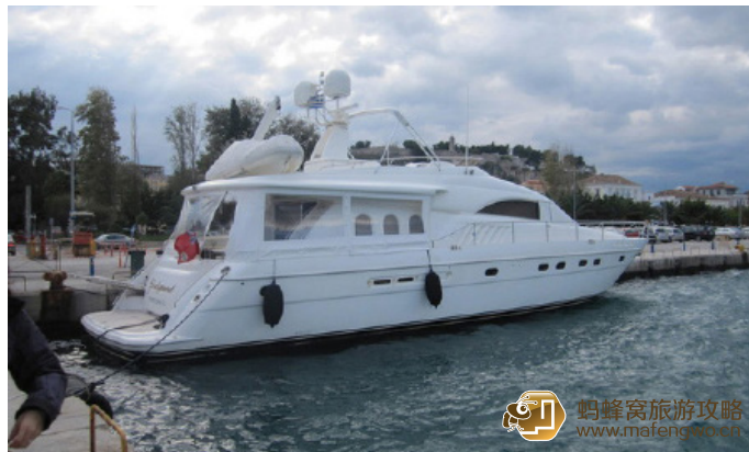
辣妹 停在海边的小艇

从克里特岛到圣托里尼岛约 4 小时，克里特岛到米克诺斯岛约 8 小时，克里特岛到帕罗斯岛约 6 小时，米克诺斯岛到那克索斯岛约 2 小时。