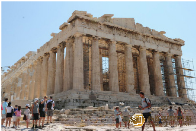
跟我走四方 帕提农神庙

雅典娜女神像复原图帕提农神庙是举世闻名的古代七大奇观之一，也是雅典最著名的古迹之一，有“希腊国宝”之誉，已有约4,000年历史。帕提农神庙相传是诸神从奥林匹斯山游曳到雅典的聚会地，帕提农神庙的雕刻装饰是由著名的建筑师和雕刻家菲迪亚斯承担的。从神庙西山墙中央的人像到最引人注目的排档间饰上都可以领略大师的伟大。