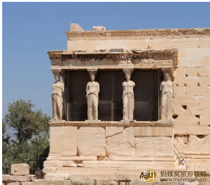
跟我走四方 艾瑞克提翁神庙

神庙东区是传统的6柱门面，向南采取虚厅形式。南端用6根大理石雕刻而成的少女像柱代替石柱顶起石顶，充分体现了建筑师的智慧，她们长裙束胸，轻盈飘忽，头顶千斤，亭亭玉立。由于石顶的份量很重，而6位少女为了顶起沉重的石顶，颈部必须设计得足够粗，但是这将影响其美观。于是建筑师给每位少女颈后保留了一缕浓厚的秀发，再在头顶加上花篮，成功地解决了建筑美学上的难题，因而举世闻名。现在真品收藏于博物馆，已用复制品顶替。庙中的雅典娜雕像直立戎装，是所有雅典娜雕像所依据的形象。像前有金灯，一年只需加油一次，另有棕榈树形的烟囱和木雕神像。神庙建筑历经沧桑，如今也只能依据这6根少女像柱想象当年的繁华了。