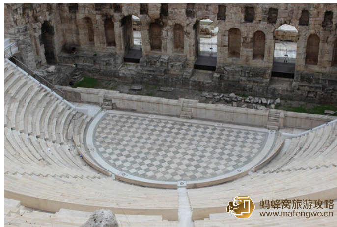
辣妹 阿迪库斯音乐厅

卫城南侧有两个半圆形的剧场，由门廊相连，充分体现了古希腊人对艺术的热爱。西侧的阿迪库斯音乐厅 (Odium of Herodes Attius) 现在仍然作为夏季露天音乐会和戏剧表演的场所，东侧的酒神剧场作为景点向游客开放。该剧场建于公元前 5 世纪，最早是向酒神祈祷的地方。