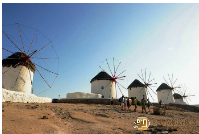
跟我走四方 海港风车