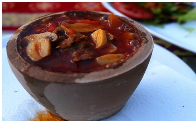
o 宠辱不惊去留无意 o 美味的瓦罐牛肉

卡帕多奇亚的瓦罐牛肉是牛肉配上蘑菇等辅材用浓汤熬制而成的特色美食。罐子不大, 但里面的料着实不少, 肉嫩汤浓, 相当美味。