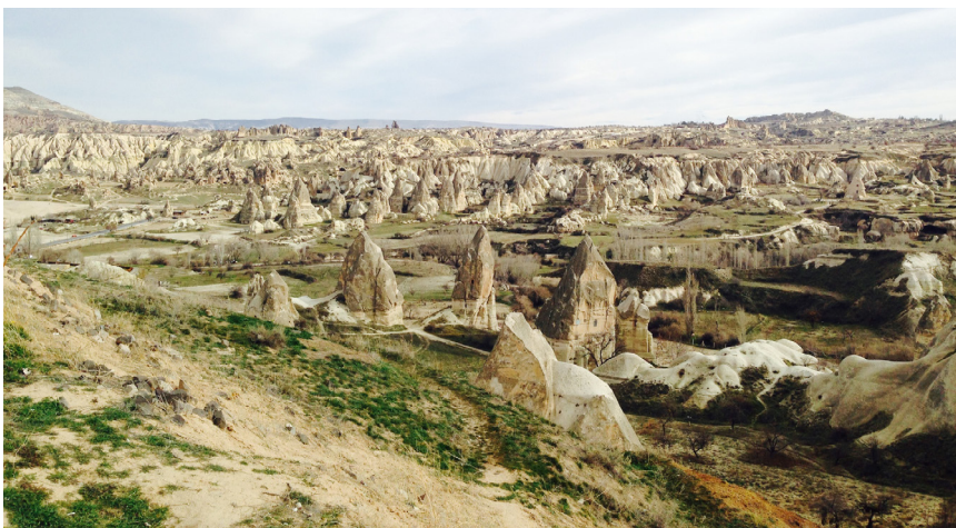
LILI 邢 格雷梅

游客一般都会选择居住在两个小镇，一个是格雷梅 (Göreme)，一个是于尔居普 (Ürgüp)，其中格雷梅的岩洞旅馆非常有特色。在卡帕多奇亚，一根根冲天而起的石笋是屡见不鲜的，按说这里非常不适宜居住，可是古代聪明的本地人就利用这些天然石柱建造了房屋。这本来是一个古老的传统，有点像中国陕北的窑洞。但现在，在格雷梅镇内，人们几乎把所有的石柱都拦腰掏空，然后地上铺上地板，设置暖气，安装电灯，还修建了完善的卫生间设施，最后形成一个又一个极具特色的岩洞酒店，非常有趣。