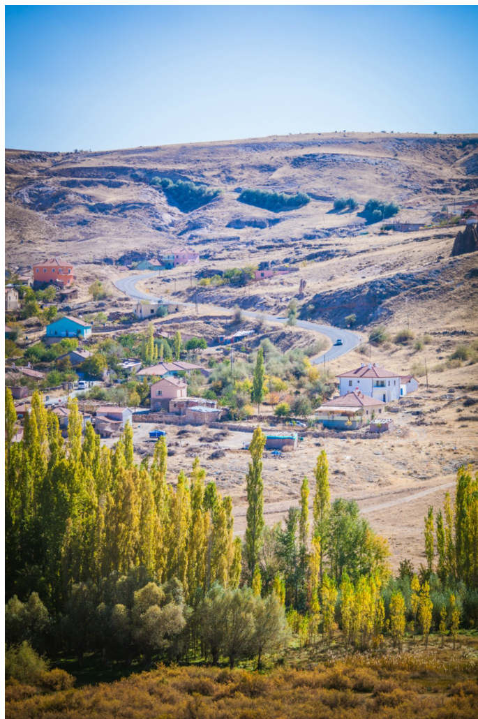
waner 佟医生 峡谷

烤肉菜: 如果说卡帕多奇亚大多是一片寂静的西域高原景致的话，伊赫拉拉峡谷绝对是一片浑然天成的荒漠绿洲了。峡谷中流淌着涓涓溪流，矗立着参天古木，绿色植物覆盖着山石土壤，花草虫鸣让人悠然自得。这个峡谷是远古时火山岩断裂后由溪水几亿年冲刷形成，可能是因为两侧的悬崖断壁遮挡了大部分的沙尘侵袭，峡谷中的植物生长的格外茂密。