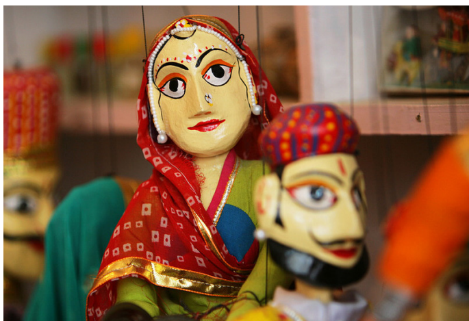
老一羊 生动的拉贾斯坦木偶

乌代布尔坐落在拥有深厚古典皇家文化和缤纷民间文化的拉贾斯坦邦，自然少不了多样的文化艺术活动。在这里观看一场独特的拉贾斯坦传统木偶戏或神秘艳丽的民间舞蹈、参与一节精致的细密画或者古典音乐的课程、或者前往民俗村（见第5页），深度接触这座艺术之城的灵魂。