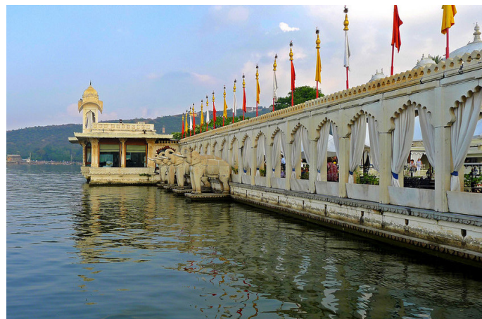
老一羊 遍布大理石象的加格曼迪尔岛

用时参考：Rameshwar Ghat:1 小时; Lal Ghat:30 分钟