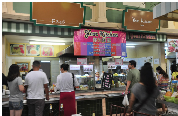
牛奶妹儿 你的厨房

地址: Ban San Fresh Market Kathu District, Phuket, Thailand 参考价格: 海鲜加工费 150 泰铢