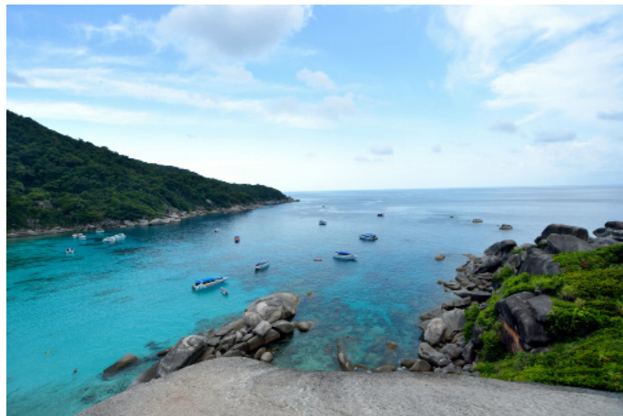
瞌睡蜜蜂 斯米兰群岛

到达交通：攀牙的寇立海滩和普吉岛的当地旅行社或酒店前台可以预定 1 日游或多日游项目，一日游旅行团 3000-5000 泰铢，三日船宿潜水约 15000 泰铢