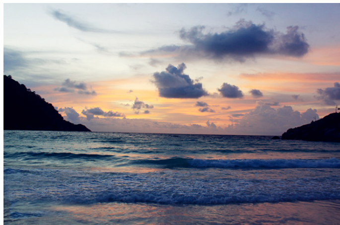
茉茉宝贝 心动的蓝色

茉茉宝贝 亲身体验告诉我，皇帝岛绝对是不可错过的小岛，这里安静、幽静、干净，岛上自然环境保护很好，还有各种动物；在皇帝岛的两天，让我忘记了都市喧嚣，忘记了时间，忘记了一切的烦恼。