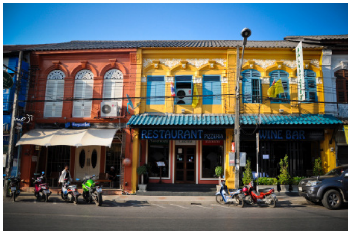
lmoji 整个小镇值得参观的是各色建筑

到达交通：嘟嘟车从机场到普吉镇约 600 泰株 / 车，从芭东、卡伦、卡塔到普吉镇约 600-700 泰株 / 车，车程都需要 1 小时左右；机场乘坐公交到普吉镇约 90 泰株 / 人，芭东海滩公交站到普吉镇约 30 泰株 / 人，车程都需要 40 分钟左右。