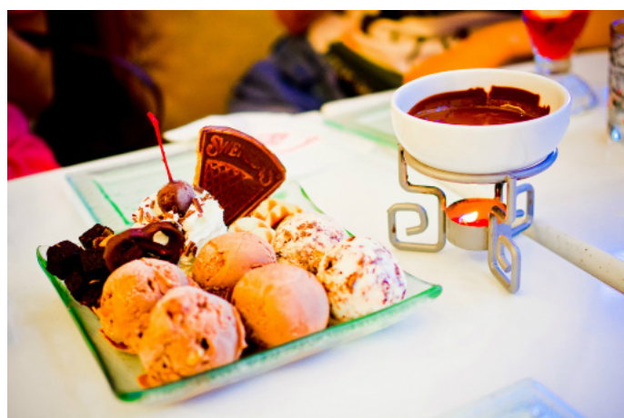
梁小新 superkid swensens

Swensen's 冰淇淋源于 1948 年美国旧金山。Swensen's 在东南亚及美洲各地家誉户晓，Swensen's 的冰激凌和咖啡在那里成了快餐的形势。它的冰激凌比起哈更达斯奶味更浓郁，而且口味也没有那么甜，价格也非常的适中，更符合冰激凌狂热者的心意。