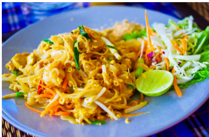
梁小新 superkid 泰式炒河粉