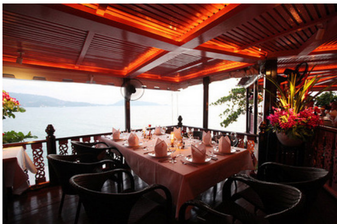
小妖 0725 傍晚还能欣赏夕阳

地址: 223 Prabamee Road, Kathu, Phuket, Thailand 网址: http://www.baanrimpa.com/ 联系方式: +66-76-340789 参考价格: 人均 2000 泰铢