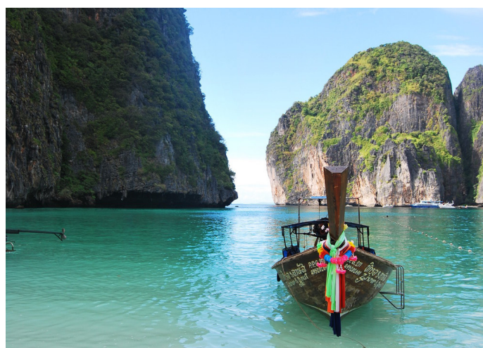
放羊的鹤 高山、碧绿的海水，配长尾船，绝对普吉的标志

到达交通：可乘嘟嘟车，单程约 600 泰铢 / 车，也可包车环岛游，约 1000 泰铢 / 车；也可租摩托车自驾，约 200 泰铢 / 天。