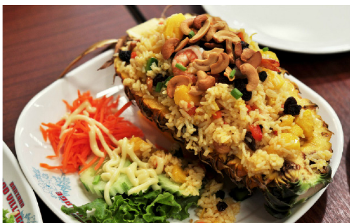
牛奶妹儿 菠萝炒饭

泰式菠萝炒饭，运用泰国香米的香气，搭配菠萝以及什锦蔬菜等大火快炒，咸咸酸酸甜甜的口感，才吃一口就会让人食欲大开，搭配腰果一起入口，口感层次丰富，尤其把饭装在菠萝里一起上桌，视觉效果奇佳。