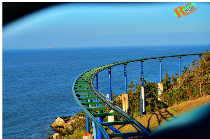
River2014 大河 太空漫步的轨道凌空修建

摩天岭紧靠海边，是一片起伏的山岭，沿着山岭修建了海边栈道，可以凭栏观海，海天一色与山海景观尽收眼底。景区盛产水晶，地上有水晶展馆，地下水晶洞密布，令人叹为观止，但现在已经不允许开发了，只供参观。山腰的悬崖峭壁间有空中栈道，人在栈道上走过，巨浪在脚底下咆哮，非常刺激，极其考验勇气。这里还有亚洲最长的跨海索道通往成山头，可以搭乘悬空索道穿行于海边的峰峦翠柏之间，体验云间穿梭，俯视碧海仙境。