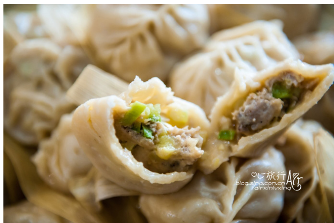
加勒比海绵宝宝 鲅鱼饺子

鲅鱼饺子在胶东一带很有名气，威海人也特别爱吃。有些是用鲜美的鲅鱼肉搭配西葫芦丁，让包子的馅多汁而清香。基本在每家餐馆都能吃到。