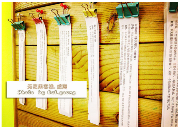
К а т ю ш а 老板很贴心地提供了主要景点的便签，可以随意领取

无敌小恐龙 预定的是海景房，主要是喜欢上了窗口外的那片纯净蔚蓝的海水和沙滩。看海效果也很好，就连续订了 5 天，还免费赠送接机服务。