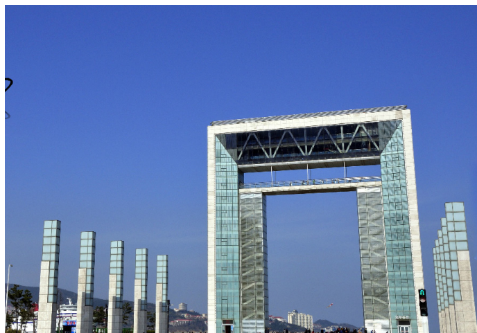
Jawei 幸福门就在海边，从这里看海，天蓝海水蓝蓝，美不胜收