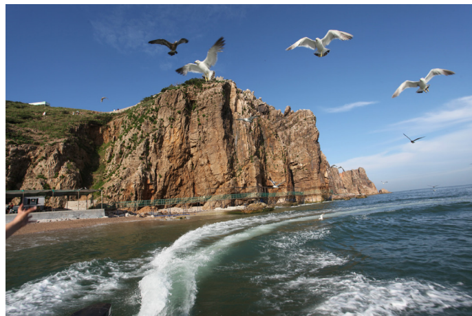
老马 这里果然是鸟儿的天堂。最不怕人的是小海鸥，棕色的。稍远是白色的大海鸥，高山顶上是密匝匝的黄嘴白鹭。礁石缝里有一窝窝的鸟蛋