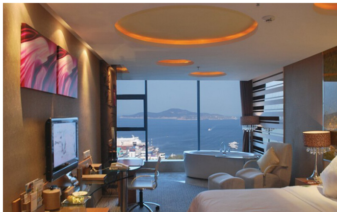
东门 超级海景，泡着浴缸看海景实在太舒服了

地址：威海市环翠区新威路 58 号（近华联商厦） 联系方式：0631-5222888 到达交通：乘坐 K2、28、30、95、113、114 路公交车可直达 参考价格：标间 284 元 / 起