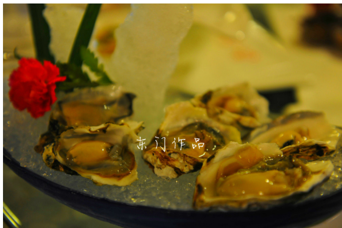
东门 威海的海鲜味道都很美味

同时，威海也是中国最早与韩国通航的城市，当地生活着很多韩国人，因而也不乏味道非常正宗的韩国餐馆。