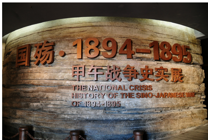
风语战士 中日甲午战争博物馆